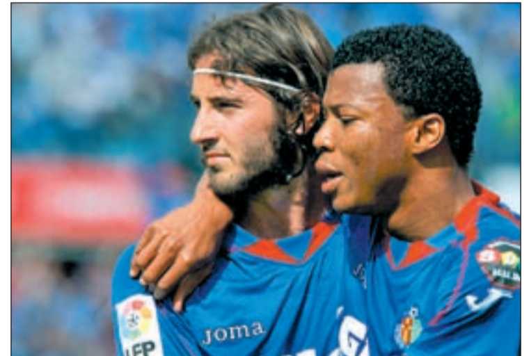
Granero y Uche fueron fundamentales para ganar al Osasuna

En el vestuario del Getafe todos coinciden en señalar que el ambiente de trabajo, tan importante en todos los ámbitos, ha mejorado con la llegada de Míchel al banquillo azulón. Ahora sólo falta ratificar ese ambiente con la permanencia definitiva.