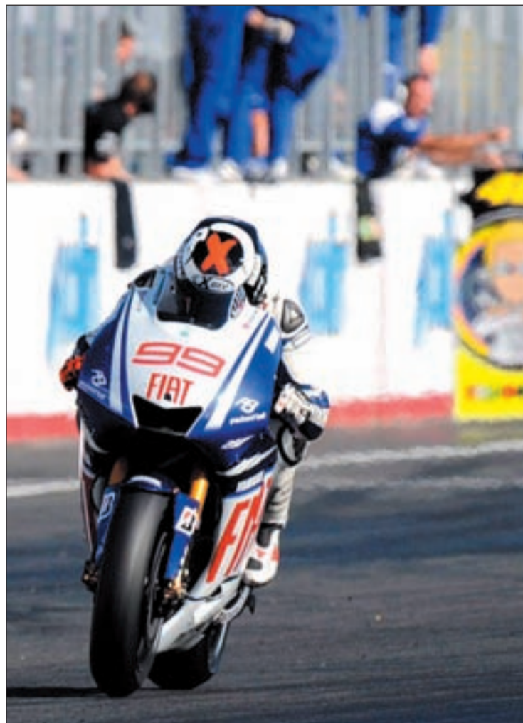
Jorge Lorenzo no pudo acabar la carrera disputada en Jerez

Entre todos estos gigantes de las dos ruedas, y también como favorito a la victoria final, conti-