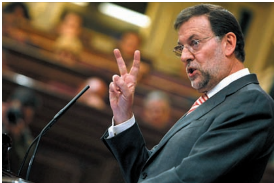
Rajoy replicó con dureza al presidente Rodríguez Zapatero durante el debate

RAJOY EN EL DEBATE SOBRE LA SITUACIÓN ACTUAL