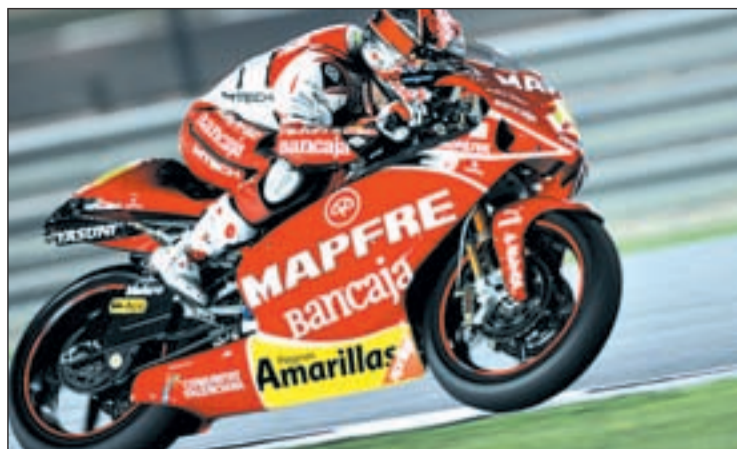
Bautista estuvo próximo a la victoria en el GP de España