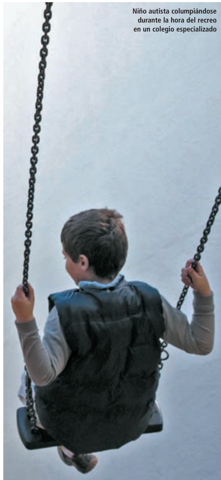
Niño autista columpiándose durante la hora del recreo en un colegio especializado

En este programa, pionero en la Comunidad de Madrid, trabajan específicamente tres