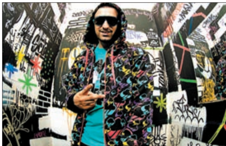
Tote King, una de las estrellas nacionales que actuarán en el Festival

Además de conciertos, el festival contará con otras disciplinas de cultura urbana, entre ellas, la Red Bull Batalla de Gallos y la Eastpak breakdance battle. Este año aumentan las