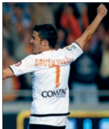
Villa y el Valencia vuelven a reir

tuvo su reflejo en el terreno de juego, donde los futbolistas eran una sombra de lo que habían sido. Algo natural, ya que, como todo trabajador, los jugadores necesitan cobrar sus salarios a tiempo para rendir al máximo. El tridente formado por Villa, Mata y Silva es temible, aunque el canario no jugará.