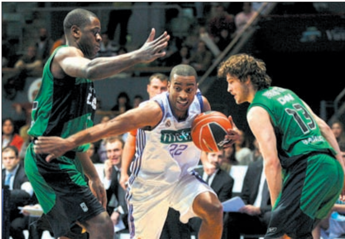
Partido entre el Real Madrid y el Joventut en esta misma temporada

Los partidos jugados entre ambos equipos en este año dejan un balance favorable a los madridistas que ya ganaron en la pista del DKV en la séptima