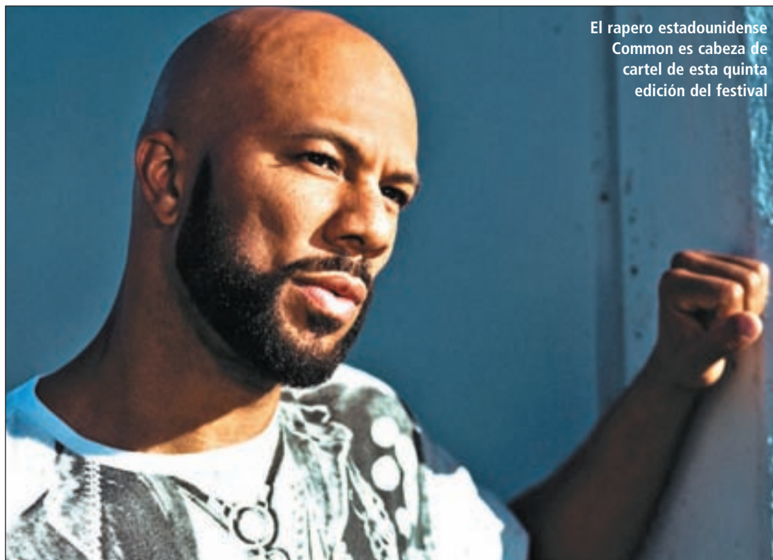
El rapero estadounidense Common es cabeza de cartel de esta quinta edición del festival

HIP-HOP, BREAKDANCE Y BATALLA DE GALLOS EN EL TELEFÓNICA ARENA