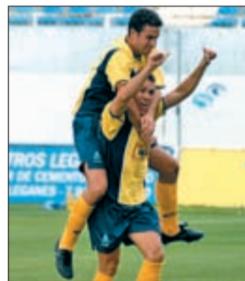
Jugadores del Alcorcón

empate en el campo del Ciudad Lorquí, aunque la noticia más destacada estos días en la entidad pepinera ha sido el cambio de entrenador. El Real Jaén será su rival, un equipo cuya calidad más destacada esta temporada ha sido la solidez defensiva, que lo ha llevado a ser el equipo menos batido.