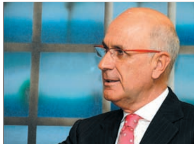
Duran i Lleida quiere que el ICO garantice la totalidad de los créditos

Le acusó de mala gestión ante la destrucción de empleo, en la política financiera del ICO, ante la morosidad financiera y de haber anulado las inversiones en I+D. Le pidió la reforma y restructuración del ICO para que sea más ágil en la concesión de créditos y que ésta institución garantice el cien por cien de los créditos a las empresas con solvencia patrimonial.