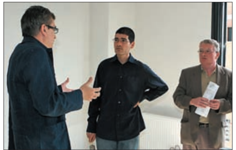
Propietarios en una visita

EN LA EDICIÓN DIGITAL: PIDEN DONACIONES PARA EL JUICIO CONTRA LA MELA