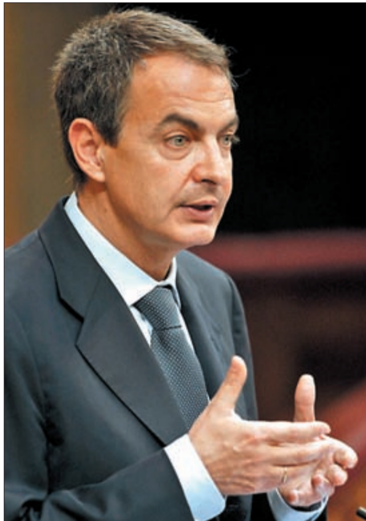
Rodríguez Zapatero, Presidente del Gobierno, durante su intervención

El Presidente, que reconoció haberse "equivocado en algunas previsiones", centró su discurso en las medidas aprobadas por el Gobierno sobre todo el Plan E que, dijo, "ya empieza a dar sus primeros frutos". Ha calificado la pérdida de empleos de abrumadora . "La economía