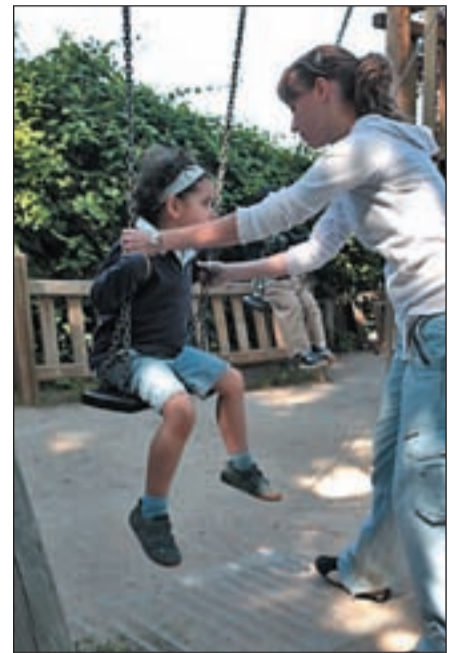
Un niño en un columpio

Sin embargo, en la Comunidad de Madrid sólo existen seis centros de este tipo, en los que se presta una atención especializada a cada niño dependiendo de sus características y de sus posibilidades.