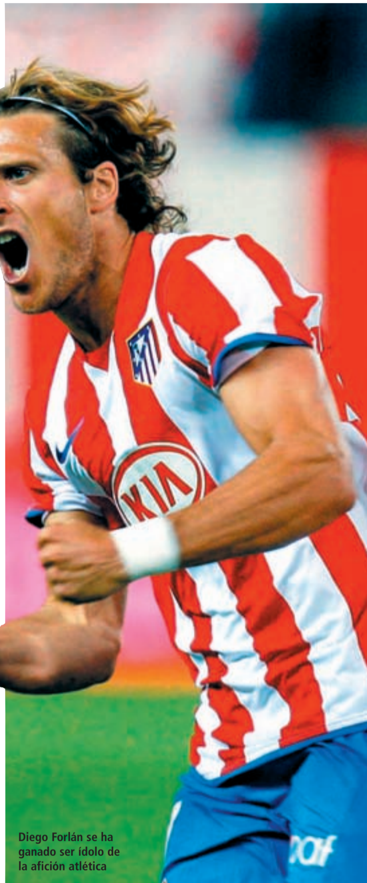
Diego Forlán se ha ganado ser ídolo de la afición atlética

El Valencia, después de todos sus problemas económicos, ha resurgido en esta Liga y buena prueba de ello fue la victoria del pasado sábado ante el Real Madrid. El conjunto que entrena Unai Emery pasó por encima de los de Juande con un 3-0 incontestable. Eso sí, la goleada dejó la mala noticia para los chés de la sanción de Silva, que no podrá estar en la cita del Vicente Calderón. Sin duda, una gran alegría para el Atlético y para Abel, que tendrá un quebradero de cabeza menos.