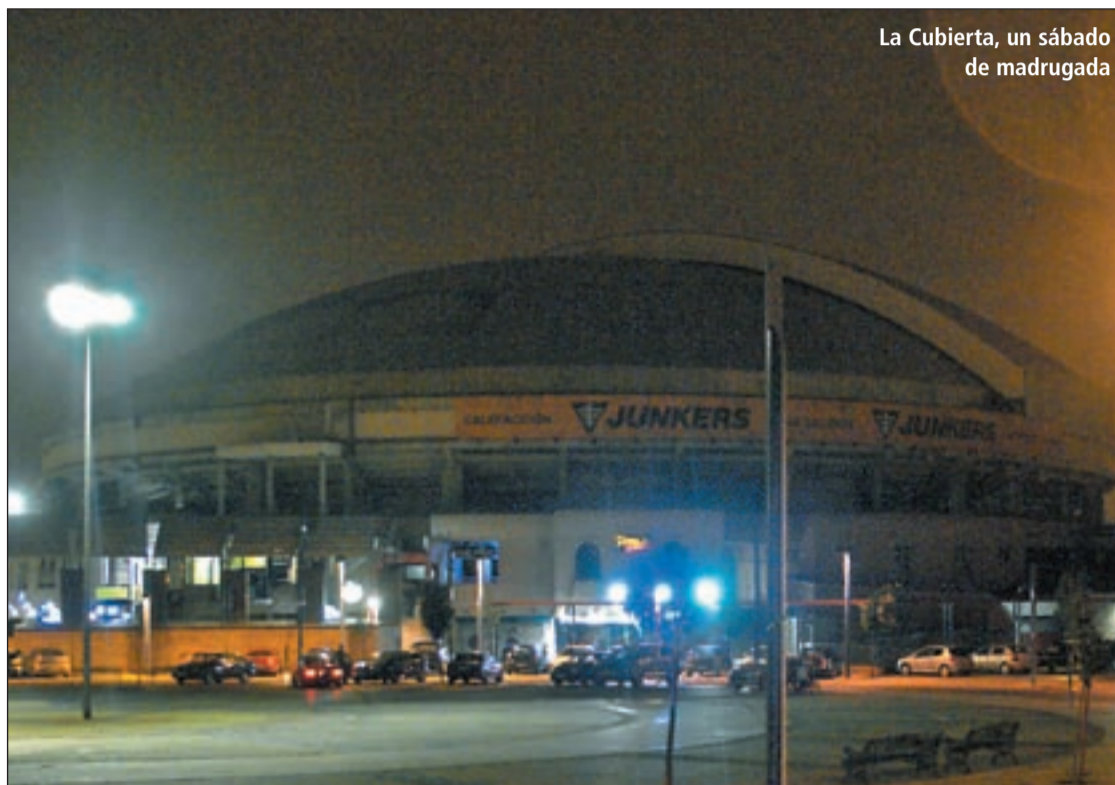
La Cubierta, un sábado de madrugada