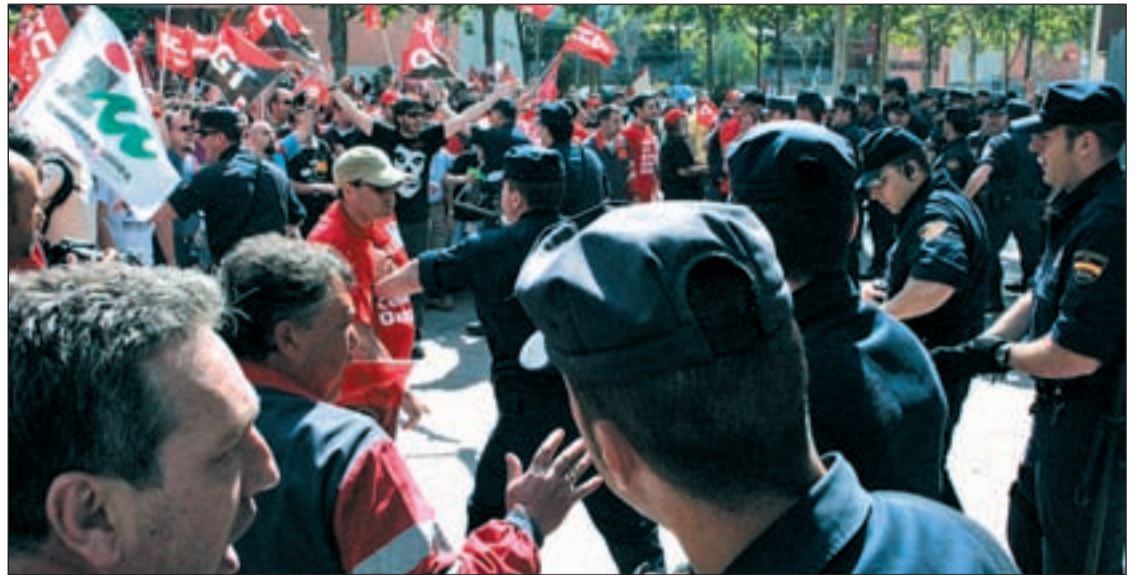
Protesta contra los ERE en ArcelorMittal, Iveco y BP frente a la Asamblea el pasado jueves

Esta situación ha provocado la alarma de la oposición y sin-