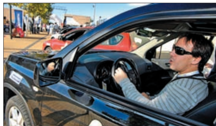
El sector del automóvil podría perder cien mil empleos más

narios, critica que España sea el "único" mercado de Europa sin ayudas directas. El PP propone subvencionar con 1.000 euros la compra del coche y Fiat quiere comprar Opel y crear en Europa el gigante del automóvil, al tiempo que Chrysler le urge a tomar su capital.