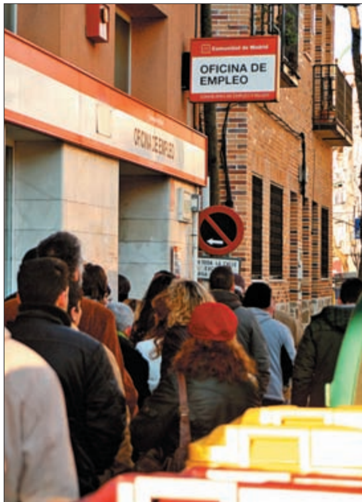
El paro ralentiza su crecimiento, aunque continúa siendo alto

Actualmente hay en España 1.033.224 desempleados que no perciben prestación y de ellos, 300.000, según el ministro Corbacho, no cobran nada. Y todo ello sin contar que al menos hay otros 450.000 parados fuera de las listas del INEM, según el propio Instituto, y que no computan como parados por estar en cursos de formación o como demandantes de empleo "con disponibilidad limitada". La disminución de las cifras en abril se debe, según el Gobierno y los sindicatos, a la Semana Santa y a las medidas del Gobierno, que han generado ya 62.896 empleos, según el presidente del Gobierno, Rodríguez Zapatero. La valoración de las fuerzas políticas tras conocerse las cifras es de "prudencia" y la de esperar a mayo para comprobar si se consolida el ansiado "frenazo".