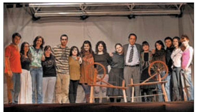
Alumnos de Medicina que actúan en Bodas de Sangre