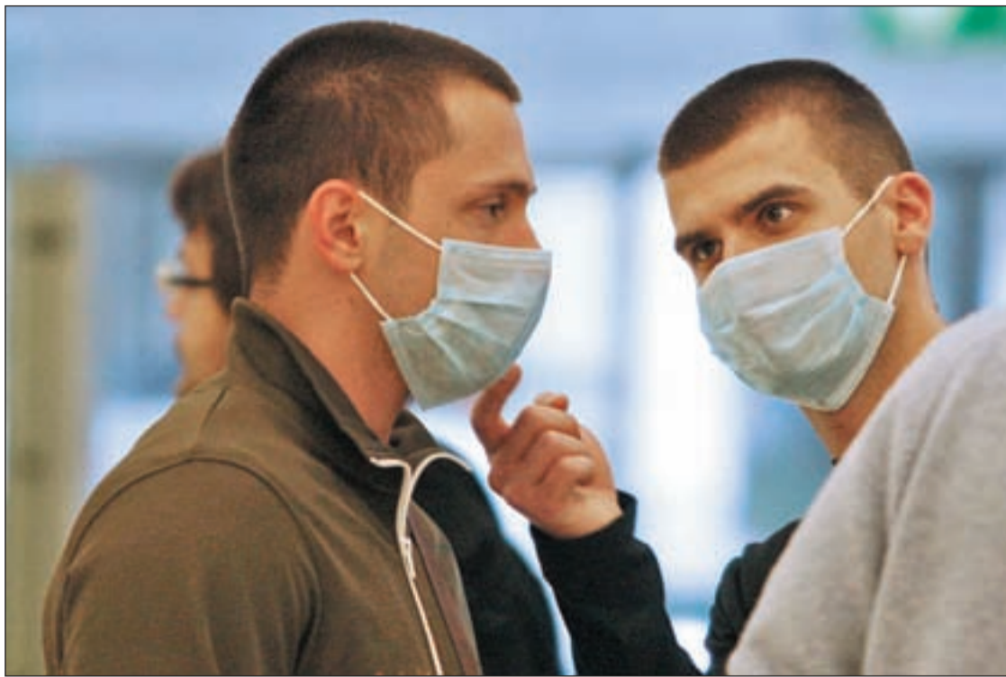
Viejeros con mascarillas en el aeropuerto de Barajas GENTE

PIDEN EL CONTROL POSTAL DE IMPORTACIONES ILEGALES DE MEDICINAS