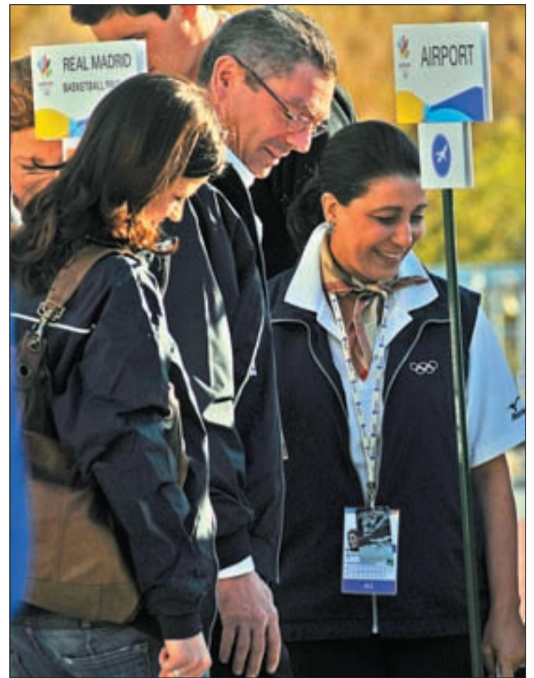
El Alcalde y la Presidenta de la Comisión

Durante la visita, caracterizada por el hermetismo hacia los medios de comunicación, los