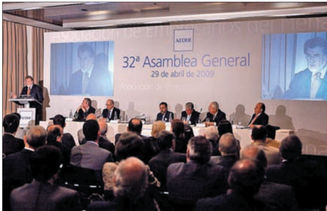
Grupo de empresarios durante la XXXII Asamblea General de AEDHE