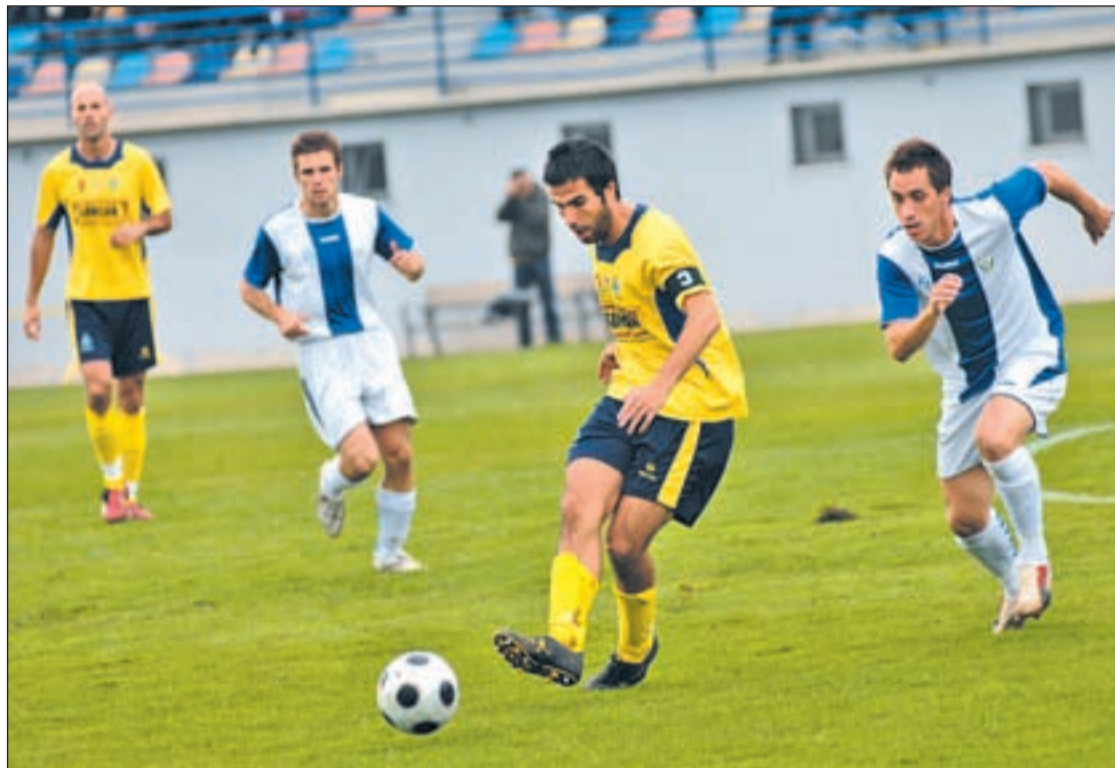
Partido entre el Leganés y el Alorcón en esta misma temporada

A pesar de sus problemas económicos, el CD Leganés llega a esta última fecha en una posición privilegiada para acceder a la fase de ascenso. Los pepineros son terceros pero deben visitar al Ciudad Lorquí un equipo que ha cosechado dos derrotas consecutivas que lo han relegado a la séptima posición. Por su parte, el Alorcón viaja sin presión al campo del Vecindario. Los hombres que dirige Anquela han realizado una campaña formidable ya que no partían entre los equipos favoritos y en estos momentos ocupan la cuarta posición que les