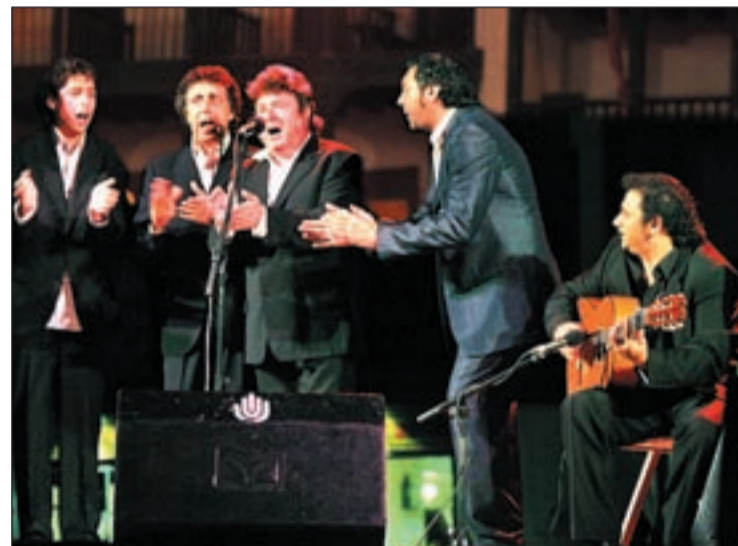
Enrique Morente en un concierto