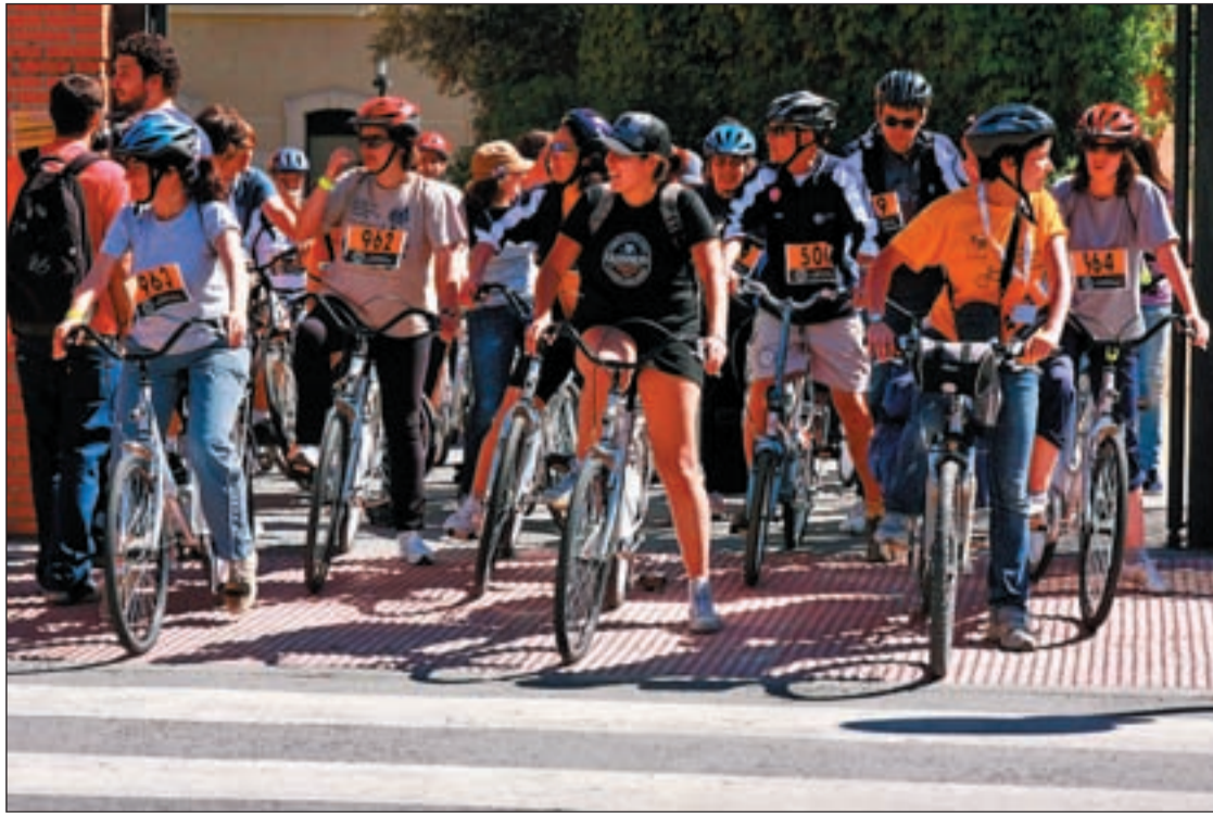
Grupo de participantes en la Caravana Universitaria por la Movilidad Sostenible

MEDIOS DE TRANSPORTE QUE RESPETAN EL MEDIO AMBIENTE