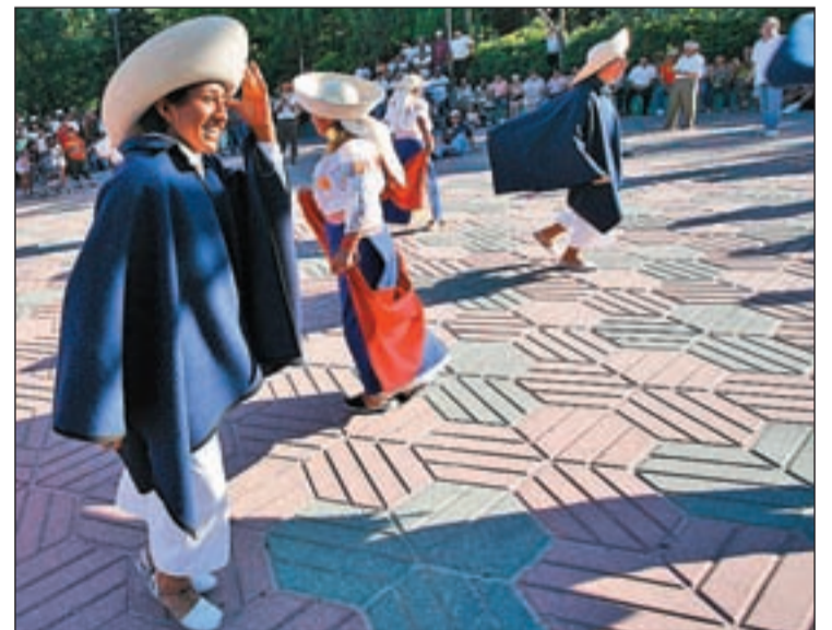
Un encuentro de ecuatorianos en Madrid

La mayoría de los ecuatorianos encuestados en el estudio de mercado de Mi Casa en Ecuador (el 56 por ciento) dijo estar dispuesto a adquirir una vivienda cuyo precio oscile entre 26.000 y 40.000 dólares. El precio, según el análisis, ha sufrido un leve ajuste, probablemente debido a la situación económica. Otra tendencia es el incremento del interés por la compra de terrenos. Así, el 51 por ciento quiere comprar su casa, el 32 por ciento, terrenos, el 9 por ciento, un piso, y el ocho por ciento, locales comerciales.