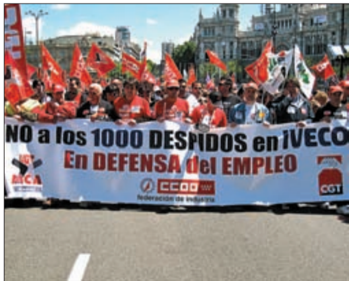
Trabajadores de Iveco en la manifestación del Primero de Mayo