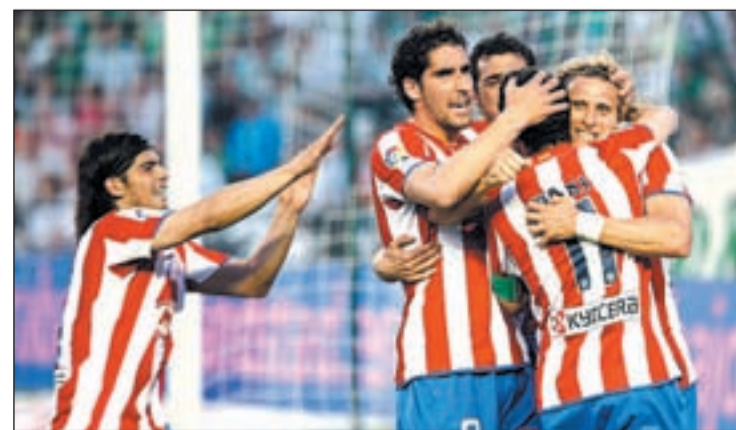
El equipo ganó con solvencia el partido contra el Betis

Este fin de semana, el Atlético recibe al Espanyol, que se ha sacudido sus problemas y llega en plena racha de resultados.