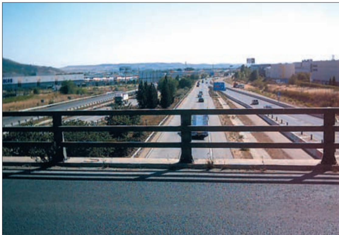
Vista de la carretera A-2 desde una variante aérea