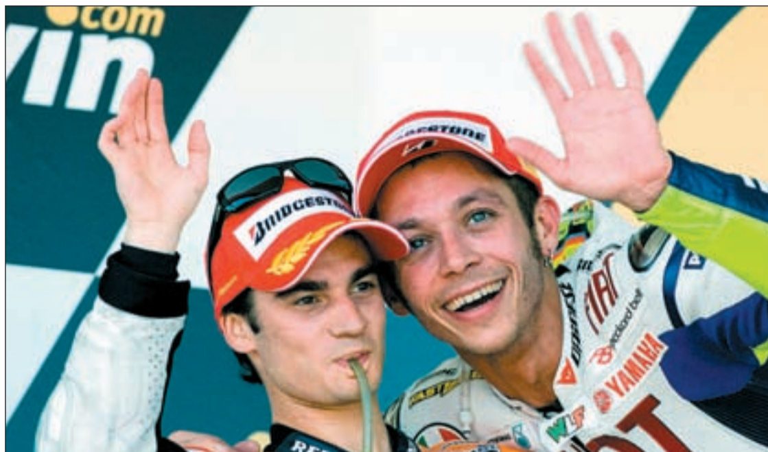
Pedrosa y Rossi celebran su actuación en el podio del circuito de Jerez