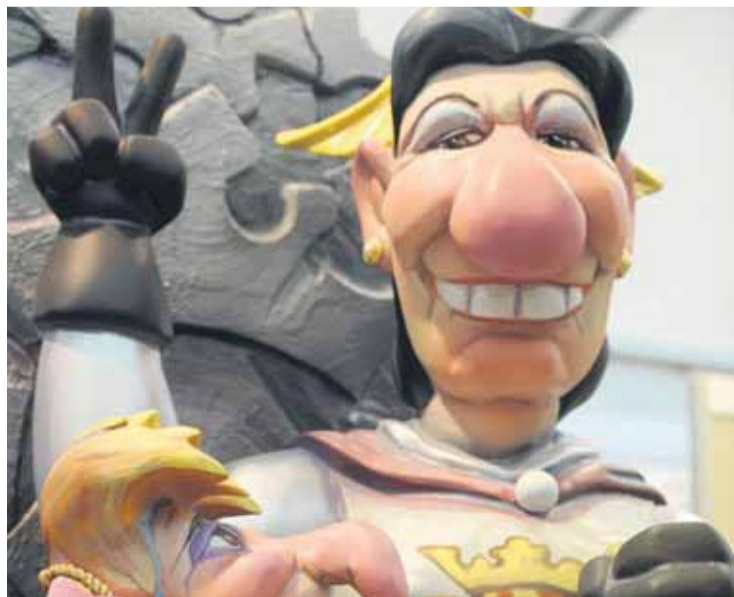
Hasta su clausura, se espera que más de 90.000 personas la visiten.

La Exposición del Ninot ha recibido la visita de más de 80.000 personas desde que fue inaugurada el pasado 7 de marzo, la misma cifra que alcanzó la muestra durante toda su exhibición el año pasado. De este modo, la exhibición "va a superar clara y ampliamente las cifras de visitantes de 2008", según recaló el concejal de Fiestas y Cultura Popular del Ayuntamiento, Félix Crespo. El edil subrayó que hay que tener en cuenta que la Exposición se clausura los días 14 y 15 de marzo por lo que se espera llegar a los 90.000 visitantes. Todos estos datos confirman que la ubicación, por sexto año en la plaza exterior de Nuevo Centro, "ha sido muy bien aceptada por la opinión pública y se nota en las cifras".