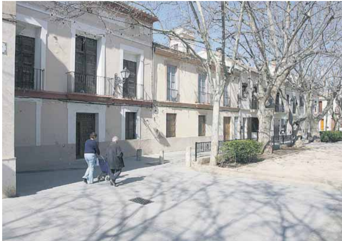
Ya poco queda del Campanar huertano, que apenas es ya pasto de la nostalgia.

Voro nos mete de nuevo en la pista mientras rastrea mentalmente el Camí Vell de Paterna. Ha necesitado señalar al "campanari del poble", eje central de su