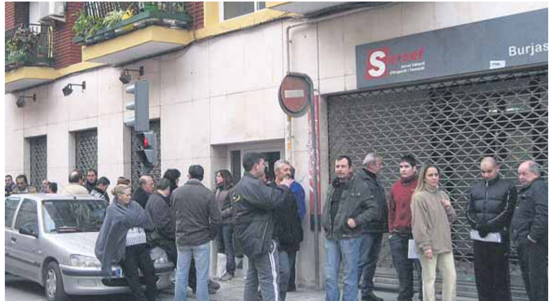
La catalogación de las oficinas no se actualiza desde hace una década.

El sindicato CSI-F denuncia que ante la actual situación de crisis los centros se ven desbordados y se producen situaciones de tensión