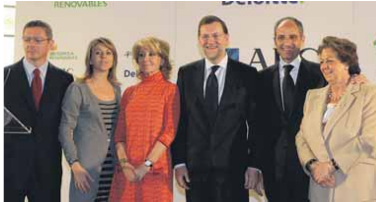
La cúpula del PP quiso apoyar al President de la Generalitat.

después de finalizar una gira operística en Estados Unidos, el tenor granadino José Manuel Zapata ya se encuentra inmerso en los ensayos del concierto que incluirá conocidos tangos como "Mi Buenos Aires querido", "A media luz" o "Por una cabeza". Además, Zapata ha avanzado que Diego "El Cigala" interpretará en solitario la adaptación del tango "Niebla del Riachuelo" al ritmo del bolero, incluido en su álbum "Lágrimas negras".