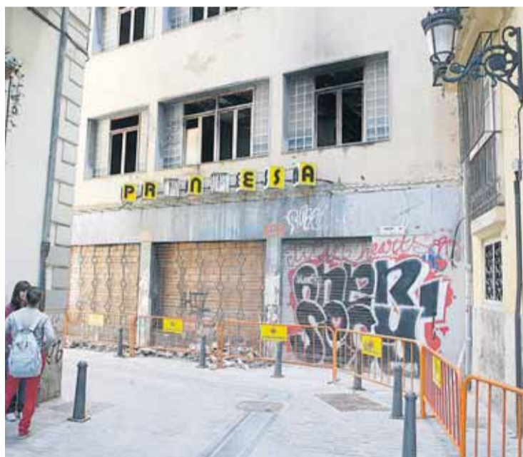
El derribo del mítico teatro comenzará en los próximos días.

número 1 de la calle Rey Don Jaime y 5 de Moro Zeit, han formalizado en el Ayuntamiento de Valencia su intención de llevar a cabo la demolición del inmueble. Visto el escrito presentado por la propiedad, desde el Ayuntamiento se le ha instado a presentar, en la mayor brevedad posible, el Estudio de Salud y Seguridad preceptivo para acometer las obras, que podrían comenzar en los próximos días.