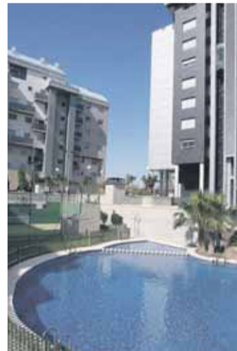
El "nuevo" Campanar.

El viejo Campanar se ha despedido ya de sus gentes excepto de Voro, que permanece en el parque olisqueando el tiempo... "Jo ja no vaig enlloc. Ací em quede".