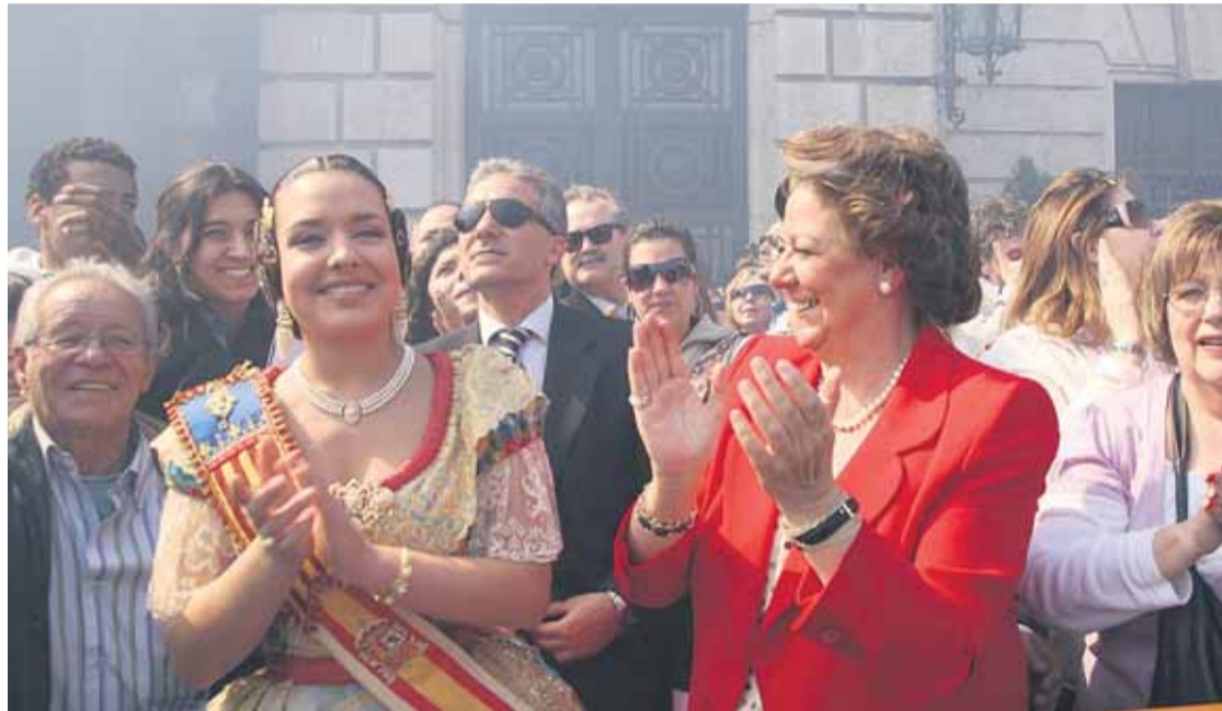
La Alcaldesa de Valencia, Rita Barberá, y la Fallera Mayor, Marta Agustí, disfrutaron la mascletà a pie de calle.

El balcón del Ayuntamiento no deja de llenarse día a día de personalidades que quieren disfrutar del estruendo de las pirotecnias