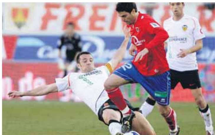
El Valencia lleva varios encuentros sin conseguir los tres puntos.