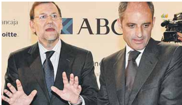
Mariano Rajoy con Francisco Camps.

El PNV "seguirá dirigiendo este país, sea desde donde sea", aseguró Juan José Ibarretxe, que especifica que su apuesta es "una alianza estratégica fuerte" con un gobierno de coalición con el PSE-EE. Según Ibarretxe, Euskadi "sigue siendo nacionalista" y la alianza PSE-PP sólo puede lograrse "de manera trampeada" por la ilegalización "y el apartamiento de la izquierda abertzale". El lehendakari en funciones estará "hasta el último día al timón del país" y consideró que debe formarse un Ejecutivo "fuerte" para afrontar la actual situación de crisis y los principales retos del País Vasco. Preguntado por si su formación tiene asumido el paso a la oposición, apuntó que lo que "tiene asumido es que ha ganado las elecciones" y que su resultado "ha sido magnífico".