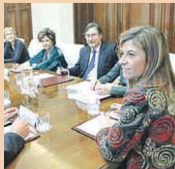
La ministra, Bibiana Aído.

El Comité de Expertos, equipo formado para asesorar al Gobierno sobre la nueva Ley del Aborto que prepara el Ejecutivo, propone que las interrupciones pue-