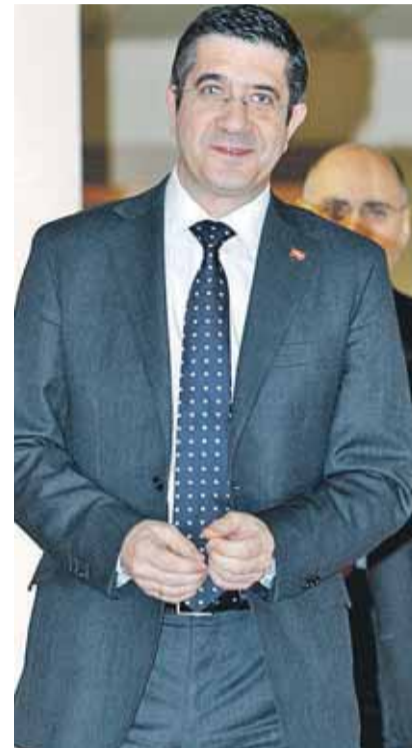
Patxi López, al concluir las elecciones.

ños. El PSdeG ha anunciado que celebrará un congreso para renovar sus filas en Galicia tras la derrota de Emilio Pérez Touriño, que ha presentado su dimisión como secretario general de los socialistas gallegos.