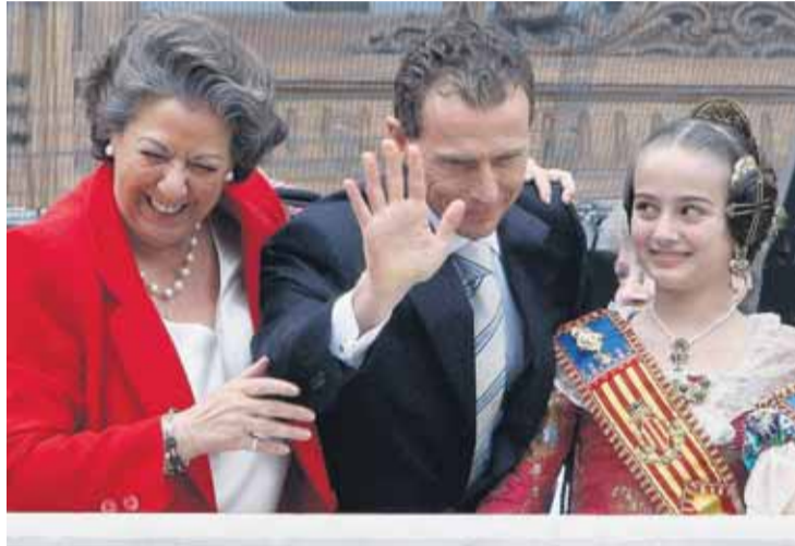
Emilio Butragueño visitó esta semana el balcón del Ayuntamiento.

Después de la Cabalgata del Ninot Infantil del pasado domingo, en la que más de 1.500 personas –entre falleros, músicos y responsables de organización– desfilaron por las calles de Valencia, recreando el mundo de la magia, los juegos tradicionales o la Valencia del futuro, este sábado día 7, llega el turno de los mayores. A las 22.30 horas dará comienzo la Cabalgata del Ninot, que recorrerá las calles Xàtiva, Marqués de Sotelo y Plaza del Ayuntamiento. Una vez finalizada, en la Plaza del Ayuntamiento se disparará una mascletá de colores a cargo de la pirotecnia El Portugués. En esta ocasión, las comisiones elegidas para el desfile han sido Borull-Turia, San Miguel-Plaza Vicente Iborra, Plaza del Árbol, San José de la Monta-