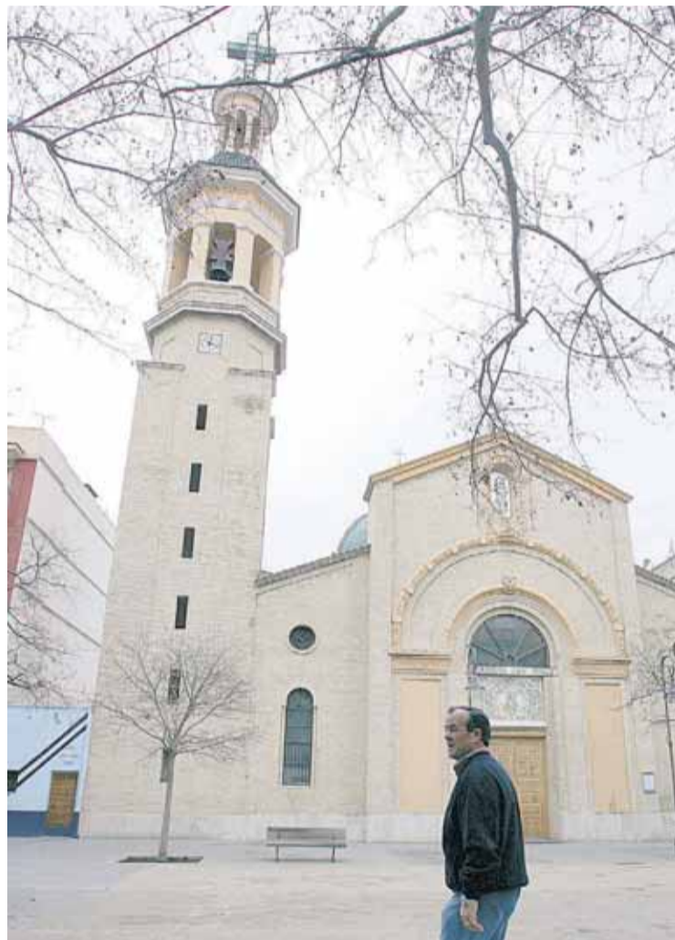
La Iglesia de San Roque es un punto habitual de reunión de vecinos.

El arco sucumbió para siempre bajo el Desarrollismo, eso sí, esta vez no hubo excusa. El pueblo ocupado pudo ser testigo.