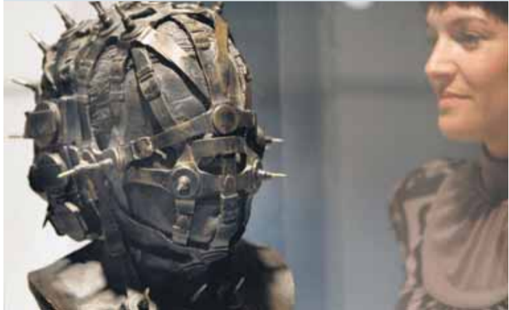
"Watchguardian, head V", busto de hierro-aluminio de H.R.Giger que forma parte de la muestra "Swiss design in Hollywood" con trabajos de los diseñadores de "El señor de los anillos", "Matrix" y "Alien", inaugurada en la Universidad Politécnica.