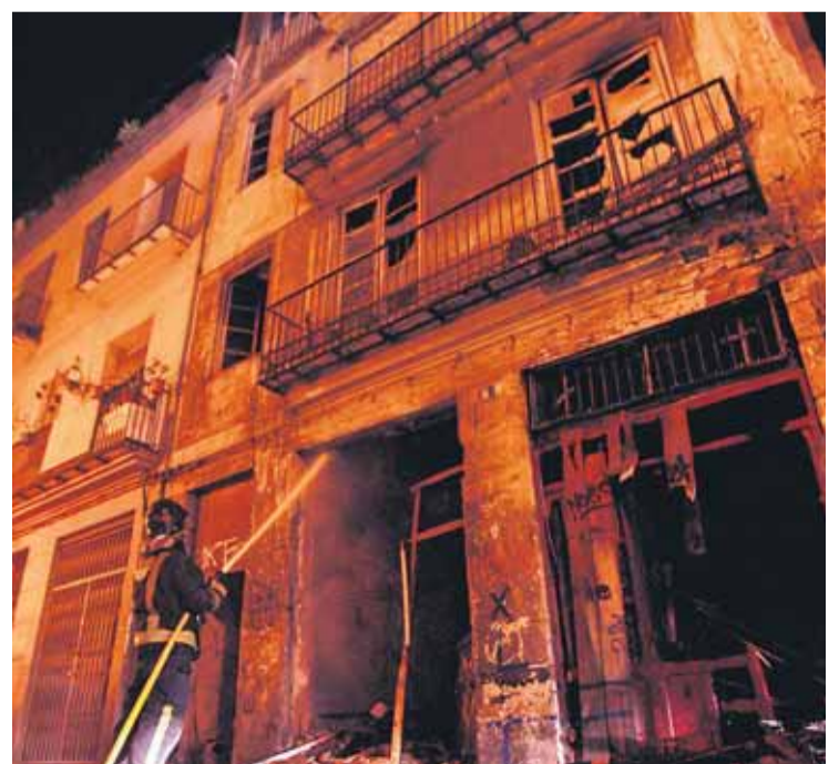
El edificio tendrá que ser derribado tras el incendio sufrido.

El Ayuntamiento de Valencia demolerá el Teatro Princesa cuando se finalice el documento de declaración de 'amenaza de ruina inminente' del inmueble. Los técnicos de Disciplina Urbanística aseguran en su informe que los edificios "han rebasado el umbral de la seguridad" y "constituyen una amenaza real para la seguridad pública", por lo que ordenan la demolición "inmediata" y el vallado del solar resultante. Por otra parte, y ante la demanda de grupos políticos, culturales y ciudadanos, la alcaldesa de Valencia, Rita Barberá, ha afirmado que se va a mantener la calificación de 'dotación cultural' del solar del Teatro Princesa, declarado en ruinas tras un incendio, y ha afirmado que no quiere "improvisar" sobre su futuro cuando aún desconoce la intención de los propietarios.