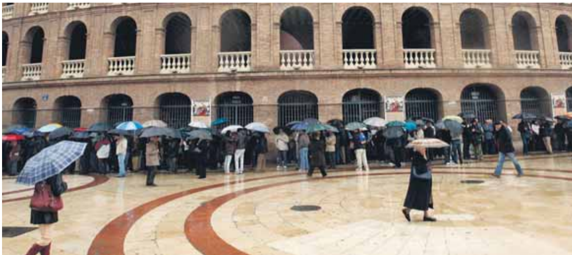
La cola en el primer día de venta de las entradas daba la vuelta a la plaza.

No parece haber crisis en el sector taurino. La venta de localidades para asistir a la Feria Taurina de las Fallas 2009, en la Plaza de Toros de Valencia ha desatado esta semana una locura en Valencia.