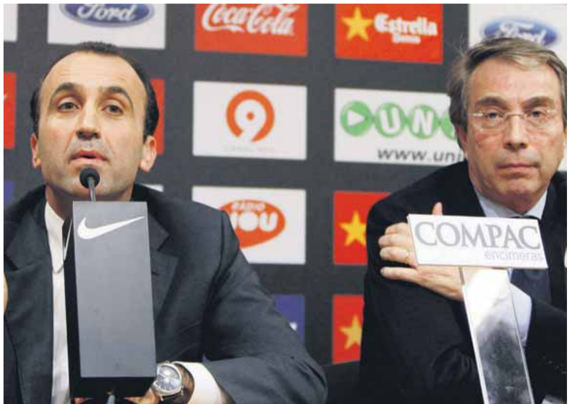
El club se encuentra en una situación económica insostenible y debe las fichas a sus jugadores.

LAS ÚLTIMAS NOTICIAS DE SU CIUDAD EN LA WEB