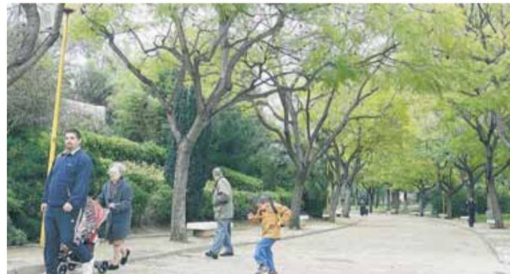
El Parque de Benicalap se urbanizó en los 80 sobre la histórica huerta.