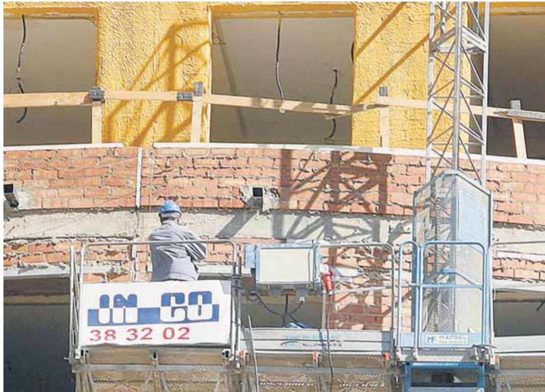
La Comunitat ha sufrido la segunda mayor subida de parados del territorio nacional.

Del total de desempleados de la Comunitat Valenciana, 219.581 son hombres y 195.510 mujeres y 56.305 menores de 25 años. Por sectores, el mayor incremento se dio en Servicios, con una subida de 13.830 parados en febrero, seguida de Construcción, con 4.750 personas, Industria, con 4.513 personas, y Sin empleo anterior, con 1.692, y por último, en Agricultura, con 1.461 nuevos parados. Por provincias, Castellón fue donde más aumentó el paro en términos relativos, un 11,35%, lo que supone 4.865 personas más, de modo que el paro alcanza los 47.721 desempleados; seguida de Valencia, en la