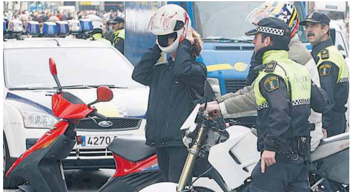
La Policía Local multiplica los controles en las avenidas de la ciudad.

En Fallas, las calles de Valencia se llenan de motos y ciclomotores y aún son muchos los que conducen de forma temeraria