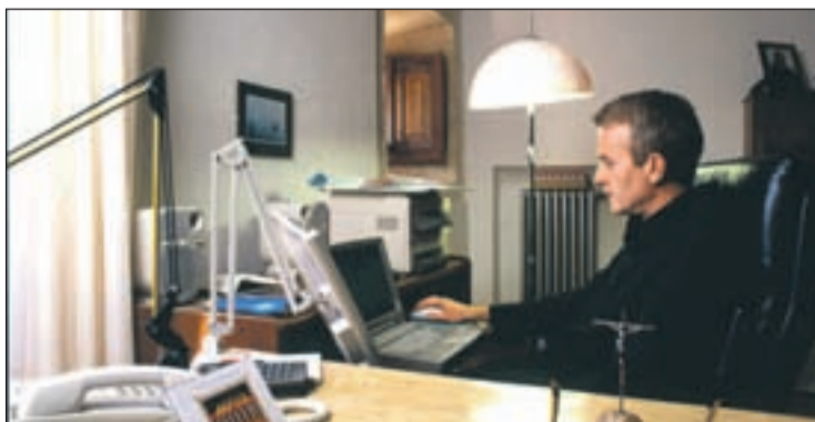
Monje en su celda

El claustro románico, impresionante, cada capitel cuenta una historia, nada está colocado por que sí, todo tiene sentido. En el centro del claustro la fuente con su murmullo, el ciprés repleto de pá-