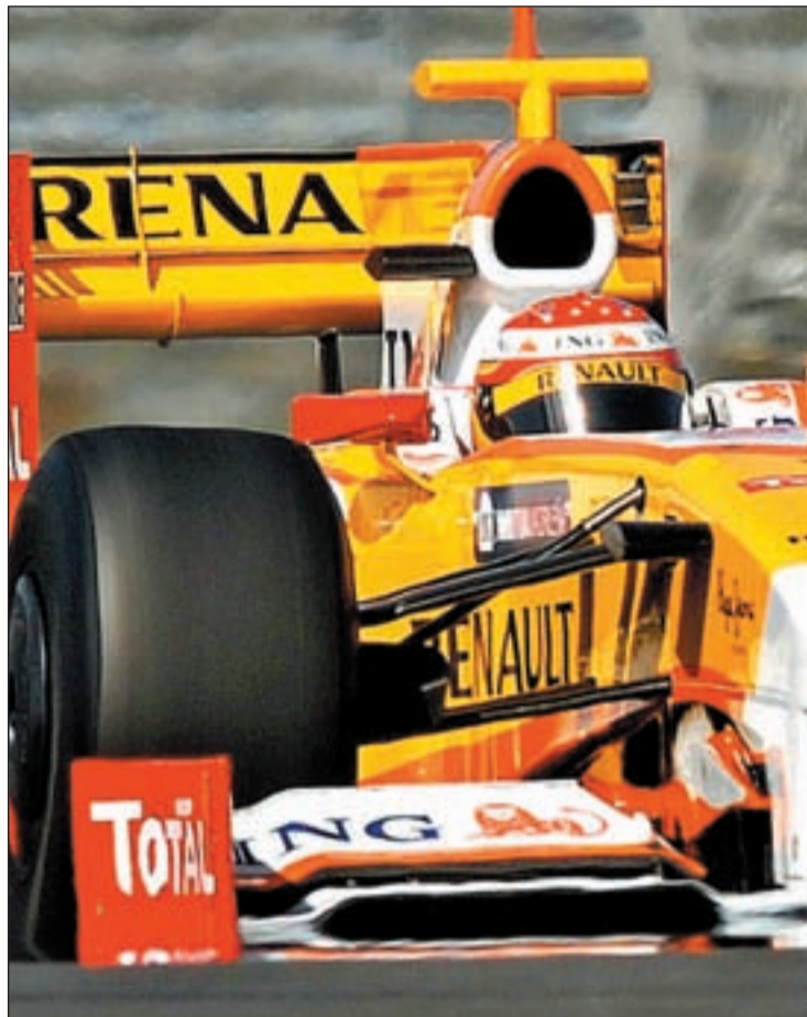
Fernando Alonso pretende conquistar su III Mundial

Otro capítulo aparte merece McLaren-Mercedes. La escudería