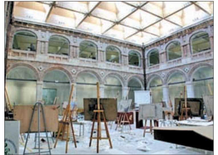
Patio interior de la Escuela de Arquitectura y Geodesia

La cafetería se ubicará en el patio del edificio y será un espacio independiente, a modo de pabellón desmontable. Las empresas patrocinadoras que colaboren podrán beneficiarse de publicidad gratuita. Además, se creará una página web y el proyecto será publicado en revistas especializadas.