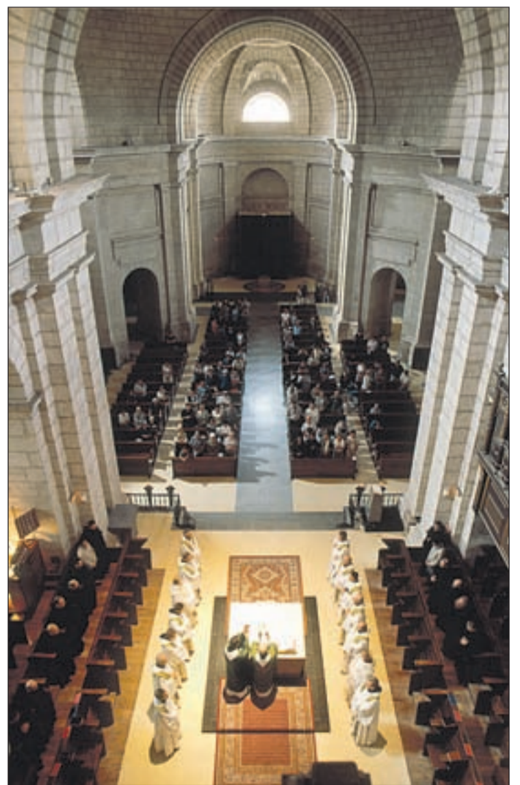
Celebración eucarística en la Basílica de la Abadía

Los monjes luchan contra el cansancio y la rutina, buscarse, amar a los demás antes que a ellos mismos.