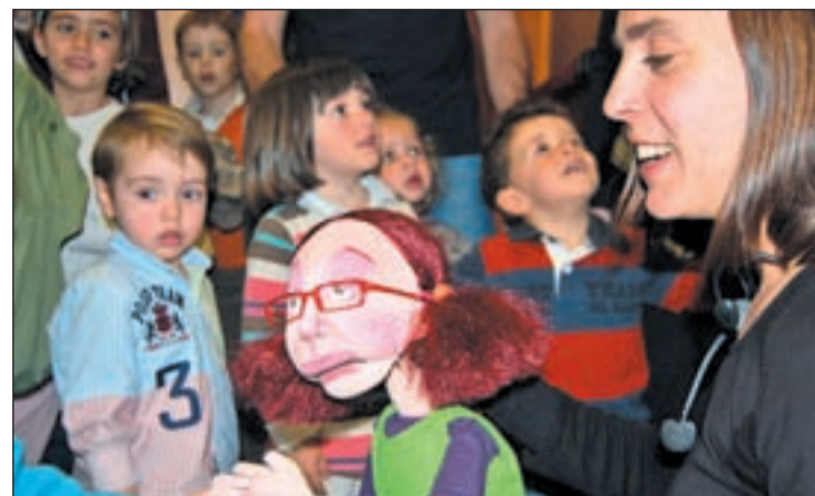
Títeres durante la representación