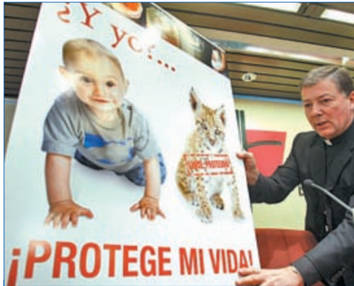
EL LINCE ABRE LA VEDA La presentación de la campaña de la Conferencia Episcopal, el pasado 16 de marzo, fue solo una de las muestras de la polémica que ha suscitado la propuesta sobre el aborto

En la calle no falta ni el debate ni la escenificación de posturas. La manifestación del Día de la Mujer, el pasado 8 de Marzo, fue una de las muestras. El ma-