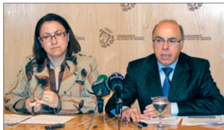
Los portavoces del Grupo Socialista durante su intervención