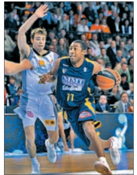
Estudiantes afronta una nueva final