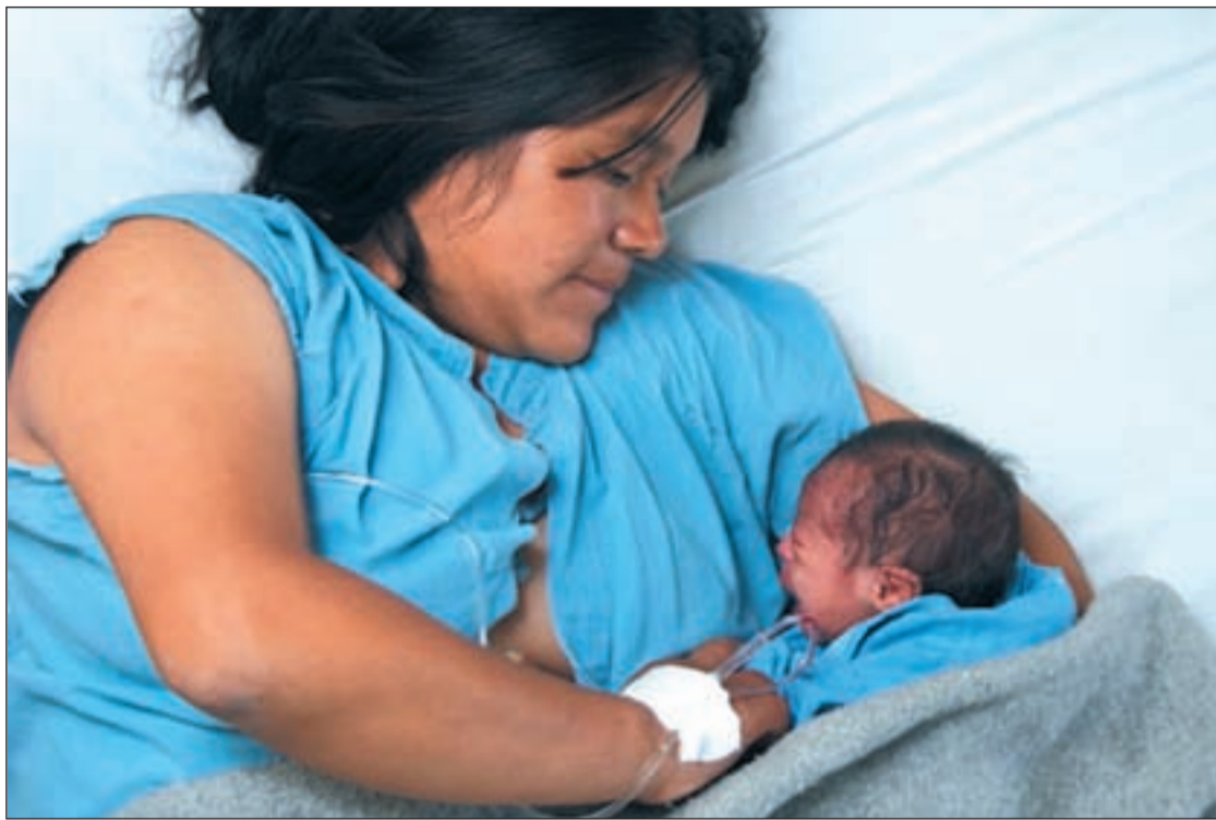
Todavía en el hospital, una madre con su hijo recién nacido