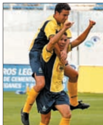
El Alcorcón escala SKAY/GENTE

pepinero en misión tan arriesgada. El Leganés continúa líder, mientras que el Castilla es quinto, sólo a dos puntos de ascenso, y el Alcorcón séptimo, a cuatro. Leganés-Fuerteventura, Atlético B-Castilla y Las Palmas Atlético-Alcorcón juegan el resto de partidos esta jornada.