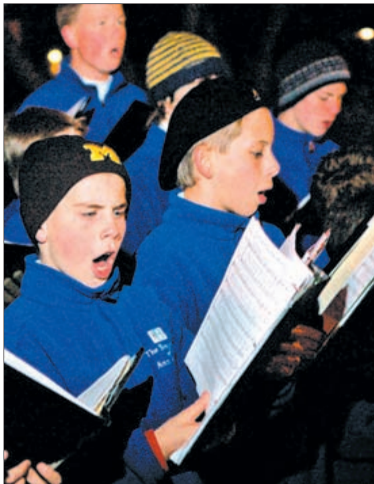
Coro de niños durante una actuación

Aunque no se trata de un concurso como 'Operación Triunfo', cualquier niño con dotes para cantar tiene ahora su oportunidad de demostrarlo.