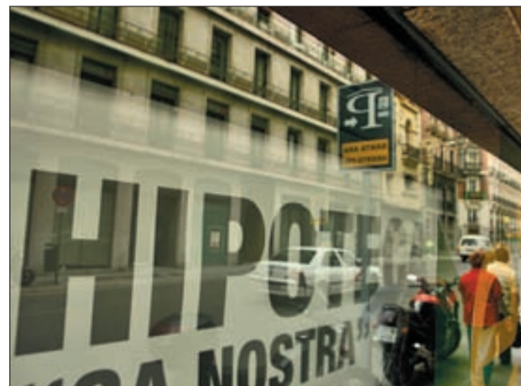
La crisis sigue dejando su impronta en la concesión de créditos

otecaria de España, que indica que continúa de esta forma su intensa desaceleración, ya que decrece en términos interanuales un 13,8%. Gregorio Mayayo, presidente de la AHE, estima que la demanda crediticia en 2009 será inferior a la del año anterior, dadas las condiciones generales en las que se va a desenvolver la economía