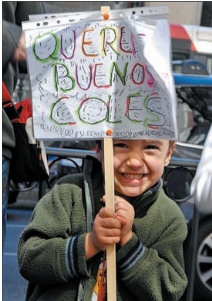
Concentración ante la Consejería el pasado miércoles

Más de 70 por ciento de los profesores de las Escuelas Infantiles y el 50 por ciento de los educadores de Primaria y Secundaria decidieron el miércoles no acudir a las aulas para defender la Educación Pública, según datos de los sindicatos. Bajo el lema "No a las privatizaciones, por la dignificación de los profesionales. Por un acuerdo educativo", CC OO, UGT, CSIF, STEM y CSIT convocaron una huelga del sector que se ha seguido en el 90 por ciento de los centros educativos de la Comunidad, aunque con diferente intensidad. Con el 70% de los centros públicos analizados, alrededor de las 13:00 horas, en el 20% de los centros de Primaria e Institutos de Educación Secundaria habían participado en la huelga más del 80% de