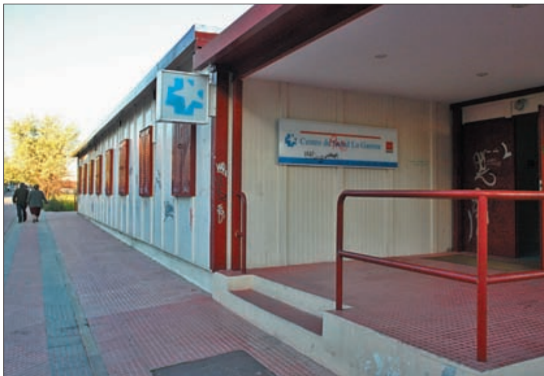
Vista exterior del prefabricado que hace las veces de Centro de Salud en La Garena

Afirman que el Ayuntamiento no atiende sus propuestas ni sus demandas