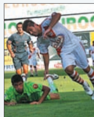
Rayo vs Eibar

por 3-2, el equipo vuelve a estar a sólo un punto de la zona de ascenso. La tranquilidad y la prudencia son los mejores aliados del club vallecano, puesto que no hay presión alguna. Este fin de semana, el equipo viajará al País Vasco para enfrentarse al Eibar, tercero por la cola en la clasificación general.