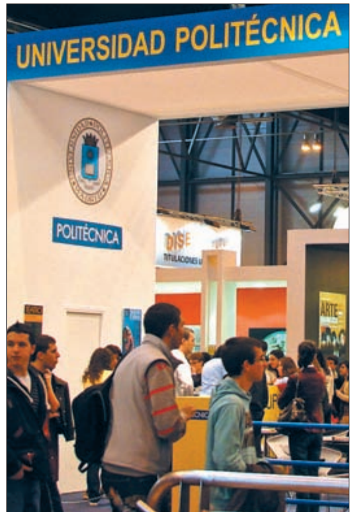
Stand de la Universidad Politécnica en Aula

Otro de los retos de la Escuela ha sido establecer un importante marco de relaciones con la sociedad.