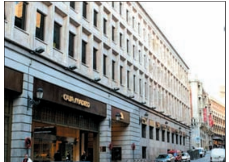
Sede central de Caja Madrid

LA COMUNIDAD TIENE UN MES PARA APROBARLOS