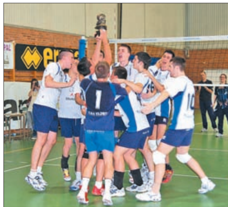
Los jugadores del Club Voleibol Alcalá celebran su triunfo