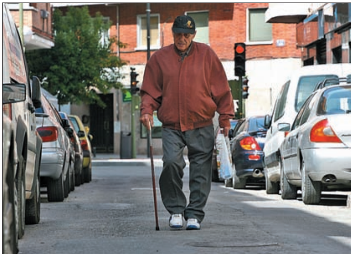
El desempleo frena al superávit de la Seguridad Social, que es positivo

PENSIONISTAS MADRILEÑOS, TERCEROS QUE MÁS COBRAN EN ESPAÑA