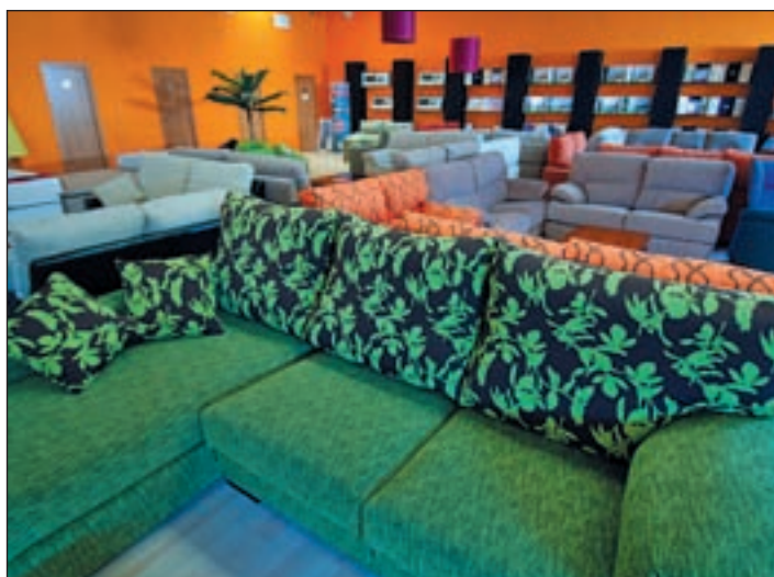
Las mejores calidades a los mejores precios

La inmensa planta de arriba está dedicada a todo lo relacionado con el descanso donde podemos encontrar