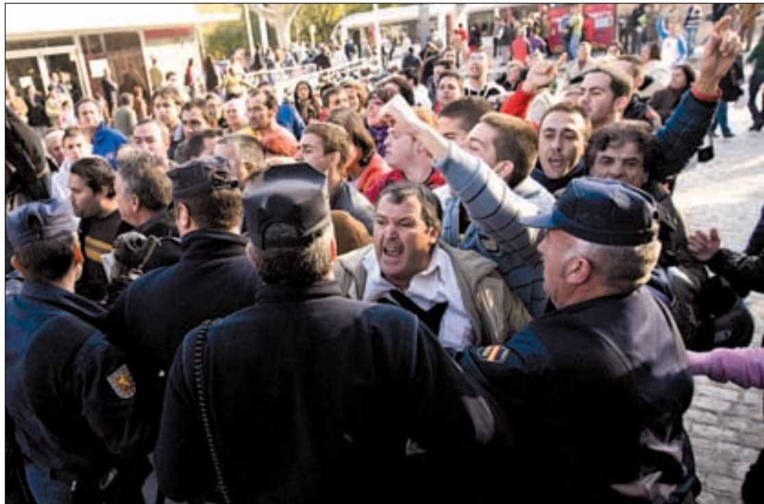
Algunas personas increpan a los detenidos en las puertas del juzgado