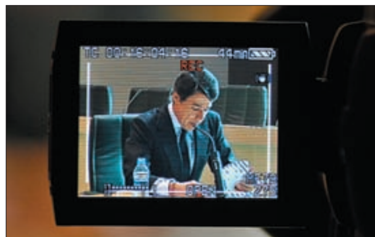
Ignacio González, vicepresidente de la Comunidad