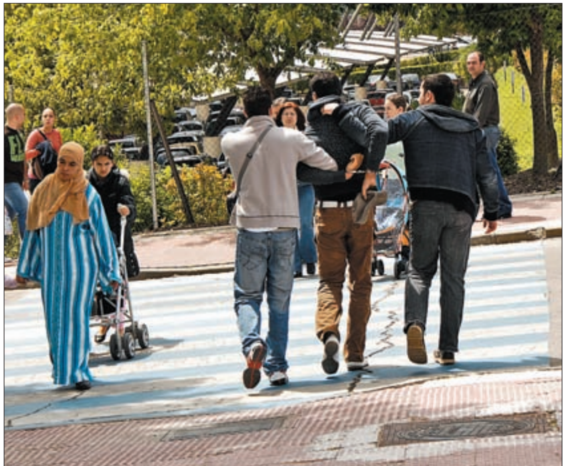
Dos policías secretos detienen a un inmigrante en Parla

UGT y CC OO. se han sumado a las condenas del resto aportando un matiz insoslaya-