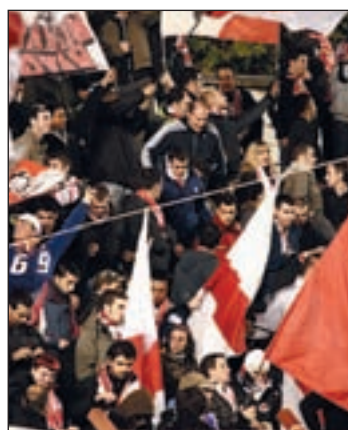
La afición disfruta con su equipo

rife, que está situado en la tercera plaza. Esta semana recibe al Sevilla Atlético, colista de la categoría. Los andaluces sólo han ganado un encuentro, y eso fue el pasado 4 de octubre. Una buena opción para que los aficionados disfruten de otra victoria rayista.