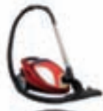
Aspirador sin Filtro

Domicilia tu nómina en NOVANCA y date un capricho.