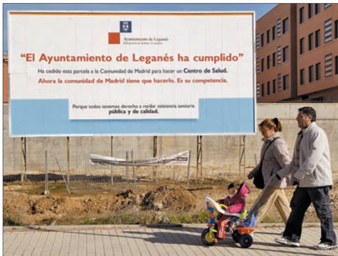
Un cartel en Arroyo Culebro refleja la guerra entre el Gobierno local y el regional

El Ayuntamiento destinó 35.610.210 millones a competencias que no le corresponden • Los alcaldes del Sur califican la situación de "sangrante"