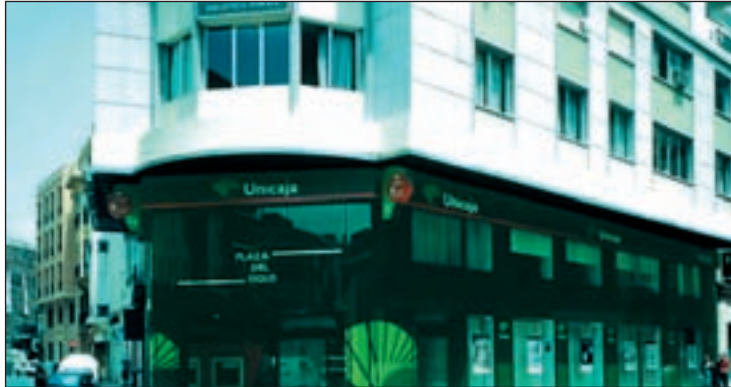
Fusionar Unicaja y CCM haría que fuera la quinta Caja español

Ahora le llega el turno a la CCM y Unicaja, que ha supuesto la dimisión de los nueve consejeros del PP, en la primera, mientras Chaves y Barrera la bendecían. Si hubiera un acuerdo, crearían la quinta mayor Caja española por volumen de depósitos (41.300 millones). Chaves tendría mayoría absoluta en esa asamblea con sede en Málaga. Mientras las cajas de Castilla y León (Caja Duero, Caja Bur-