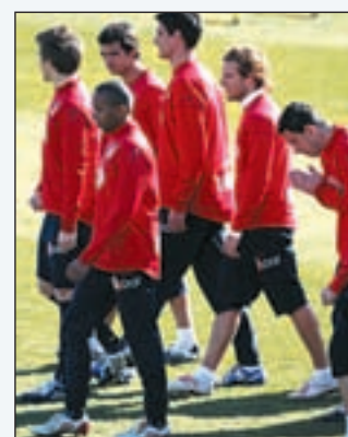
Preocupación en los atléticos

Juande Ramos deben doblegar al Real Betis en el Bernabéu. Los verdiblanco se están mostrando como un equipo muy irregular pero cuenta con jugadores de mucha clase como Sergio García o Ricardo Oliveira. El Madrid, además, tendrá reservar fuerzas para el partido contra el Liverpool.