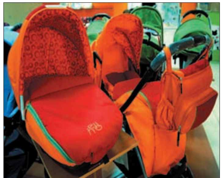
Carritos todoterreno a 199 euros

Hay que destacar la novedad de sus telas rústicas que permiten borrar con un simple paño los rayones de bolígrafo, los colchones de hilo de bambú que absorben la humedad del cuerpo para evitar el sudor o las fundas de colchón de hilo de plata que elimina todas las energías negativas.