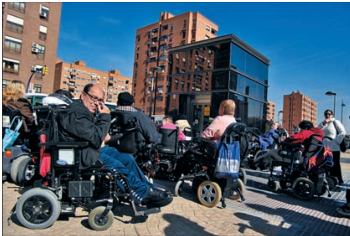
Protesta para pedir que pongan en marcha el ascensor de El Carrascal, el pasado lunes

Por otra parte, siguen en marcha varios talleres de empleo en los que se imparten distintas especialidades como carpintería metálica, instalación eléctrica, pintura, ebanistería, jardinería o viverismo.