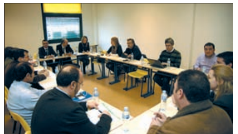
Reunión de concejales socialistas, el martes en Parla

concejales de Alcorcón, Aranjuez, Coslada, Collado-Villalba, Fuenlabrada, Getafe, Leganés, Pinto y Parla fueron la privatización del Canal de Isabel II, las Agendas XXI Comarcales y las Jornadas de contaminación atmosférica o las alegaciones al PORN de Guadarrama.