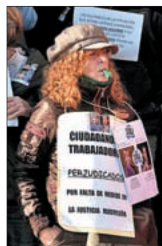
Una de las manifestantes

contempladas en el citado documento, entre las que se encuentran las de tipo salarial. A partir de ahora, según adelantan, alternarán quince días de huelga con una semana de trabajo como medida de presión. De esta manera, pretenden obligar a la Comunidad a poner en marcha medidas que frenen el deterioro por el que, a su juicio, atraviesan los tribunales de la región.