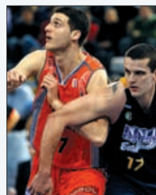
Imagen del Estu-Pamesa

gar contra el Caja sol, colisa de la clasificación con sólo cuatro triunfos. El Real Madrid llegará a la cita después de afrontar un nuevo compromiso de la Euro liga contra el Alba de Berlín. Por otra parte, la Federación de Baloncesto está apunto de cerrar la contratación de Sergio Scariolo para la selección.