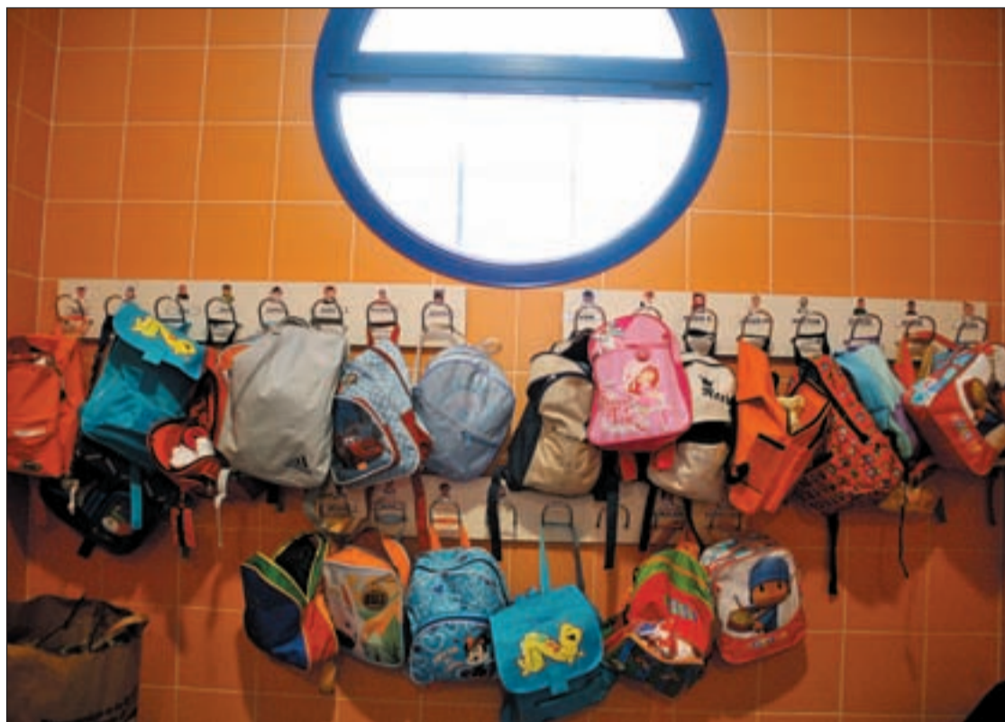
Mochilas en la escuela Mago de Oz ORKATZ ARRIAGA/GENTE

Según el alcalde, Alcorcón ha conseguido dar plaza pública a todos los niños de tres años de la ciudad. Ahora, el reto es cubrir la necesidad en el ciclo hasta 2 años, cosa que el Ejecutivo local pretende conseguir con las cuatro nuevas escuelas