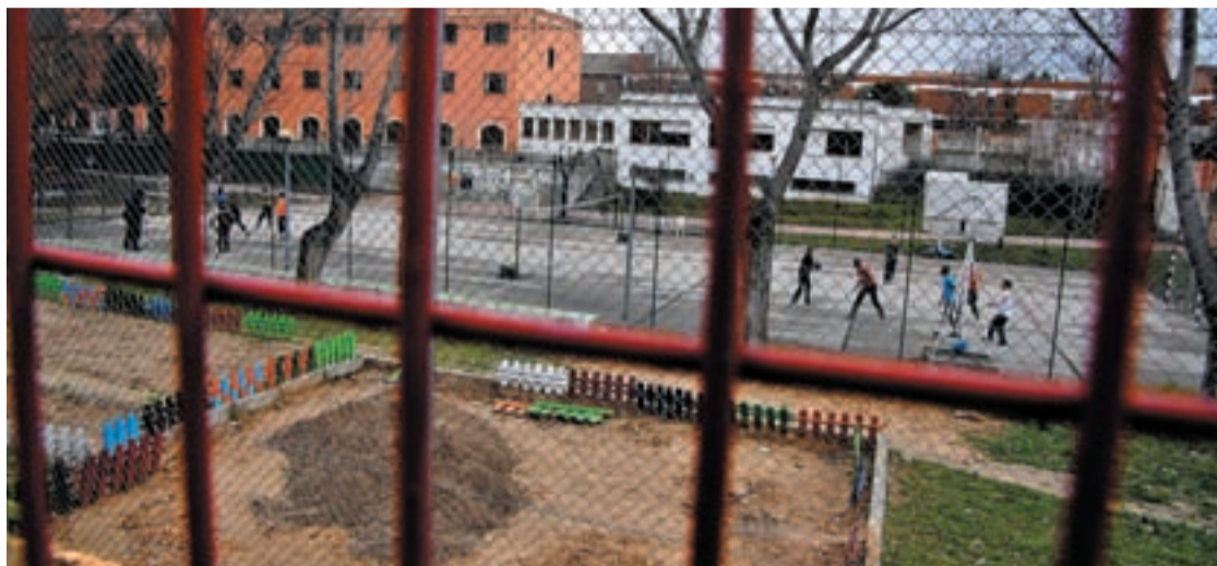
Un patio de un centro de menores de la Comunidad de Madrid

Un informe del Defensor del Pueblo ha hecho estallar la bomba de los malos tratos en los centros de menores. En Madrid, Enrique Múgica analiza seis centros de protección de menores con trastornos de conducta (CAPS) y mete el dedo en la llaga del suicidio de un interno de doce años en uno de ellos. La privatización y la cesión de competencias deja a los menores desamparados. Profesionales de la Educación alertan de la tendencia a sustituir pequeños centros por macrocárceles para niños.