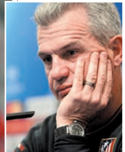
Aguirre se ha ido frustrado

Gil Marín y Enrique Cerezo esperan que los jugadores sean conscientes de la responsabilidad que tienen y se vuelquen con el nuevo entrenador. Están convencidos de que la plantilla no ha ofrecido su mejor rendimiento en las últimas jornadas. Quizás de forma involuntaria, pero no han ofrecido el máximo de sus posibilidades. Por ello, el presidente se mostró tan duro con la plantilla después de perder frente al Valladolid.