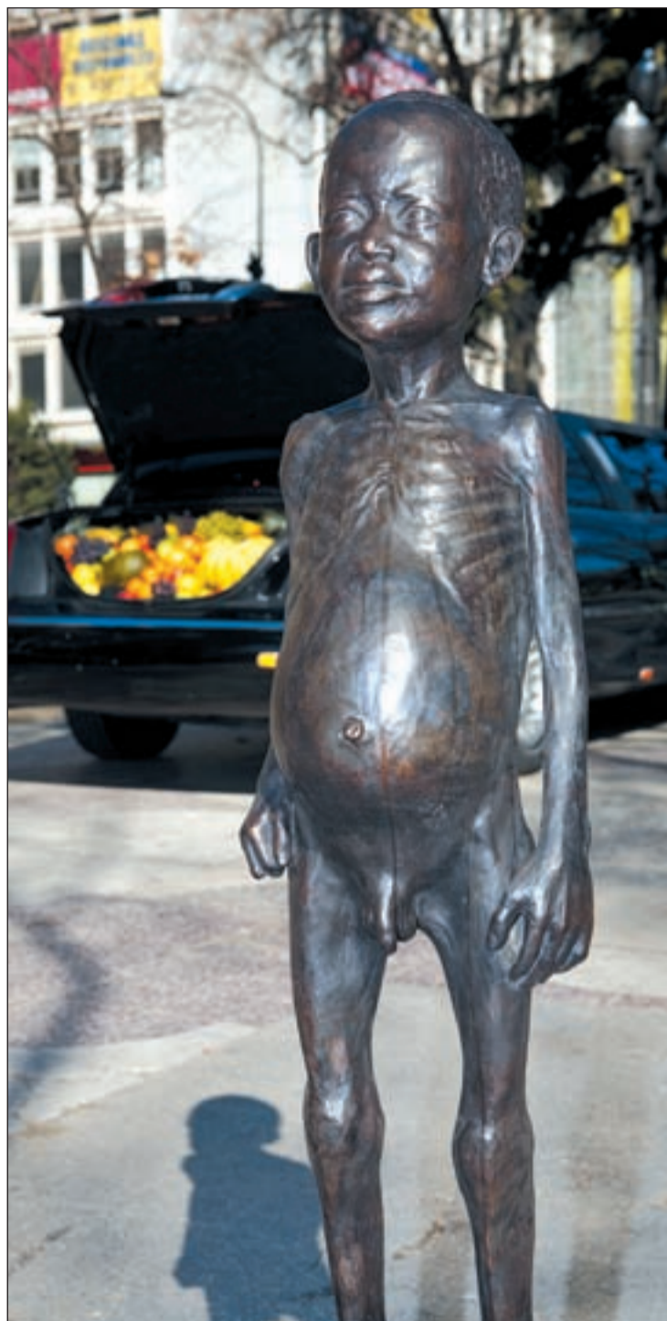
Esculturas que replantean nuestro estilo de vida desde Recoletos