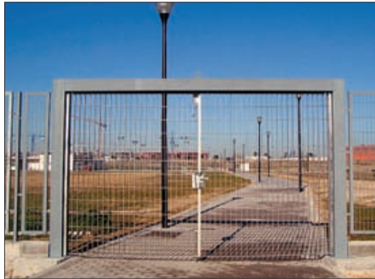
Fotografía del acceso, tomada en enero de 2008

Asociación de Vecinos Parque Oeste, las razones que esgrimía el Ayuntamiento para justificar el retraso de 16 meses eran que "se estaban edificando casas para los profesores y las obras afectaban a la seguridad". Sin embargo, estas obras estaban separadas por unas vallas, por lo que el camino quedaba al descubierto y era accesible para los peatones. Afirman, además, que el convenio, firmado con la Universidad para la construcción de este paso peatonal, data del año 2006.