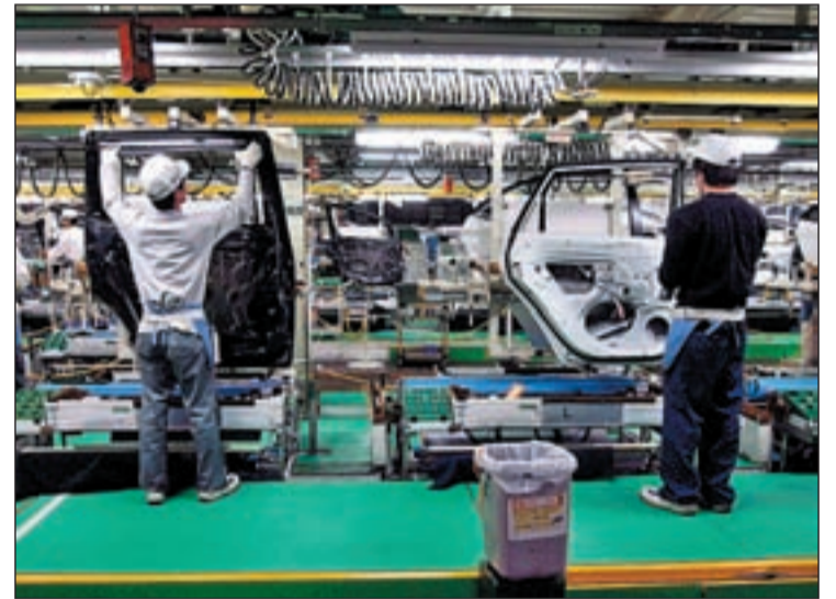
Cadena de montaje de una factoría de automóviles

Piden, igualmente, que puedan acceder al Fondo de Adquisición de los Activos Financieros que el Gobierno ha concedido a los bancos y a las cajas, conque incrementarían el veinte por ciento las ventas actuales de coches durante este año.