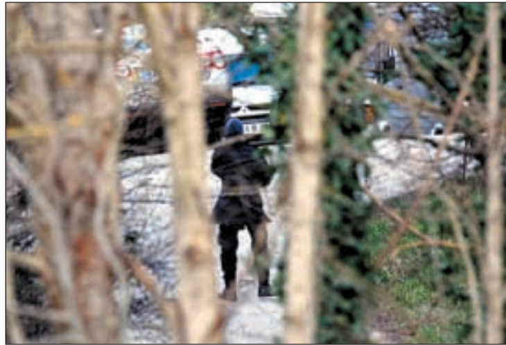
Alrededores del zulo hallado en la localidad guipuzcoana de Ordizia

Según el Departamento vasco de Interior, podría haber quedado al descubierto como consecuencia de las últimas lluvias caídas en la zona, lo que habría contribuido también a deteriorar el material. De hecho el explosivo ha sido destruido en el mismo lugar debido al mal estado en que se encontraba y al peligro que implicaba su traslado.