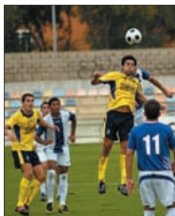
Llevan cuatro empates seguidos

murciano del Águilas. Un equipo que tiene por delante en la tabla con dos puntos más. De esta forma, un triunfo de los alcorconeros dejaría al equipo de Santo Domingo en una posición aún más placentera y se podrían olvidar definitivamente de la zona de descenso.