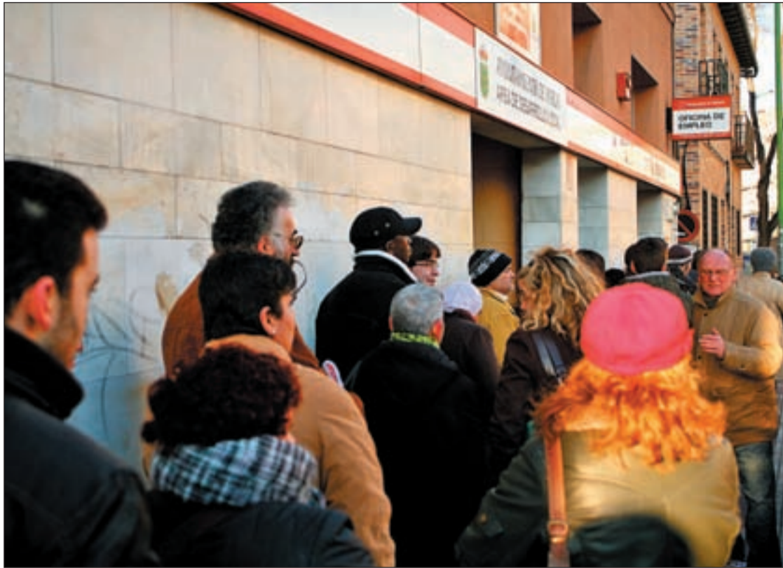
El Gobierno confía en reducir las colas del paro a partir de abril

ZAPATERO HABLA DE MEJORAS EN ABRIL Y PARA RAJOY ES UN DRAMA