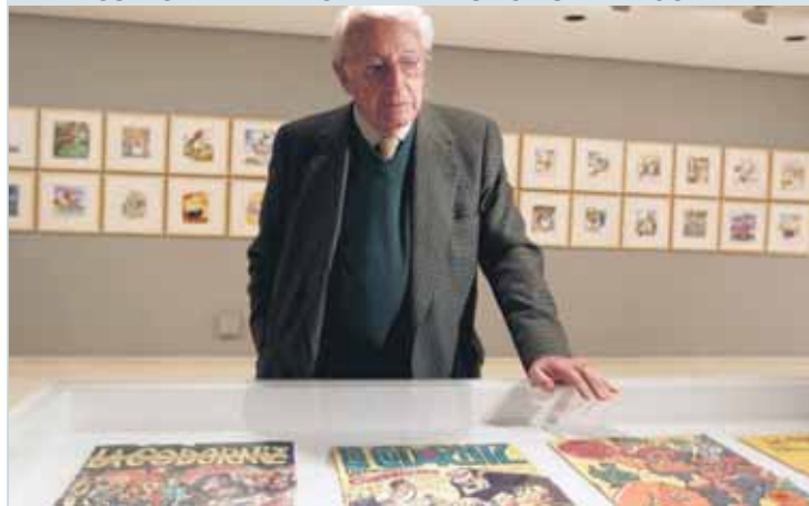
El humorista gráfico Antonio Mingote acudió a la exposición "Mingote. La vida cabe en un dibujo", del Instituto Valenciano de Arte Moderno con 18 pinturas y más de 90 dibujos, portadas de revistas e ilustraciones.