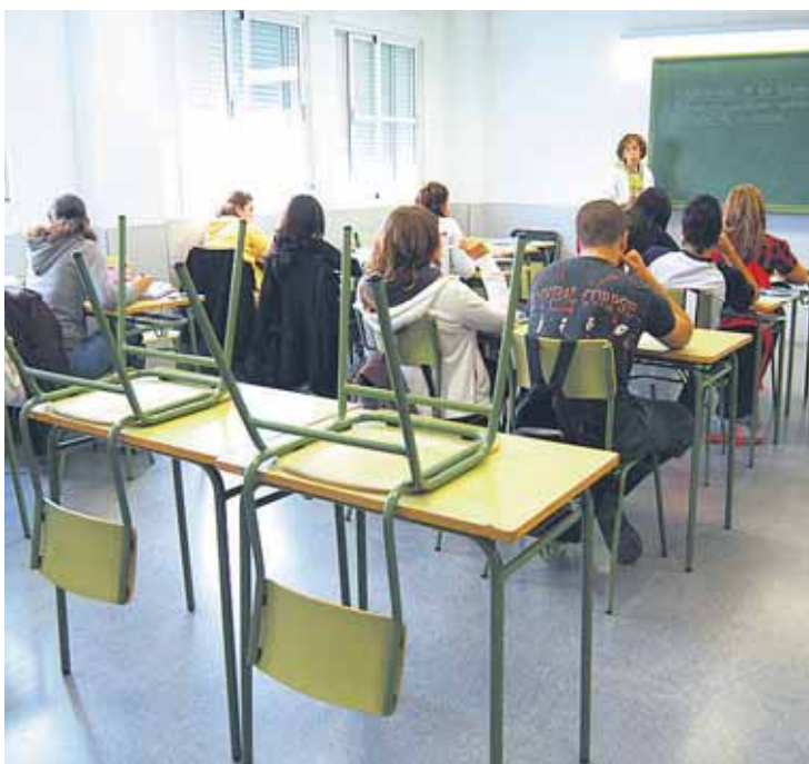
En Madrid, cerca de 15.000 niños no ha asistido a las clases de EpC.

Madrid, la comunidad con un mayor número de objeciones a la asignatura, "acata y respeta la decisión judicial", en palabras de su presidenta, Esperanza Aguirre. La actitud no es igual de complaciente a nivel nacional. El PP ha anunciado que "seguirá dando batalla". Una férrea postura que le llevará de nuevo a enfrentarse con el poder judicial al afirmar que respaldará a quienes acudan al Constitucional, según el diputado Alfonso Alonso.