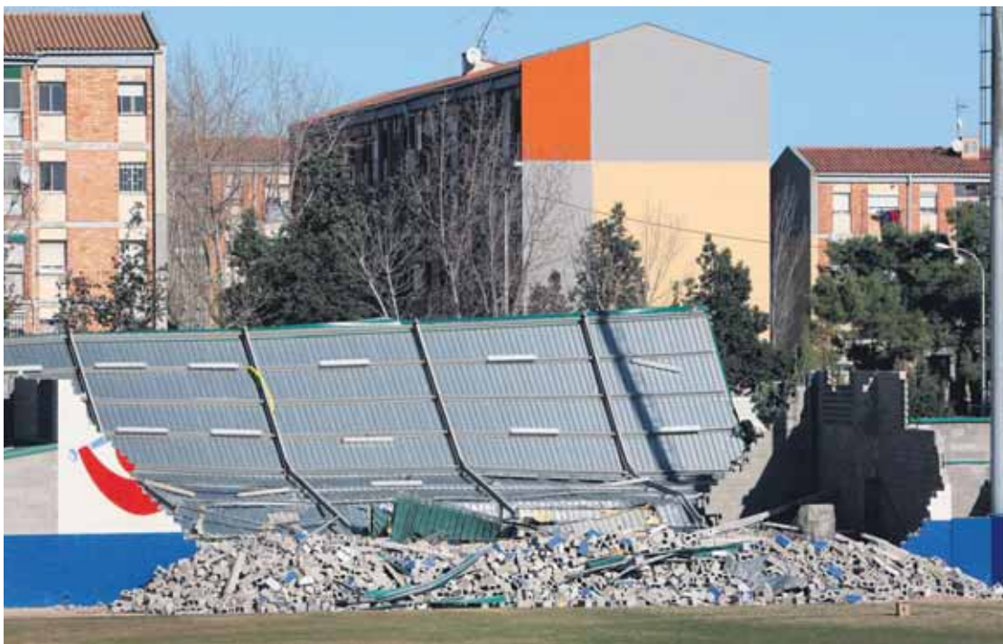
Así quedaron las instalaciones deportivas públicas de Sant Boi donde murieron cuatro menores.

La Conselleria de Gobernación ya recomendó ese mismo día a los Ayuntamientos que suspendieran las actividades programadas ante las condiciones meteorológicas. Gobernación plantea que lo que hoy en día es simplemente una