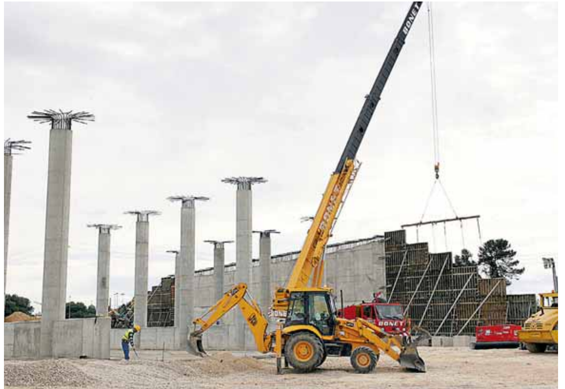
Las obras del AVE avanzan a muy buen ritmo en la entrada de Valencia.