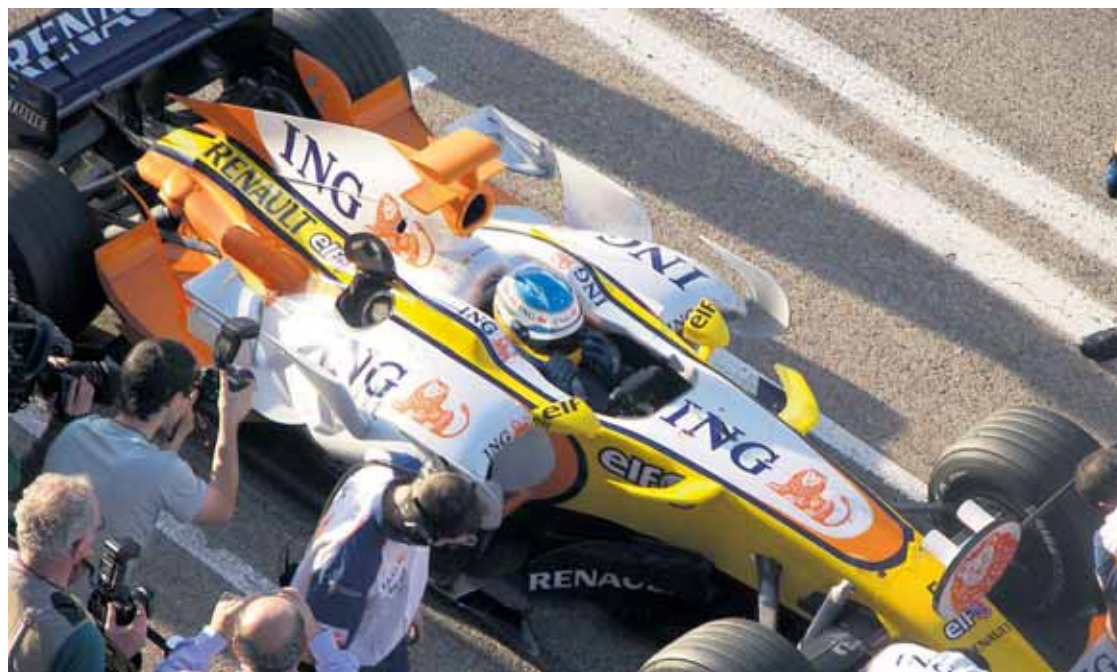
Los gestores del circuito urbano dan respuesta, así, a las peticiones de los aficionados.

Las localidades se pondrán a la venta el próximo 24 de febrero y se creará un nuevo abono sin derecho a silla mucho más económico y acorde a la 'crisis'