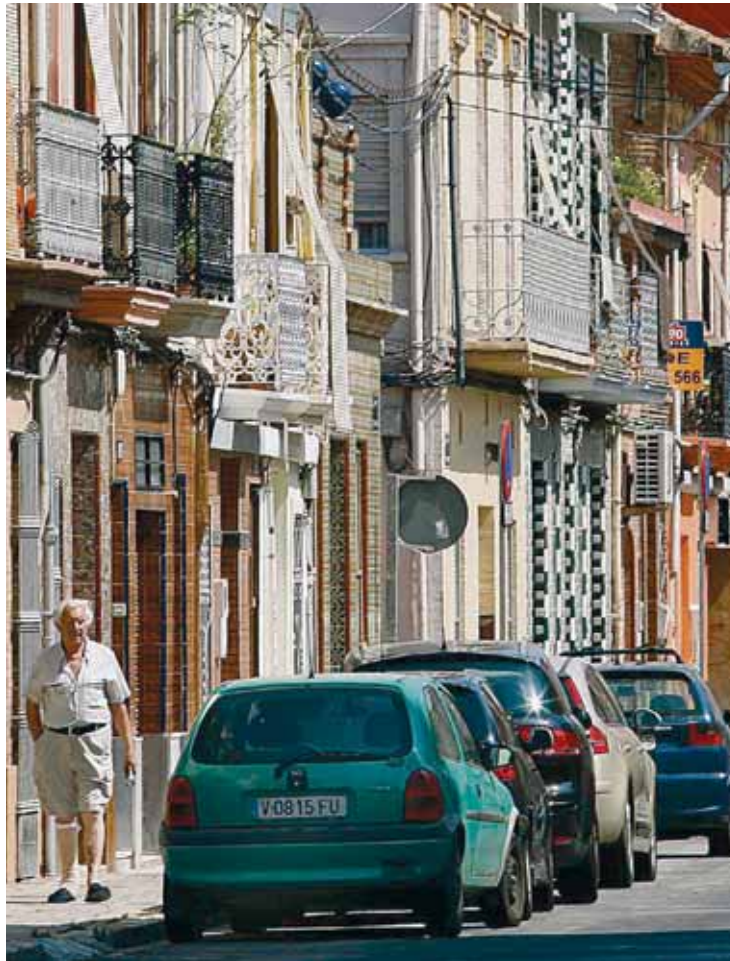
El barrio de El Cabanyal será la gran inversión de los Fondos.

Fondos Estatales de Inversión Respecto al Fondo Estatal de Inversión Local, el Ayuntamiento ha presentado ya 158 proyectos, de los cuales 146 han sido concedidos, otros 10 han sido validados por la Subdelegación del Gobierno, y queda pendiente uno, "además del que hemos aprobado por importe de 15.742 euros para la supresión de barreras arquitectónicas en Patraix". La alcaldesa ha añadido que con estos proyectos "hemos gastado ya los 141 millones" y ha agradecido el "excelente trabajo" realizado por concejales, asesores y funcionarios para que todo esté presentado en la víspera de la conclusión del plazo.