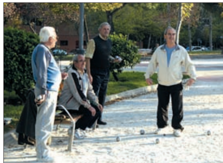
Sube la pensión de ocho millones de jubilados

Los préstamos tienen un periodo de carencia de cinco años y se podrán cobrar a partir del próximo mes de marzo.