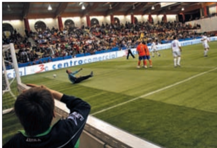
Tres Cantos ya ha disfrutado con el fútbol indoor

El primero cronológicamente será el más esperado de todos, la Supercopa de Fútbol Indoor entre los dos mejores equipos de la pasada Liga, el Real Madrid y el Deportivo de la Coruña. Se trata de dos equipos de veteranos de ambos clubes con futbolistas históricos como Alfonso, Buyo y Martín Vázquez en el Madrid o Fran, Romero y Djalmilha en el Deportivo. Hay que recordar que el fútbol indoor es una modalidad que juega sin que el balón salga del recinto, ya que es un terreno de juego cerrado en el que los jugadores pueden utilizar las paredes. El partido se celebrará en el Polideportivo