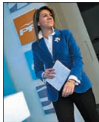
María Dolores de Cospedal

ción de los organismos públicos en las cajas de ahorros no supere el cincuenta por ciento. De Cospedal afirma que ésta es la postura de siempre del PP y la postura que mantendrá el partido y que es conocida por todos los presidentes y altos responsables del PP.