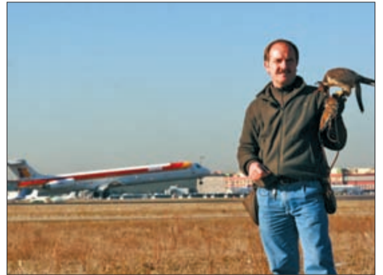
Uno de los halcones que 'limpia' de aves el aeropuerto

mente la visita de muchas aves que vienen de la sierra", según señala la propia entidad. De hecho, se han registrado bandadas de más de 30 buitres, que alcanzan una altura de vuelo de 3.000 metros, cuando los aviones que pasan por esta población lo hacen en pleno despeje a menos de 1.000 metros de altura. Esta advertencia se produce pocos días después de que un avión tuviera que aterrizar en el río Hudson, en Nueva York, después de impactar con un grupo de aves.