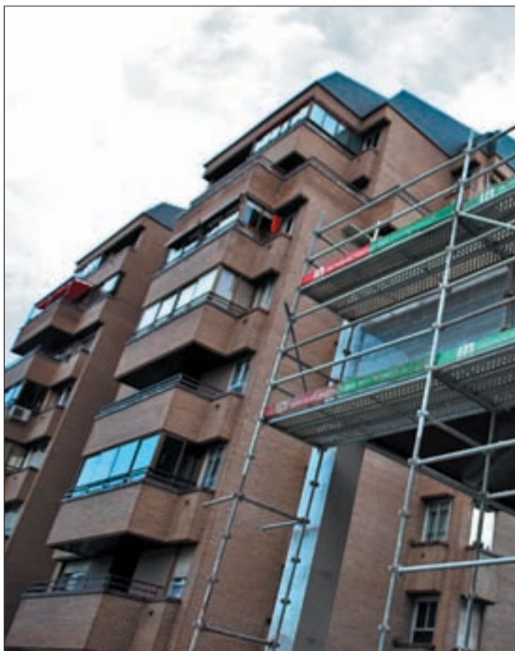
Un edificio tricantino en obras