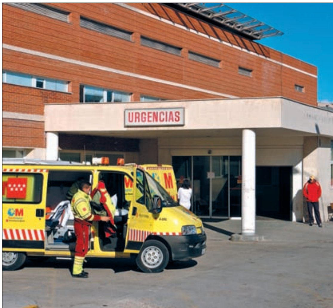
El Doce de Octubre es el hospital que más proyectos gestiona

En cuarto lugar se sitúa el hospital Clínico San Carlos con 54 proyectos, un 10,2% más que el pasado año. Del mismo modo, también el hospital de Getafe ha aumentado de forma considerable el número de proyectos de investigación con la apertura de los