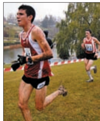
Carrera solidaria en Tres Cantos

La cuota de inscripción es de 11 euros, y la prueba comenzará a las 11:00 horas en el parque Central de Tres Cantos.