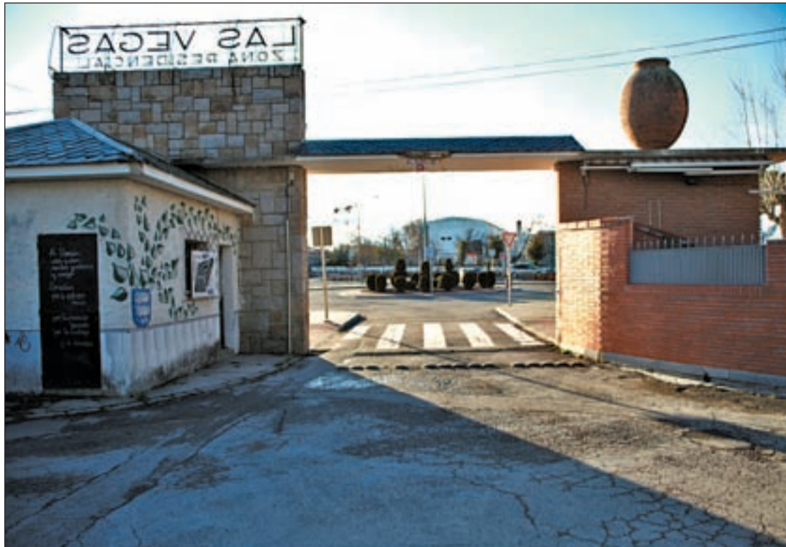
La Colonia de Las Vegas tiene un enorme deterioro en sus calles