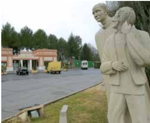
San Juan de Dios data del año 1929.

Conservas Elcano comienza su andadura en 1942 en la fabricación y Conservación de conservas y semiconservas de pescado. Cuenta con alrededor de 35 empleados. Y On Line, S.L. nace en 1992 con el objetivo de prestar servicios profesionales en el campo de la informática basada en infraestructura de red, tanto en administración pública como en empresa privada.