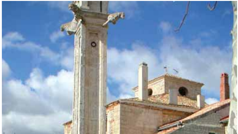
Imagen de Vertavillo, un municipio palentino que cuenta en la actualidad con 204 habitantes.

“El mirador es sin duda para mí el lugar más emblemático. La gente que viene de fuera lo valora mucho.”