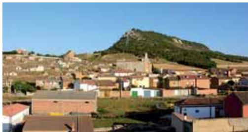
Imagen de la balconada de bodegas de Reinoso de Cerrato.

-Creo que después de todo lo dicho, sólo resta invitar a todos los palentinos y a aquellos que se acerquen estos días a nuestra provincia, a visitar Reinoso de Cerrato, que celebra sus fiestas del 15 al 18 de agosto en honor a Nuestra Señora de la Asunción.