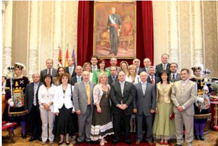
Imagen de los miembros de la nueva Diputación Provincial.