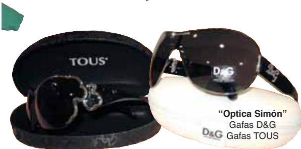
"Optica Simón" Gafas D&G Gafas TOUS