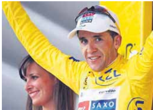
Carlos Sastre debutará en febrero con el Cervélo en el Tour de California.

Uno de ellos, Pablo Lastras, correrá en los próximos días su primera carrera del año, el Tour Down Under, que se disputa en Australia del 18 al 25 de enero. Más tarde les tocará el turno a Francisco Mancebo, Ángel Vallejo, Jesús Hernández, Joaquín Novoa, Miguel Ángel Candil y Rubén Calvo.