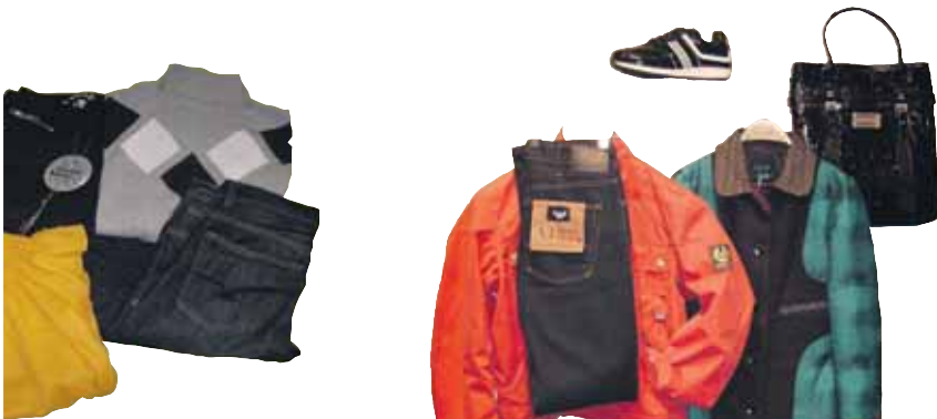
"Montepicaza" Moda y complementos hombre y mujer hasta 30% de descuento