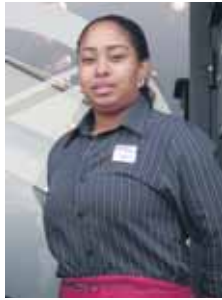
Foster's Hollywood para nuestros lectores.

- Sin duda, el entrecot teriyaki, así como el solomillo bourbon, platos nuevos y, por su puesto, nuestra especialidad: costillas y hamburguesas.