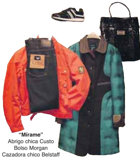
"Mírame" Abrigo chica Custo Bolso Morgan Cazadora chico Belstaff Pantalón chico Armani Deportiva Bikkembergs