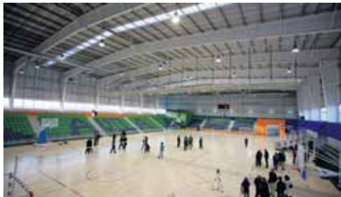
Interior del nuevo pabellón multiusos, en la carretera de Sonsoles.

La inauguración del pabellón multiusos 'Carlos Sastre' tendrá lugar el viernes 30 de enero, según anunció el alcalde de Ávila, Miguel Ángel García Nieto, en una visita a las instalaciones, en la que estuvo acompañado por jugadores del Óbila. Al acto oficial acudirán el ciclista abulense y previsiblemente el consejero de Presidencia, José Antonio de Santiago-Juárez. La infraestructura cuenta con un graderío de 1.380 plazas y una pista central de 1.785 metros cuadrados.