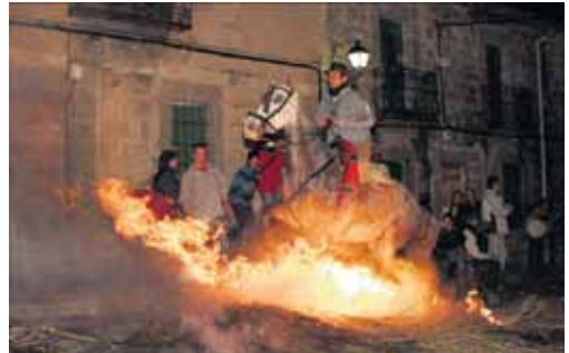
Espectacular imagen de la fiesta de Las Luminarias de San Bartolomé.

Otras localidades también estarán de fiesta el fin de semana. En