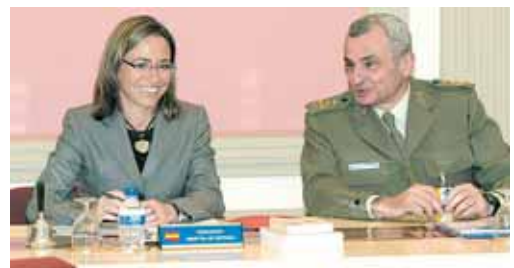
Carme Chacón y Fulgencio Coll, jefe del Estado Mayor de Tierra.

do. Por otro lado, el juez ha solicitado al CNI todos los informes relativos a este caso, y al Congreso las comparencias del entonces ministro de Defensa, José Bono. No declararán sin embargo, los militares del segundo helicóptero que ya testificaron.