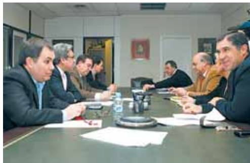
Reunión de los representantes de las asociaciones judiciales.

Mariano Fernández Bermejo, ministro de Justicia, abrió la