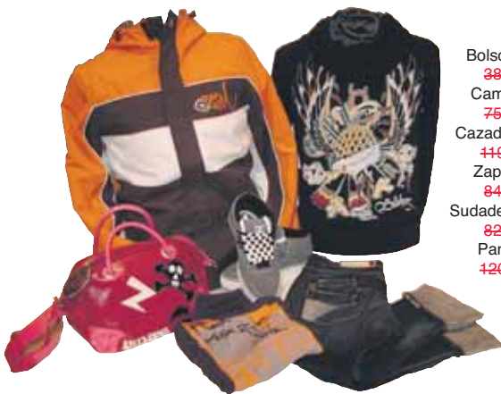
"Otway" Bolso chica Billabong 38,00€ / 29,00€ Camiseta Gas chica 75,50€ / 21,00€ Cazadora chico Rip Curl 119,00€ / 71,00€ Zapatilla D.C Chico 84,00€ / 67,00€ Sudadera Chico Billabong 82,00€ / 49,00€ Pantaló chica Gas 120,45€ / 45,00€