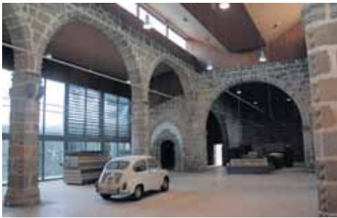
La Iglesia Vieja de Cebreros se convierte en un nuevo museo.