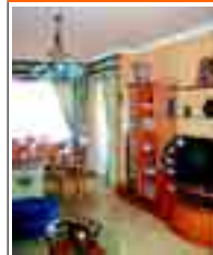
2008 BARRIO LA SAL piso de 3 habs., salón de 24m 2 , coc. equipada. Dos baños. Garaje y trastero. ¡Mejor que nuevo!