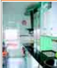
2100 VILLAOBISPO dúplex de 3 habs. una en planta baja, coc. amueblada, salón, dos baños. Mejor que nuevo.