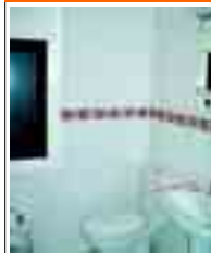
2143 P° SAN MAMÉS 70m 2 , tres dormitorios, salón, coc., baño reformado. Interesante.