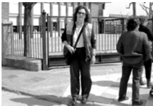
Las Aminci trabajan a pie de calle entre 10 y 20 horas semanales.