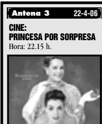
Anne Hathaway y Julie Andrews protagonizan esta divertida comedia de Walt Disney.