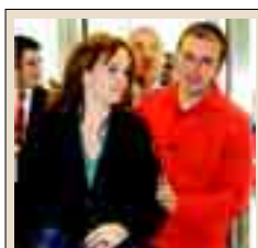
El Musac estrena biblioteca y centro de documentación