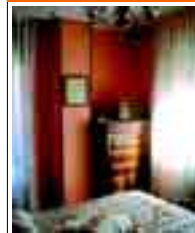
2152 LA VEGA piso seminuevo de 3 habs., coc. equipada, baño. Garaje y trastero. Muy soleado.