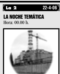
El programa dedica esta edición a Chernobyl, cuando se cumplen veinte años del accidente nuclear.