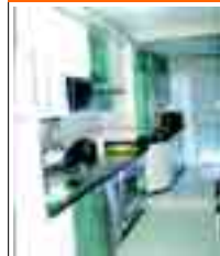
2149 FDEZ LADREDA dúplex, última planta 115m 2 , tres dormitorios con arm. emp., coc. equipada. Impresionantes vistas.