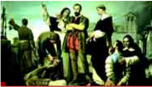
'Los comuneros, Padilla, Bravo y Maldonado en el patibulo', de Antonio Gisbert