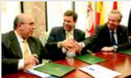
Momento del acuerdo de los responsables de las tres comunidades.