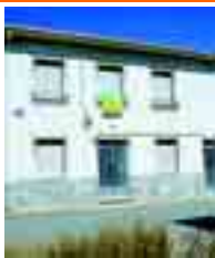
1852 VILLARRABINES casa de 2 plantas, 5 habs. Con patio de 450m 2 . Pozo propio. Reformada.