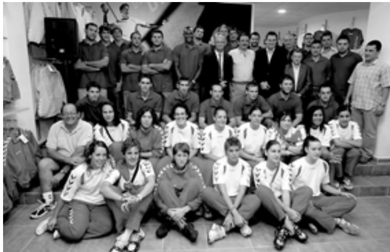
Los jugadores del Ademar acudieron a la inauguración de la tienda que Hummel abrió en León en La Condesa, 40.