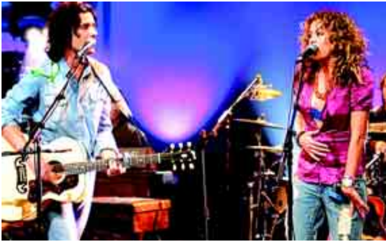
El cantante del momento, Coti (izda), actúa a las 12 de la noche en la Plaza Mayor, aunque no le acompañe Paulina Rubio.