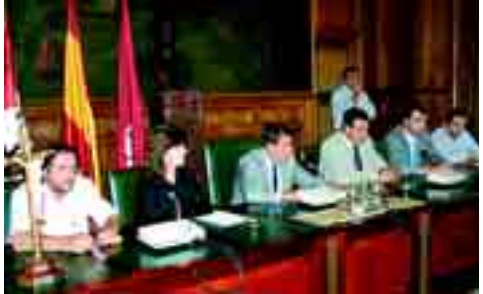
Momento de la firma del convenio entre la Diputación y Tierras de León.