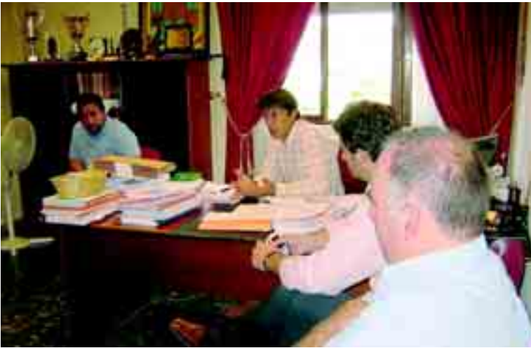
El alcalde Miguel Hidalgo mantuvo una reunión el pasado 30 de agosto con los vecinos afectados del sector SAU-5.