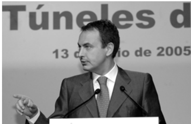
Rodríguez Zapatero en la anterior visita cursada a León, concretamente el 13 de julio a las obras de los túneles del TAV.

En el acto político que comenzará hacia las 12 de la mañana participarán, además de Méndez, Guerra y el propio Zapatero (los tres asiduos a la