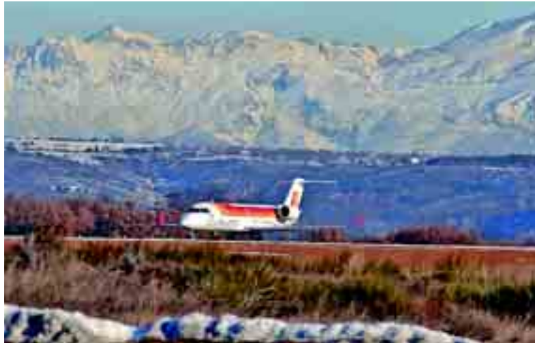
El reactor canadiense CRJ-200, con capacidad para 200 pasajeros, cubre el vuelo León-París en 1 hora y 45 minutos.

El aeropuerto de León comenzó a funcionar en junio de 1999 y fue Air Nostrum la que inauguró su primer vuelo, en este caso a Barcelona. El vuelo del sábado 20 arrancó con "unas expectativas excelentes" y cuenta ya con el 40% de ocupación para los próximos dos meses de