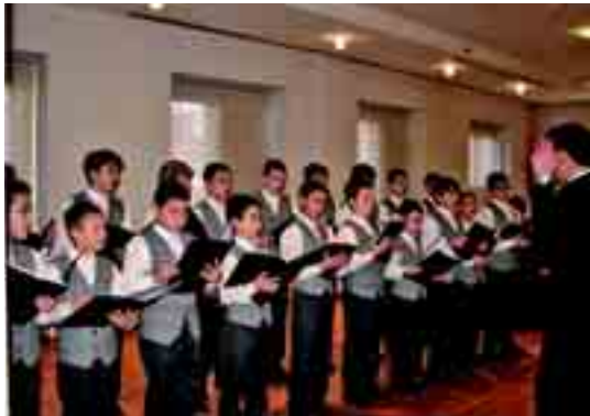
El coro de niños 'Ciudad de León' en uno de sus múltiples ensayos.

GPS Música representa en exclusiva a agrupaciones musicales españolas y extranjeras que cada año presentan nuevos programas bajo el criterio de la calidad y la novedad, proponiendo un viaje de redescubrimiento de antiguas y nuevas músicas. Igualmente promueve y coproduce espectáculos musicales especiales nacionales e internacionales en gira por España