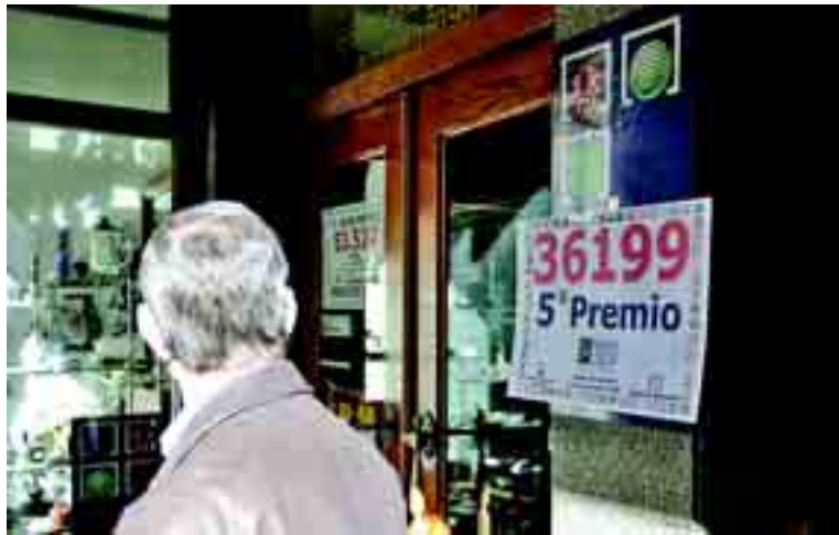
Cada 22 de diciembre se fotografian las administraciones de lotería que ha repartido premios, como la 1 de Astorga.

Y esperanzas sí que se habían depositado en este Sorteo, la prueba es que había sido la inversión en la suerte muy superior a la del año anterior, y eso a pesar de la crisis. Otro dato que apuntaba al optimismo era que el 'Gordo' había tocado con toda su ale-