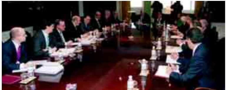
Los presidentes de las seis Cajas de Ahorros de la región durante la última reunión mantenida.