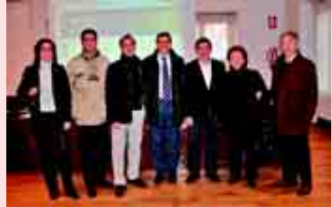
Las tres generaciones de Calzados López posaron con el alcalde y la edil.