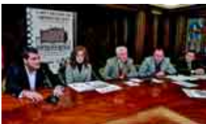
El I Open Mundial de Ajedrez, la gran novedad.