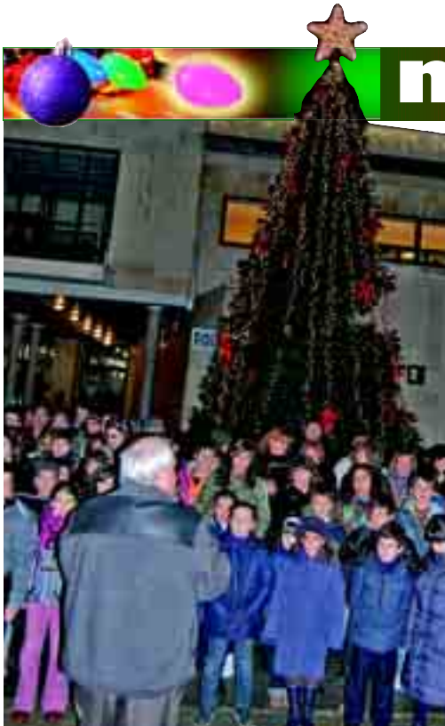
Un gran árbol preside la plaza del Ayuntamiento de San Andrés.