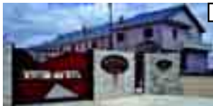
MIRADOR DEL AERO

Pisos y apartamentos desde 99.900 euros. ALQUILER DE LOCALES COMERCIALES