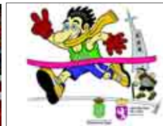
Las 'sansilvestres', reinas del deporte 'navideño'.

El recorte en las ayudas municipales ha condicionado los proyectos de algunos de los equipos 'de élite'