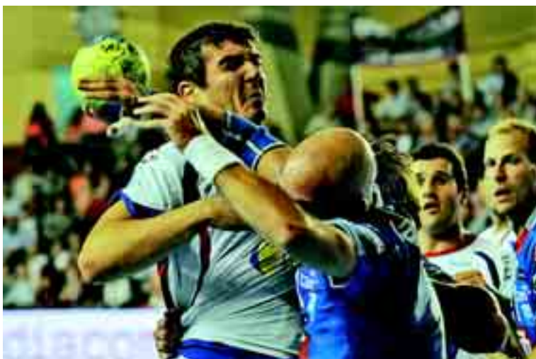
El Reale Ademar disputa antes de irse de vacaciones la XIX Copa Sabadell/Atlántico Asobal.

Capítulo aparte merece el Club Ritmo, que un año más (y ya van muchos) ha vuelto a demostrar su 'poderío' en el mundo de la gimnasia rítmica española.