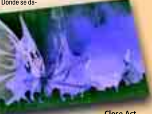
Close Act "White Wings" (Holanda).