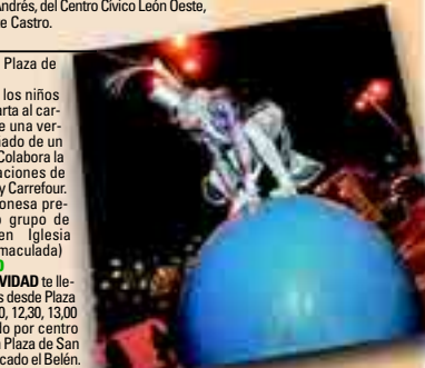
Circo Blanco. Pasacalles.