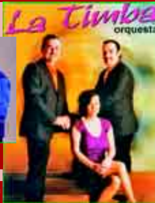
La Timba Orquesta

5 de enero • 22:00h. Cena y Baile Noche de Reyes