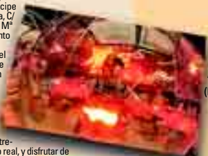
La Cité des Augustes "Astrobulles" (Francia).