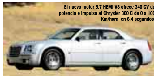
El nuevo motor 5.7 HEMI V8 ofrece 340 CV de potencia e impulsa al Chrysler 300 C de 0 a 100 Km/hora en 6,4 segundos.

Programa de estabilidad electrónica para control de las ruedas en casos de virajes de emergencia (ESP). Control de tracción para evitar el derrape de llantas al acelerar en superficies resbalosas (TCS). El Chrysler 300C también estará disponible con los motores 3,5 V6 y 2,7 V6, ambos con cambio automático de 4 velocidades, mientras que en el V8 la caja será de 5 velocidades.