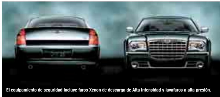
El equipamiento de seguridad incluye faros Xenon de descarga de Alta Intensidad y lavafaros a alta presión.

Su expresivo, innovador y exclusivo exterior muestra la nueva orientación del diseño Chrysler. Plataforma completamente nueva que incorpora un contemporáneo motor HEMI y tracción trasera