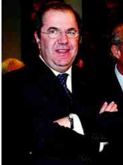
Juan Vicente Herrera presidió el Consejo de Gobierno de la Junta.

También se aprobaron subvenciones a empresas agroalimentarias. 'Aguas Minerales Pascual' recibirá una subvención de 2.833.229 euros para ampliar las instalaciones de la planta de envasado de agua mineral natural que tiene en la localidad de Folgoso de la Ribera. La empresa invertirá 13.135.048 euros y pasará de 2 a 24 trabajadores.