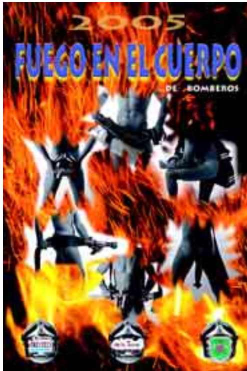
La portada del calendario anuncia el 'ardor' que guarda en su interior.

El dinero que se recaude ayudará, igualmente, a consolidar la exposición 'Un siglo alerta' que el Cuerpo quiere instalar en el Consistorio de San Marcelo, del 23 al 26 de este mes, para mostrar los fuegos más importantes ocurridos en León en los últimos cien años.