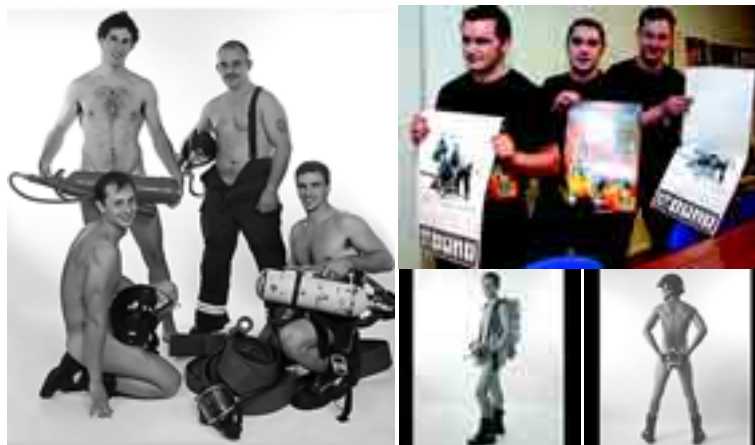
La foto de la izqda. corresponde a los meses de julio, agosto y septiembre en el calendario del Cuerpo de Bomberos.