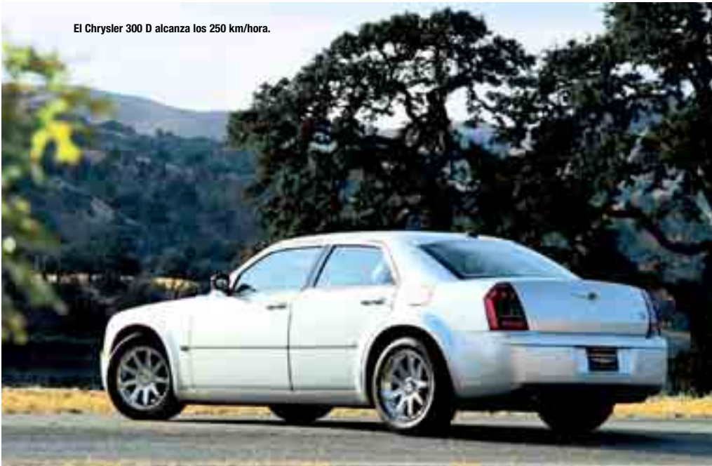
El Chrysler 300 D alcanza los 250 km/hora.

sistema el Chrysler 300C logra conjugar excepcionales niveles de prestaciones, potencia y economía de consumo. El sistema MDS del motor HEMI V8 ofrece una reducción del consumo cifrada entre el 10 y el 20%. Para transferir toda esta potencia, Chrysler ha concebido una plataforma con tracción trasera totalmente nueva. Con los tremendos avances en la tecnología de los neumáticos y el control electrónico de estabilidad, la tracción trasera proporciona mejor manejo; de este modo Chrysler recupera el tradicional concepto de sedan con tracción trasera. Además del beneficio de la tracción trasera, los ingenieros de la firma aplicaron todo su ingenio para darle al sedán 300C dos ruedas traseras para el impulso, dos delanteras para la dirección del vehículo y las cuatro en conjunto para maniobrabilidad en curvas, frenado y la estabilidad, con sus respectivos sistemas para cada función. La distribu-