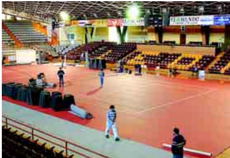
El Palacio de los Deportes de León ya está preparado para el acontecimiento tenístico del fin de semana.

La gran final de este Máster, para el que se han destinado 100.000 euros en premios, se dis-