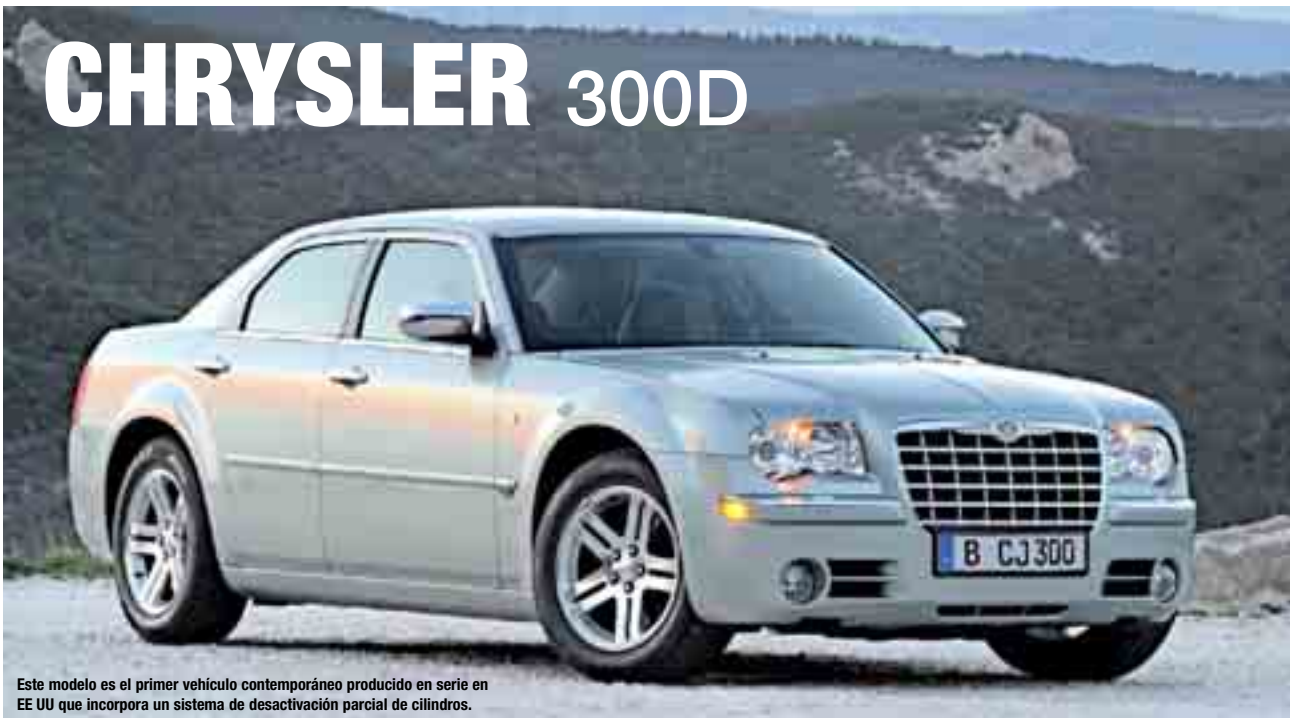
Este modelo es el primer vehículo contemporáneo producido en serie en EE UU que incorpora un sistema de desactivación parcial de cilindros.