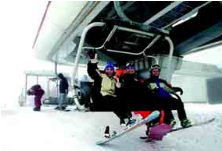
Los remotes de San Isidro comenzaron a moverse este puente festivo; ahora la nieve debe aguantar hasta Navidad.

El último día del puente fueron 9,3 los kilómetros esquiables en San Isidro con los siguientes remotes: dos sillas de Cebolledo (una cuatriplaza), una silla en Riopinos, un telesilla en Requejines y el telesilla de debutantes. A Guereñu sólo le preocupan las previsiones: "Para este fin de se-