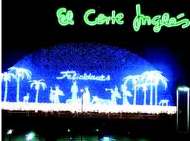
Una de las fachadas de El Corte Inglés luce esta espectacular estampa navideña.

El Corte Inglés es algo más que su firma estrella y León ha ido conociéndolo poco a poco. Viajes El Corte Inglés (Gran Vía de San Marcos y también en Ponferrada), Supercor Express (en la gasolinera de Eras de Renueva diseñada por el prestigioso ar-