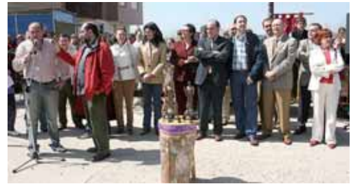
Imagen de la entrega de premios del pasado año.

dado a la pedrea del pan y el queso como Fiesta de Interés Turístico Regional, mientras que en 2005 recibió también el Cristo de la Tristeza.