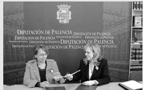
Un momento de la firma del convenio de colaboración.

La Diputación Provincial colaborará por segundo año consecutivo con la Confederación de personas con Discapacidad Física y Orgánica de Castilla y León (Cocemfe) para promover la mejora de la vida de las personas con discapacidad en la provincia palentina y en la región, ya que la Cocemfe está presente, además, en Burgos, Soria y la Comarca del Bierzo. El convenio, de tres mil sesenta euros, servirá para el sostenimiento y los gastos de mantenimiento de su sede, situada en la plaza de San Pablo de la ciudad. Así como, para desarrollar distintas iniciativas que contribuyan a ayudar a las personas con discapacidad, como son los itinerarios personalizados en la provincia o los programas de empleo.