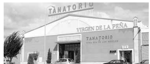
Imagen de la Funeraria-Tanatorio Virgen de la Peña.