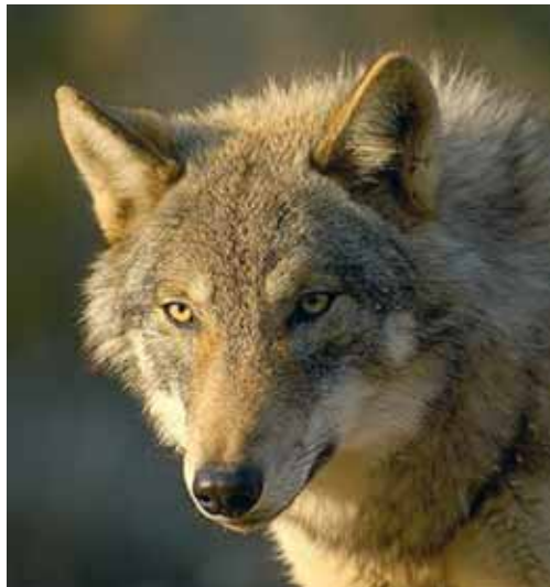
El Plan velará por la convivencia de esta especie en el medio rural.

Dentro de este Plan se proponen además cinco líneas de actuación, como la compatibilización con la ganadería, el control de la mortalidad no natural de la especie, el aprovechamiento de la especie, la investigación y seguimiento y la información, educación y sensibilización a través de campañas de divulgación.