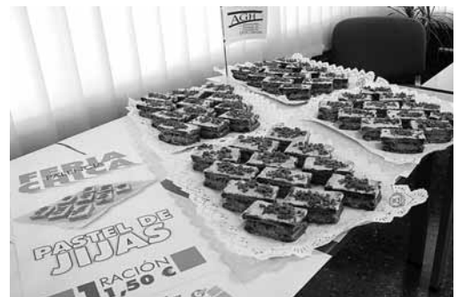
Imagen del pastel de jijas que se ofrecerá en la Feria Chica.

Por otro lado, será en la Feria Chica cuando los palentinos podrán disfrutar de la música de Hombres G en un concierto que se desarrollará el próximo 10 de