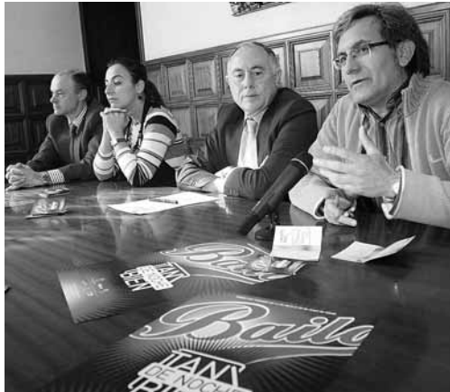
Momento de la presentación del programa 'Tan bien de noche'.

Tan bien de noche va dirigido a los jóvenes de la ciudad de más de 16 años y se desarrollará entre las 22 horas y las 2 de la madrugada de los viernes. Las inscripciones son obligatorias solo para los