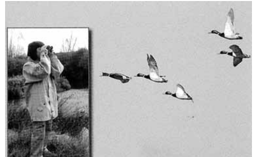
La provincia palentina ofrecerá tres rutas.

En la provincia, Adri Cerrato Palentino y Araduey Campos trabajan en la promoción de un uso sostenible de la avifauna.