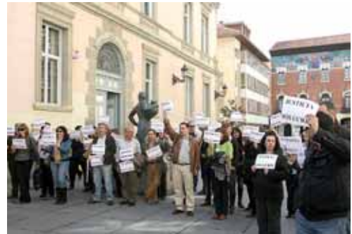
Un grupo de funcionarios palentinos en un día de huelga.