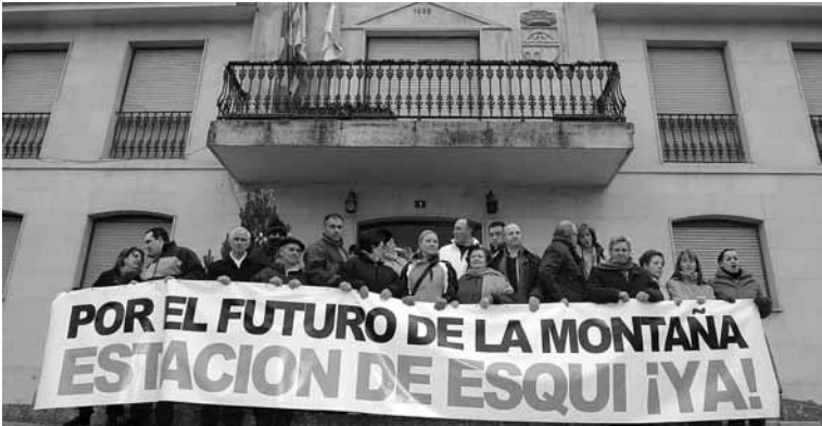
La Montaña Palentina se movilizó en favor de la estación de esquí.

El Tribunal señala la dudosa viabilidad de la estación de esquí