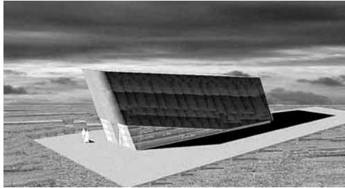
Imagen de como será el pabellón de acceso a la Cueva de los Franceses.

De esta forma, el próximo 5 de mayo, tras el fin de semana del Puente de Mayo, el Patronato de Turismo de la Diputación Provin-