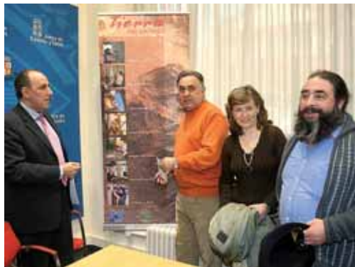
La Casa de la Laguna de la Nava será la primera parada de la muestra.

Y es que según Hernández el objetivo pasa por acercar a los visitantes de casas de parques y centros de interpretación "los valores del arte".