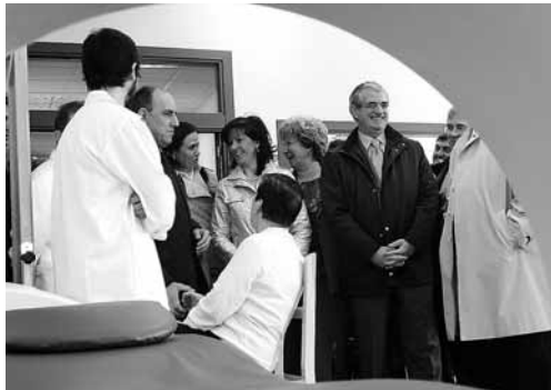
El consejero de Sanidad inauguró la ampliación del Centro de Salud.

Estas obras han permitido ampliar las dependencias actuales en 227,56 metros cuadrados de nueva construcción en los cuales se ha puesto en servicio una consulta de Fisioterapia, una sala de cinesiterapia