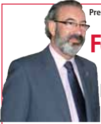
Presidente Consorcio Provincial