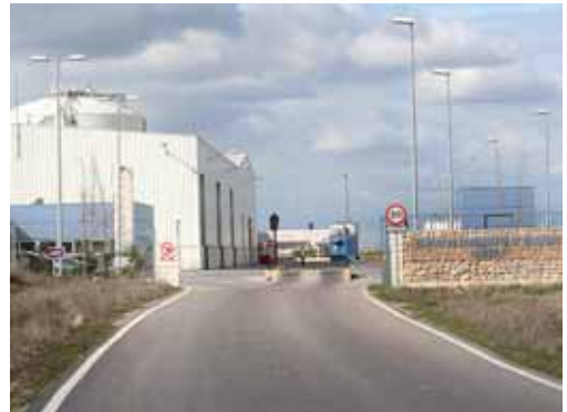
Imagen del Centro de Tratamiento de Residuos de Palencia.

Así lo decidió el Consejo de Administración del Consorcio Provincial para la Gestión Medioambiental y de Tratamiento de Residuos Sólidos tras aceptar la propuesta que realizaba el pasado viernes 28 de marzo la mesa