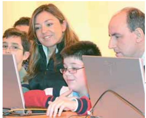
Blasco y el delegado territorial de la Junta en la inauguración.

denominado Infonietos , en el que se pretende que los abuelos con sus nietos participen en el uso de las nuevas tecnologías".