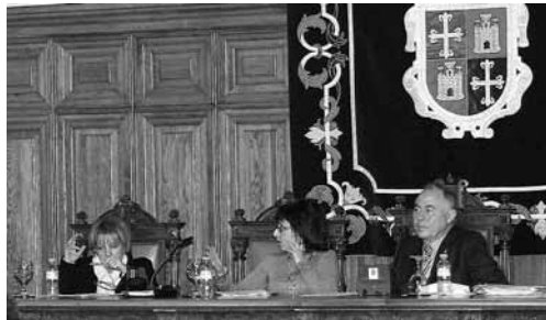
Momento de uno de los plenos celebrados en el Ayuntamiento.

"Estos buenos resultados son fruto de una política de rigor en la gestión del gasto"