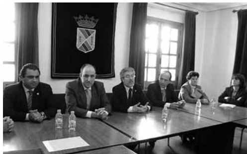
El director general en la entrega de las viviendas en Saldaña.

Un acto en el que el director general de la Vivienda animó a los alcaldes a colaborar cediendo más suelo.