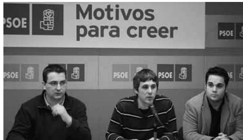
Momento de la rueda de prensa ofrecida por Juventudes Socialistas.