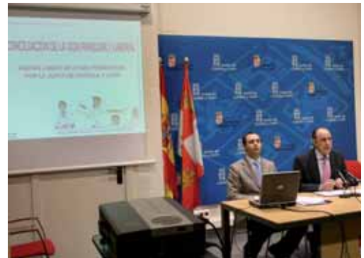
Un momento de la presentación de las líneas de ayuda de la Junta.

La segunda, destinada a familias numerosas con 4 o más hijos recibirán una cuantía de 300 euros por cada hijo a partir del cuarto inclusive, hasta que cum-