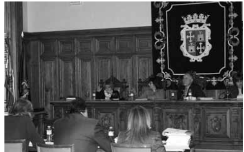
Imagen del pasado pleno celebrado en el Ayuntamiento.

La corporación debatirá además sobre la instalación de urinarios públicos