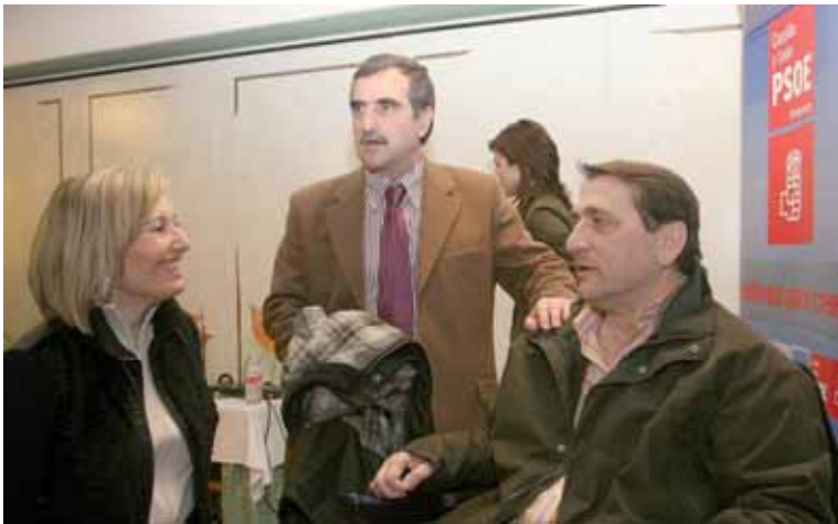
La secretaria de Estado de Servicios Sociales participó en el foro '+Prestaciones'.