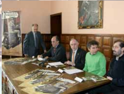
Imagen de la presentación de la XVII Muestra de Internacional de Cine.

Otra de las actividades que se desarrollarán es la sección Imagenación en la que se presentarán cuatro documentales cuyos protagonistas serán los ritmos brasileños. Imagenación ofrecerá la oportunidad de ver los primeros cortometrajes de directores europeos ya consagrados co-