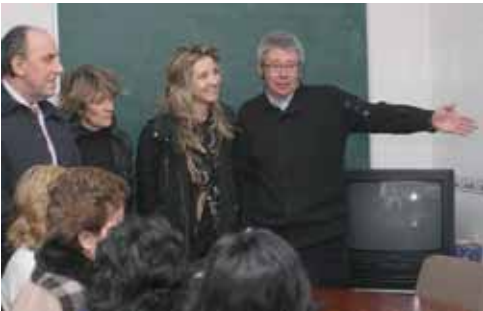
La directora general de la Mujer visitó las instalaciones.