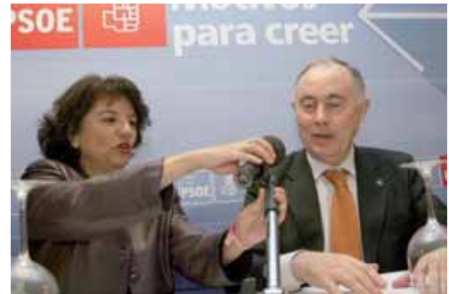
Momento de la rueda de prensa ofrecida por Soledad Murillo.

La Ley de Igualdad que obliga a los partidos políticos a concurrir a elecciones con listas paritarias es otro de los logros que ha alcanzado el PSOE según la responsable de Políticas de Igualdad. Una Ley que como comenta Murillo "esta empezando en la actualidad a dar sus frutos y en la que habrá que seguir trabajando en la misma línea para poder desarrollar algunos de sus apartados".