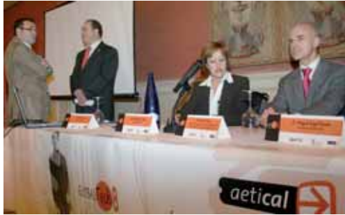
Un momento de la jornada Globaltech8.