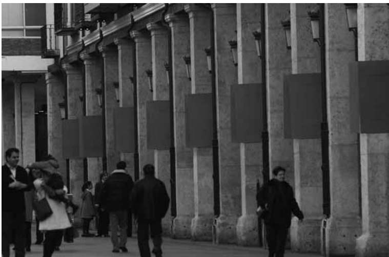
Las columnas de la calle Mayor amanecerán con los carteles de los candidatos pegados.

La inauguración de su exposición fue todo un éxito, personalidades políticas, del mundo del arte y de la comunicación estuvieron arropándole. Este rotativo le hizo entrega de un cuadro con dos reportajes.