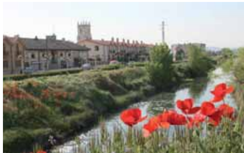
La obra cuenta con un presupuesto de más de 1.000.000 de euros.

Para la consecución de estos objetivos, está prevista la construcción de una nueva planta de tratamiento de agua potable que permita la ampliación de la capa-