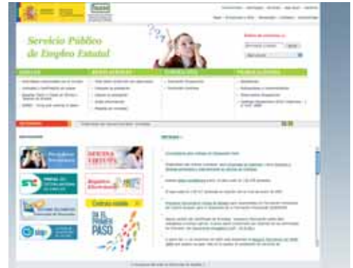
Página web de la nueva oficina virtual del Inem.

El buzón web ofrece al ciudadano la posibilidad de dirigir al Servicio Público de Empleo Estatal (SPEE) cualquier consulta o duda relativa a todas las materias competencia del organismo.