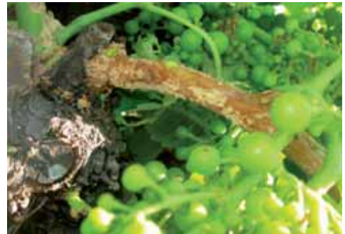
Daños provocados por los topillos en viñedos de la región.

Por otro lado, las Cortes de Castilla y León acordaron pedir al Gobierno que resulte de las próximas elecciones generales que impulse un nuevo Plan Prever para facilitar la renovación del parque automovilístico.