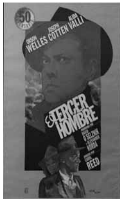
Imagen de uno de los carteles.

No, también del norteamericano, italiano, alemán... de todos los países, hasta un total de cuatro mil carteles cinematográficos.