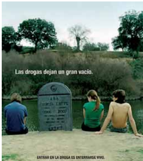
Imagen de una campaña para evitar el consumo entre los jóvenes.

Por otro lado, el Gobierno regional declaró proyectos de Especial Interés para Castilla y León cuatro iniciativas empresariales de las cuales dos se instalarán en Soria, una en León y otra en Valladolid. La inversión prevista se cifra en torno a 13 millones de euros y supondrán la creación de más de 60 empleos. Estos proyectos con esta clasificación de Especial Interés se analizarán en el Consejo Rector de la Agencia de Inversiones y Servicios para que la Comisión Delegada de Asuntos Económicos establezca el límite de apoyo económico. Aunque las ayudas de la Junta estarían en 1,6 millones de euros.