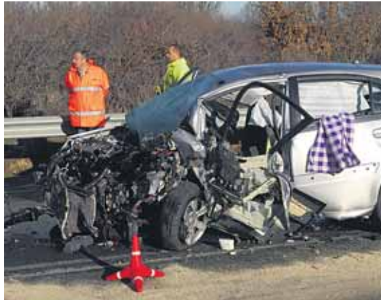
Los datos de siniestralidad mejoraron hasta el mes de agosto.

Las cifras de siniestralidad sitúan a Segovia en los mejores puestos de la lista nacional por provincias, al igual que los guaris-