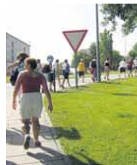
Varios participantes del año pasado.

Las rutas de los fines de semana, los domingos, serán de más