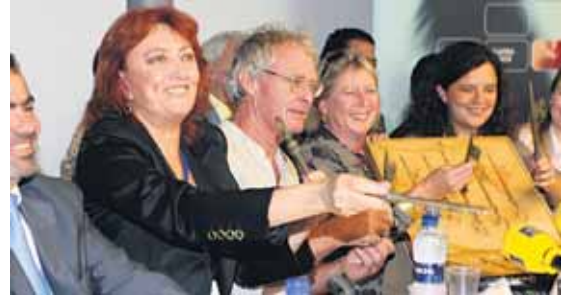
Presentación del Hay Festival en la sede madrileña de British Council.

retratos y autorretratos de periodistas y sobre poesía, mientras que esta oferta se completa con otras muestras de fotografía y esculturas, en distintas salas y espacios de la ciudad.