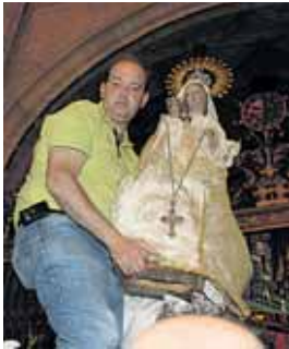
Llegada de la imagen al seo.