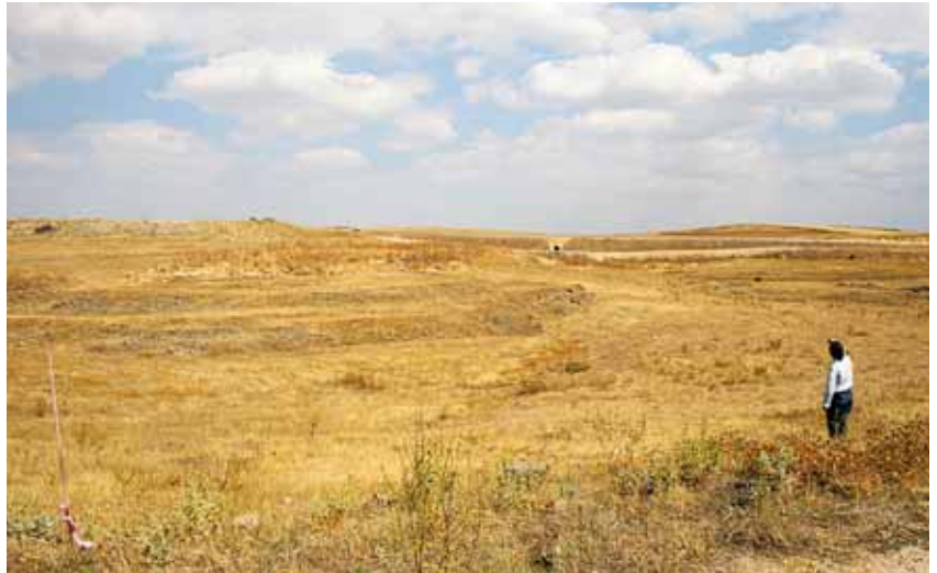
Vista parcial de las fincas rústicas especialmente protegidas en las que se pretendía hacer el depósito temporal.

La Cámara de Comercio acogerá los días 25 y 26 de septiembre las primeras Jornadas Técnicas de Buenas Prácticas en la Creación de Empresas que organiza la Concejalía de Desarrollo Local y Empleo. En ellas se debatirá sobre el 'Emprendizaje pionero, la creación de cultura emprendedora y la simplificación de los trámites administrativos'. Las jornadas conforman la actividad principal del proyecto pionero de España 'Red de Excelencia en la creación de empresas', de la cual es socio el Ayuntamiento.