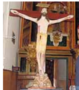
Santo Cristo de Rapariegos..