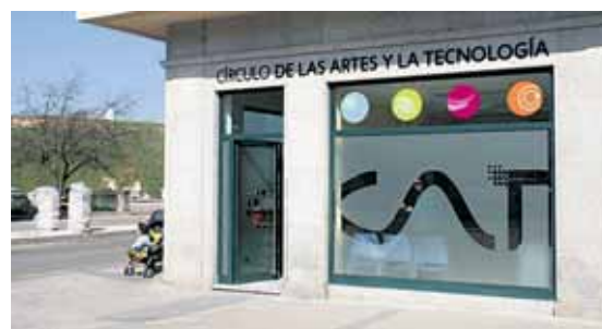
El CAT sólo ha recibido hasta ahora apoyo de la administración central.