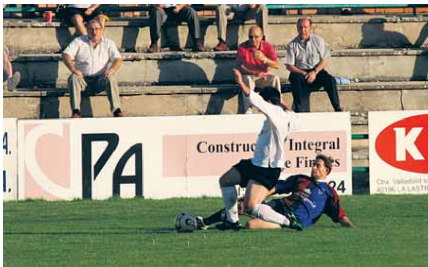
La Sego no ha pasado del empate en casa, pero ha ganado los dos encuentros disputados fuera hasta ahora.