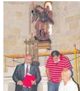
Arcángel de Fuentidueña.

Los trabajos han sido realizados por Conservación y Restauración Silveira S.L.