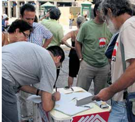
Los trabajadores recogieron firmas en Fernández Ladreda.

El lunes, unos noventa empleados de la 'choricera', donde acudió la Policía Nacional, no pudieron acceder a sus puestos