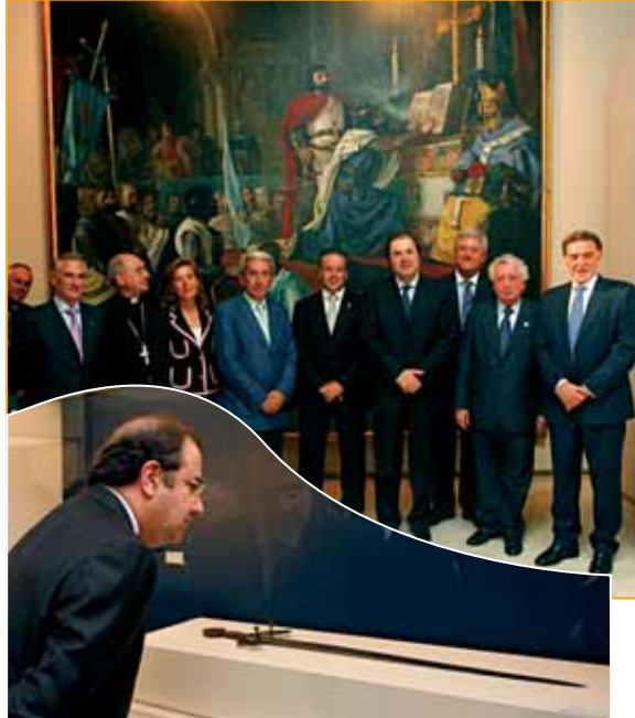
El presidente de la Junta, Juan Vicente Herrera, ya disfrutó de la muestra.

La exposición, organizada por la Junta y la Sociedad Estatal de