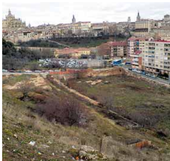
La urbanización de los terrenos lleva tramitándose cinco años.

trucción de una decena de bloques, para sumar 315 viviendas, además de espacios de ocio, comerciales, dotacionales, zonas verdes y los nuevos viales, sus futuras calles.