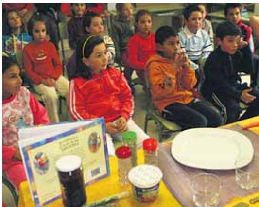
Los escolares del centro Nueva Segovia, escuchan uno de los cuentos.

Cada sesión suele durar en torno a cincuenta minutos, pero son