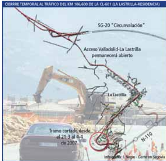
Plano de la zona que permanecerá en obras durante dos semanas.

De este modo, Fomento recomienda, para el tráfico entrante a Segovia, utilizar la variante SG-