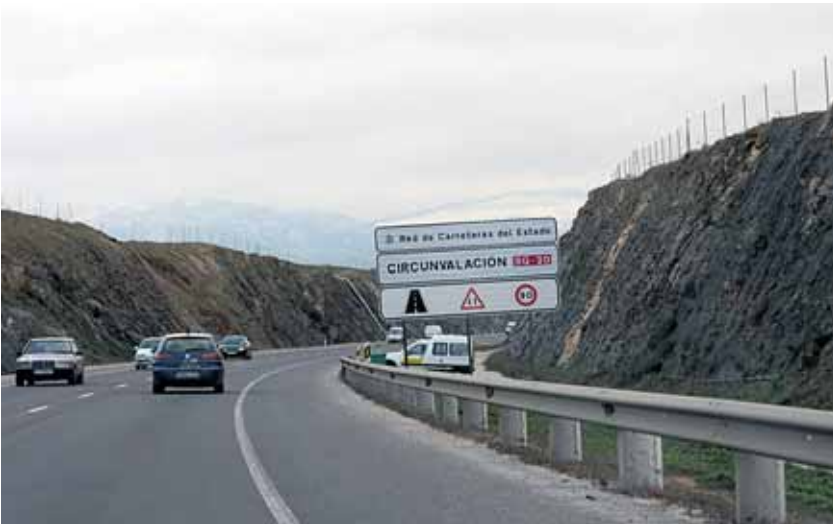
Entre los trabajos se contemplan la construcción de 19 obras de drenaje, 17 pasos y cuatro viaductos.