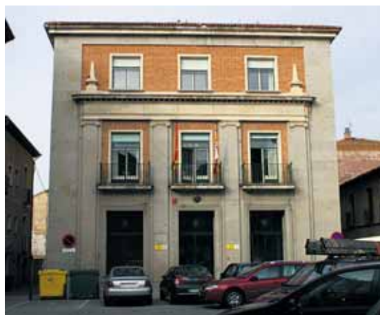
El director de INSS no descarta la idea del traslado.