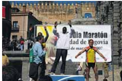
La salida, con el Acueducto de fondo. Corredores en Juan II. Masiva presencia de público y el podio.