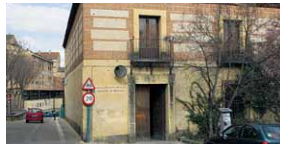
El patronato de la Uned cuenta con 834 matrículas este curso.

López Peláez afirmó que se están estudiando las necesidades presupuestarias para la creación de los laboratorios de prácticas, principal escollo para implantar la nueva titulación "ligada al desarrollo agropecuario e industrial"