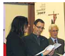
Presidente de la Junta de Cofradías.

Además, los amantes del coleccionismo podrán conseguir los famosos muñecos para adultos 'VinilToys' de diseñadores europeos y de dos segovianos Basto y DRG.