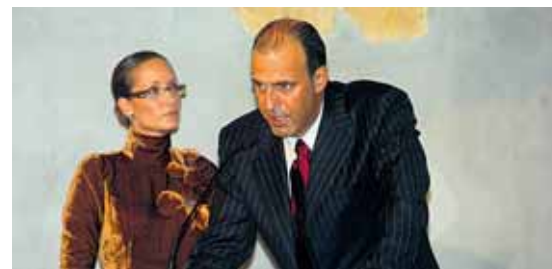
Noche de la presentación oficial de la candidatura a la capitalidad.

La fiesta de la cultura que se celebrará el próximo 1 de junio, a las 20,16 horas exactamente, cuenta