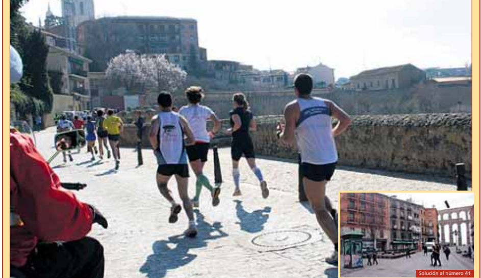
Solución al número 41