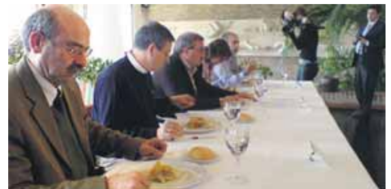
Los expertos catan el cochinillo con marchamo número 300.000.

Precisamente, Procese ha registrado las 300.000 unidades