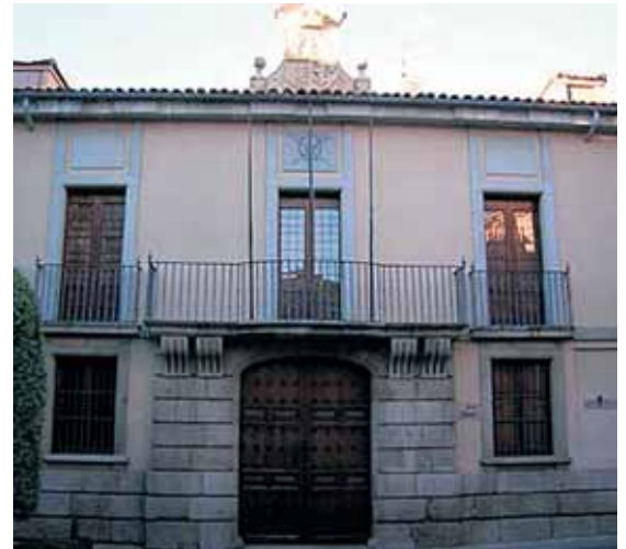
La UVA solicita la participación de toda la comunidad universitaria.