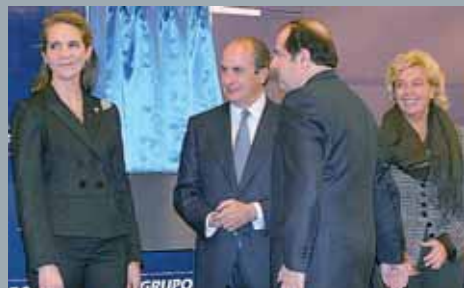
El acto inaugural fue presidido por la Infanta Elena.