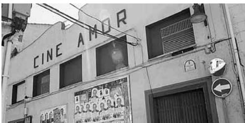
Imagen de archivo del antiguo Cine Amor de Aguilar de Campoo.

Un proyecto televisivo que cuenta con el apoyo de la Obra Social de La Caixa y la Asociación para la Promoción del Cine Secuencia 7 , está formado por espacios formativos, culturales y musicales, llevados a cabo por los propios internos, que están dirigidos por profesionales del medio audiovisual, los mismos que supervisan grabación de una serie con guionistas y actores que han recibido formación hasta el pasado mes de octubre.