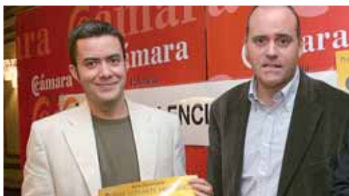
Imagen de archivo de una rueda de prensa ofrecida por Palencia Abierta.

La Asociación no descarta posibles movilizaciones para presionar a las Administraciones por la falta de apoyo