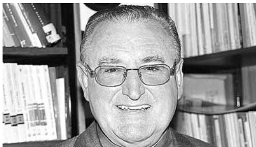
En la imagen el obispo emérito de Palencia, Nicolás Castellanos.

"Cuando yo llegue a Santa Cruz, comenzamos con la construcción de colegios. Este año han hecho 9 colegios, en los 17 años que lleva Hombres Nuevos, se han puesto en marcha unos 50. Luego pusimos en marcha la primera escuela universitaria. Ahora el paso obligatorio es crear puestos de trabajo", añadió Castellanos.