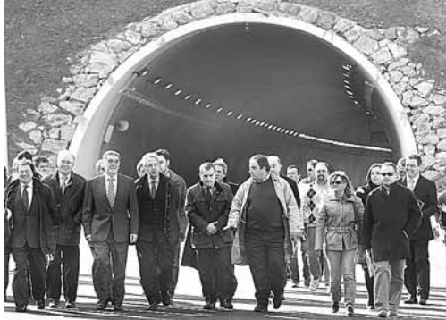
Momento de la inauguración del tramo Alar-Puebla de San Vicente.

El resto, los 35 kilómetros que faltan para terminar la autovía a Santander se abrirán en el primer