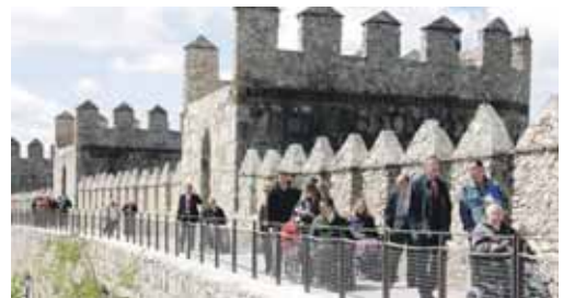
El tramo accesible de la muralla abrió al público en abril de este año.

El Auditorio de San Francisco de Ávila acoge del 26 al 28 de noviembre el curso gratuito Jornadas de Accesibilidad Universal al Patrimonio, organizado por la concejalía de Accesibilidad, la Junta de Castilla y León en colaboración con la Fundación ACS y la USAL. Se trata de un foro de debate que pretende concienciar sobre la importancia de la accesibilidad universal como eje para perseguir la igualdad social. Con ponencias y foros de debate, el programa incluye un taller de empatía.