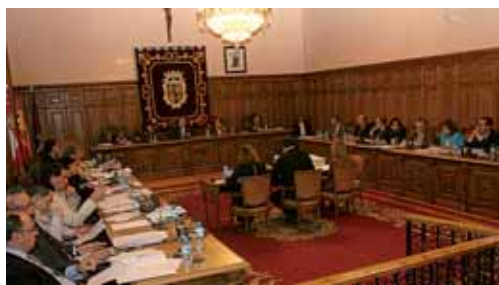
Último pleno celebrado en el Ayuntamiento de la capital palentina.

Así solicita reforzar las políticas de Igualdad de Oportunidades, especialmente, aquellas dirigidas a crear condiciones laborales que eviten que las mujeres sin recursos se vean abocadas a formar parte de la población prostituida. Y pide, entre otras cosas, desalentar la demanda masculina, promoviendo campañas que permitan "modificar la percepción social del uso de las mujeres como mercancía sexual".