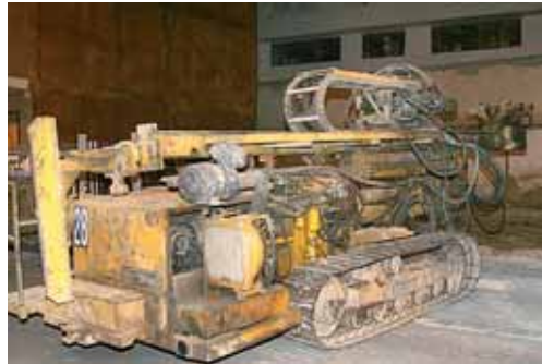
Imagen de la máquina de pilotaje en el solar de Gaspar Arroyo.