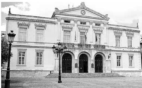
En la imagen, el Ayuntamiento de la capital palentina.

cuentan con 15 plazas por cada uno: Operador de Armado y Montaje de Carpintería y Muebles y Dependiente de Productos Frescos . Los interesados podrán recibir información en la Agencia de Desarrollo Local y formalizar sus solicitudes o inscripciones en el Registro Municipal entre los días 18 y 28 de noviembre. El programa Inserta + desarrollará en el segundo semestre del 2009 otros dos cursos de formación teórica y práctica para cajero y para auxiliar de industrias alimentarias.