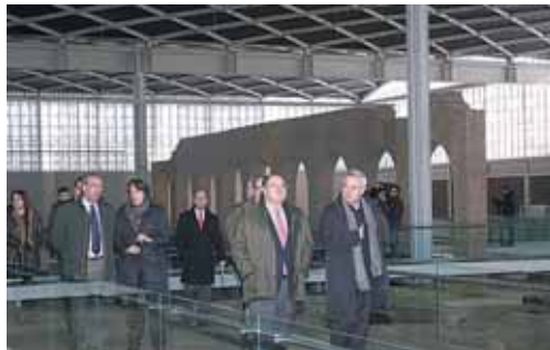
Imagen de la visita realizada a la Villa Romana de La Olmeda.

La intención que se ha perseguido con la ejecución de las obras que se han acometido en el yacimiento arqueológico durante más de tres años, ha sido devolver