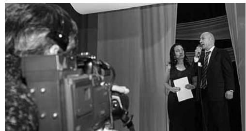
El proyecto cuenta con el apoyo de la 'La Caixa' y 'Secuencia 7'.