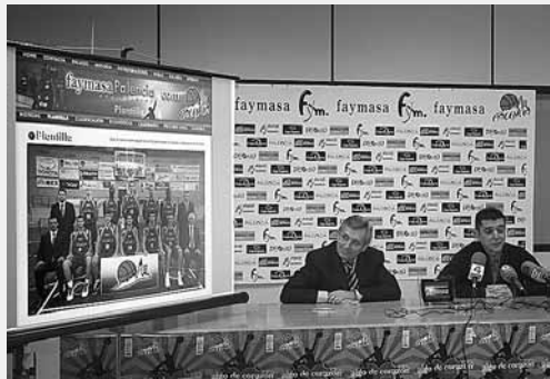
Momento de la inauguración de la nueva página web del club.

Su próximo encuentro tendrá lugar el sábado 22 de noviembre a partir de las 18.00 horas en la cancha del C.B.L. Hospitalet. Esperamos que sumen otra victoria.