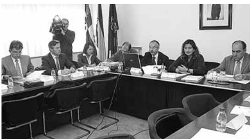
Momento de la Comisión Regional de Minería celebrada en Palencia.

La viceconsejera de Economía subrayó además el compromiso de las comunidades autónomas que cuentan con zonas mineras para completar con un 25% el 75% restante de fondos que aporta el Estado al Plan del Carbón.