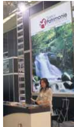
Detalle del expositor.

có la intención de la Institución provincial de realizar visitas a las piedras pintadas que el artista vasco Agustín Ibarrola ha realizado en Muñogalindo, que se sumarían a los atractivos de la zona, como el Ecomuseo de la localidad.