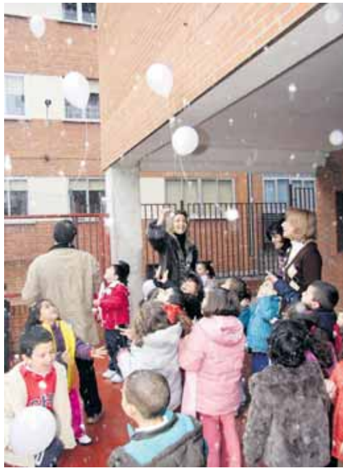
Suelta de globos en el Colegio Público Santa Ana.

Por su parte, el PSOE, UGT, la Federación de Asociaciones de Mujeres Rurales y la Federación de Mujeres Progresistas se reunieron en el Grande para dar lectura a un manifiesto y repartir claveles y lazos blancos entre los paseantes.