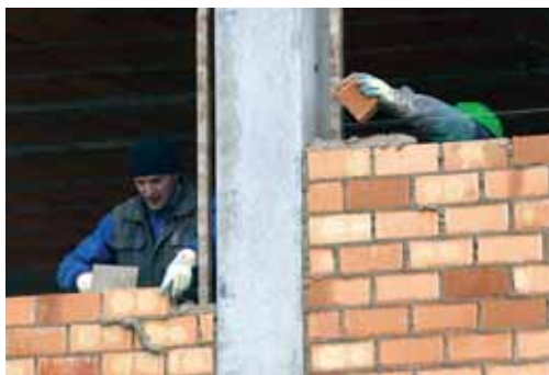
Trabajadores del sector de la construcción.

La Junta se comprometió con los agentes económicos y sociales, en el marco del actual Plan de Empleo vigente desde 2007 hasta 2010, a complementar la financiación para desarrollar acciones de