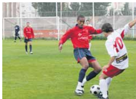
El Real Ávila únicamente ha vencido fuera en una jornada.