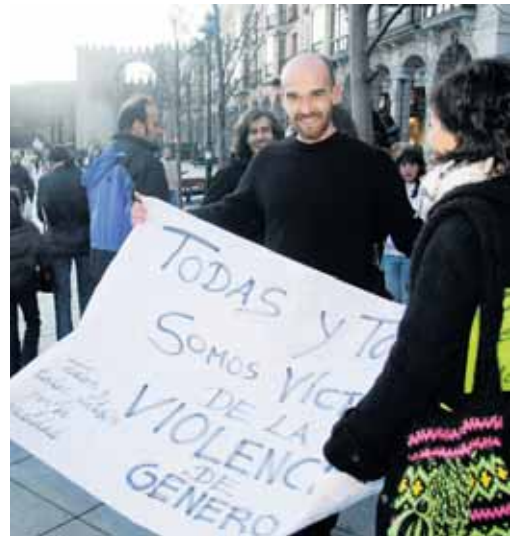
Participantes en la 'performance' de El Grande.

medidas para intensificar la protección a las víctimas.