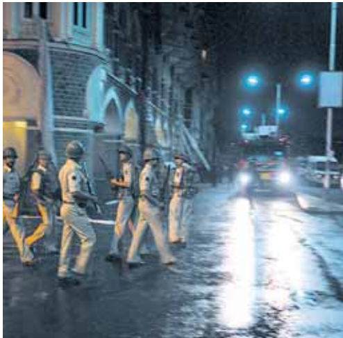
Policías indios patrullan una de las calles de Bombay.

Un avión vuela ya hacia Bombay para repatriar a los cincuenta españoles que permanecen en la ciudad, entre los que se encuentran parte de la Delegación madrileña. Al cierre de esta edición los enfrentamientos continúan.