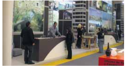
Vista general del stand de Ávila en Intur.

subrayó. A su juicio, sería un aliado para la atracción de turistas.