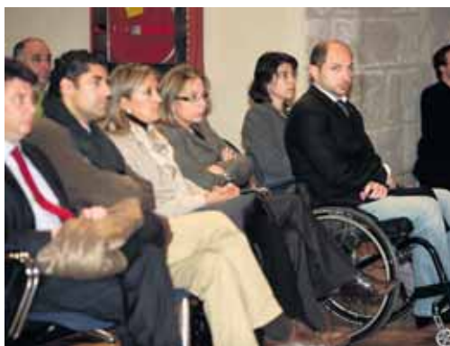
El Auditorio de San Francisco, lleno en la celebración de las jornadas.

Además, el director general de Patrimonio anunció que el Plan