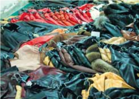
Imagen de las prendas robadas y recuperadas por la Guardia Civil.