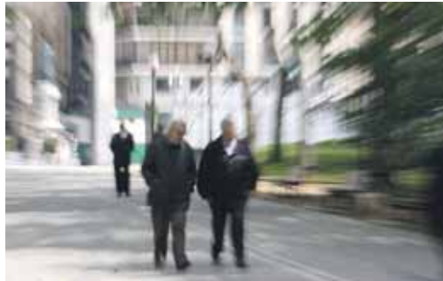
La Ley de Dependencia se aplica paulatinamente en la región.

Desde que a finales de abril de 2007 se publicó el baremo que establecía los criterios para valorar a las personas dependientes, las solicitudes han ascendido a 40.745. Todas han sido revisadas y 39.389 personas ya han sido valoradas o están en vías de valo-