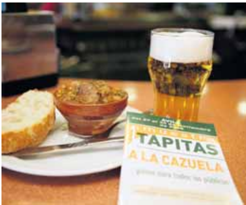
Una treintena de establecimientos participan en 'Tapitas a la cazuela'.

Asimismo, las jornadas cuentan con un panel de experiencias de diferentes localidades, entre ellas la de El Barraco.