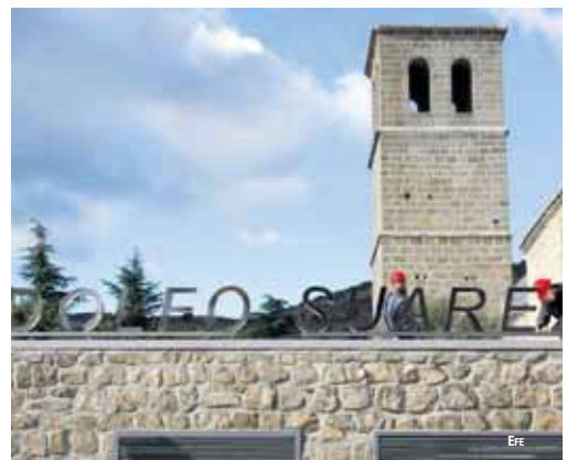
La Iglesia Vieja de Cebreros es la sede del nuevo Museo.

El Museo pretende convertirse en un centro para la conservación, estudio y difusión de este periodo de la Historia de España y en lugar que se convertirá en testimonio para futuras generaciones.