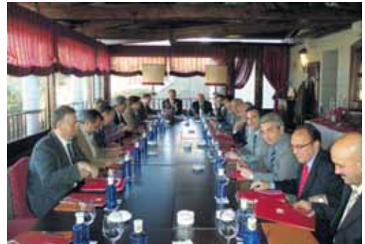
Pleno de la Cámara de Comercio e Industria.

La Cámara considera que la A-40 debe entenderse como "compromiso preferente de inversión" que permita poner en servicio la autovía antes de 2012. En este sentido, consideran "prioritario" reducir "al menos a la mitad" los plazos establecidos en la aprobación de informes, estudios informativos y declaración de impacto ambiental.