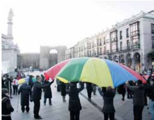
Exhibición en vivo en El Grande.

El Grande acogió una exhibición en vivo con la participación de jóvenes vestidos de negro