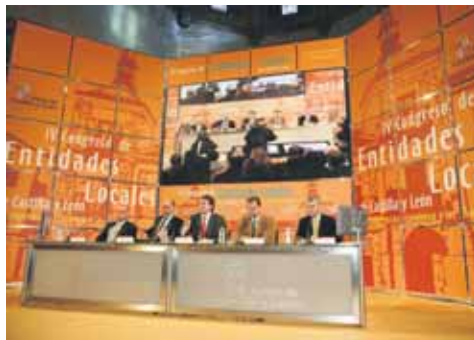
El consejero de Presidencia, en la inauguración del congreso.