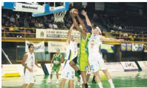
No sin dificultades, el Óbila venció la pasada jornada al Feve Oviedo.