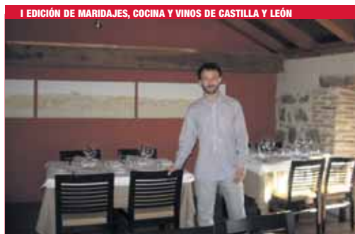
1ª EDICIÓN DE MARIDAJES, COCINA Y VINOS DE CASTILLA Y LEÓN

Para conmemorar sus 80 años, Paradores ha preparado una gran celebración gastronómica en todos sus establecimientos. Esta iniciativa pretende ofrecer a los clientes una amplia oferta de menús basados en la historia culinaria de España y en la actualización de los platos tradicionales de cada región.