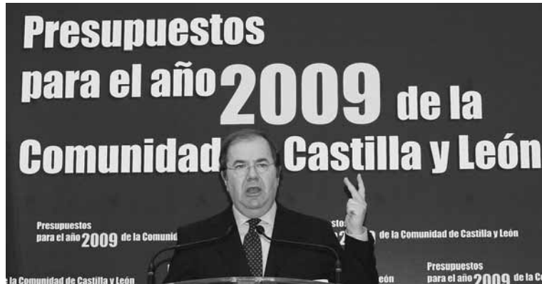
El presidente de la Junta, Juan Vicente Herrera, en la presentación de los Presupuestos de 2009.

El hecho de recurrir al déficit ha estado determinado por la disminución de los ingresos ordinarios. A esto hay que añadir la reducción de los ingresos procedentes del modelo de financiación autonómica, reflejados en los Presupuestos