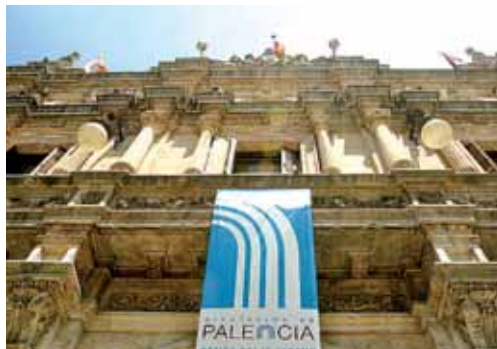
Imagen de archivo de la Diputación Provincial.

Un total de 54 solicitudes de pequeñas empresas, personas físicas o jurídicas y comunidades de bienes con planes de inversión se presentaron a esta convocatoria, de las cuales se verán beneficiadas 45 de ellas, que fueron las que presentaron toda la documentación requerida. La inver-