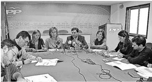
Imagen de la presentación del presupuesto para Palencia.

Entre las inversiones más importantes destaca la cantidad de 7.608 euros en la Consejería de Hacienda para la ampliación del edificio administrativo; 5,2 millones de euros para el Hospital Río Carrión; 7.703 euros para infraestructuras como el nuevo centro de Enseñanza de Arte o la construcción de un Centro de Educación Infantil y Primaria en Villalobón. Otro apartado importante de inversiones son los polígonos industriales. De esta forma, el de Dueñas recibirá una inversión de 11,4 millones de euros y de 12 el de Magaz.