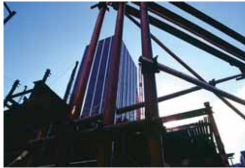
El sector de la construcción ha pasado factura a la recaudación.

Una propuesta de Ordenanzas Fiscales que el concejal de Hacienda reconoció que está condicionada por tres aspectos. El primero, la reducción de ingresos de los tributos, especialmente los que tienen que ver con el sector de la construcción, cuyo descenso se cifra en un 22%. En segundo lugar, afecta al encarecimiento de los costes de los servicios que el Ayuntamiento presta. Y por último, la situación en la que se