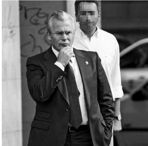
Baltasar Garzón magistrado de la Audiencia Nacional.

Ahora, Baltasar Garzón les da la razón, al considerar que en los delitos permanentes, la competencia para juzgarlos la tienen los jueces y tribunales de la Audiencia Nacional.