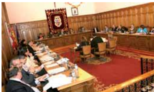
Imagen de archivo de un pleno celebrado en el Ayuntamiento.

señalando que "si no es por la moción que ha presentado el PP y la de IU y el PSOE, no duraría más de quince minutos. Esta claro que la actividad que mantiene el Ayuntamiento no da contenido a un pleno mensual". Además de la moción del PP, PSOE e IU han adelantado que redactarán una moción conjunta sobre la celebración de la Jornada Mundial por el Trabajo Decente.