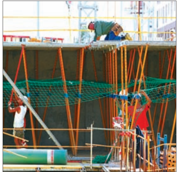
Los sindicatos exigen sanciones para las empresas que incumplen la ley