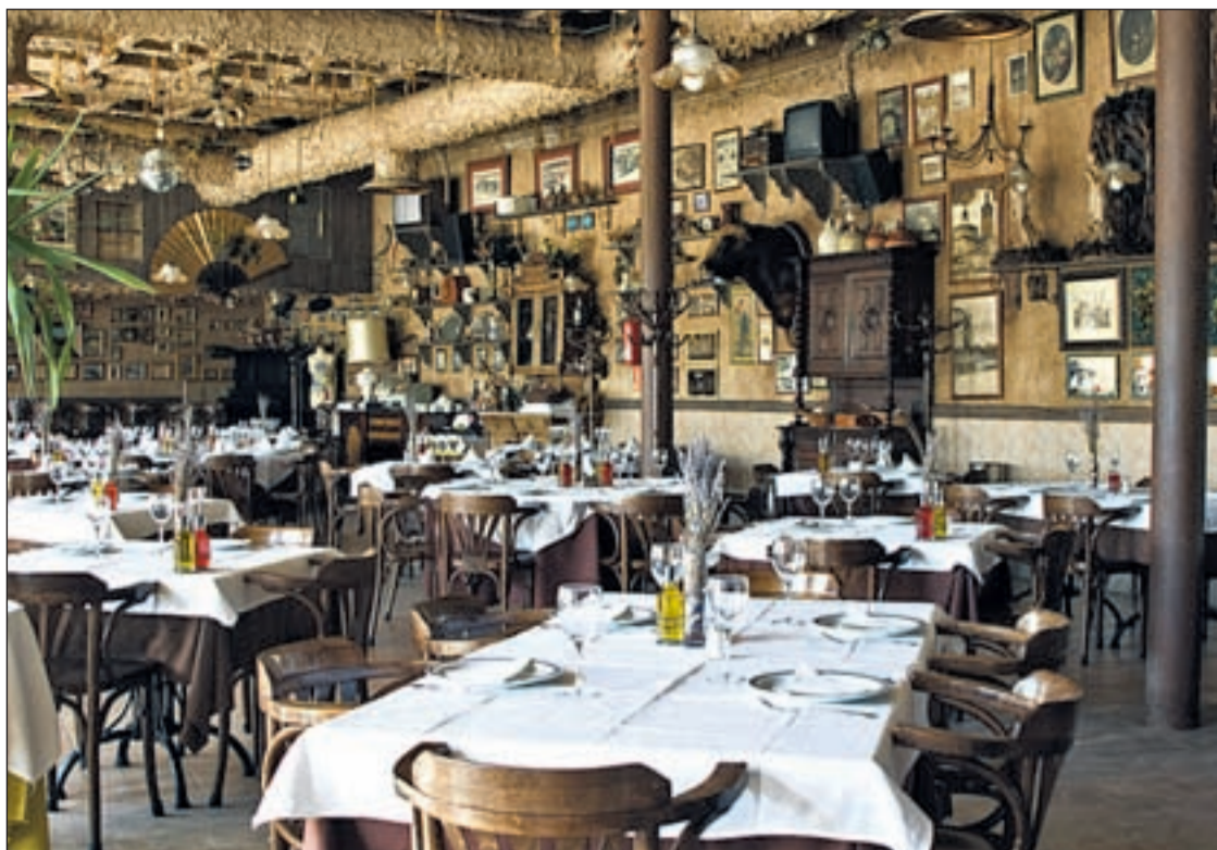
Salón convertido en museo de antigüedades y terraza en el parque durante todo el año

RESTAURANTES EN PLENO PARQUE DE LA RIBOTA EN ALCORCÓN