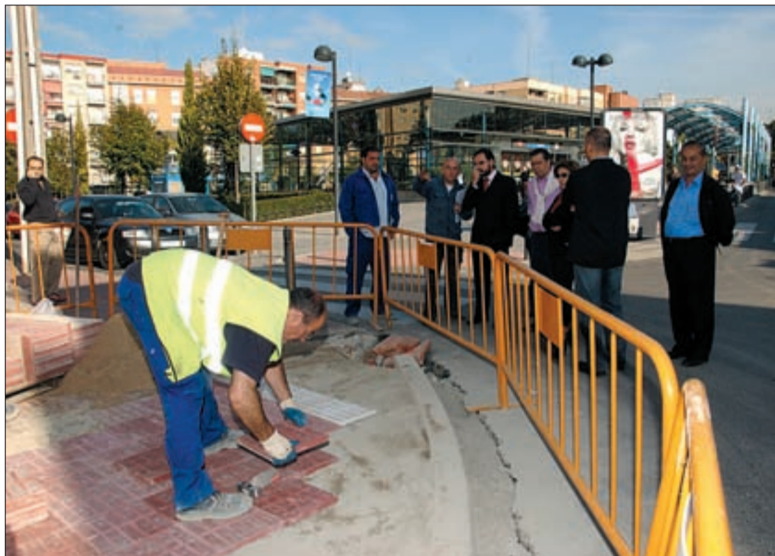
Un operario repara una acera en la calle Agustina de Aragón con Plaza del Pradillo

Cada distrito cuenta con dos cuadrillas de operarios para este tipo de obras, que son realizadas en un plazo máximo de diez días.