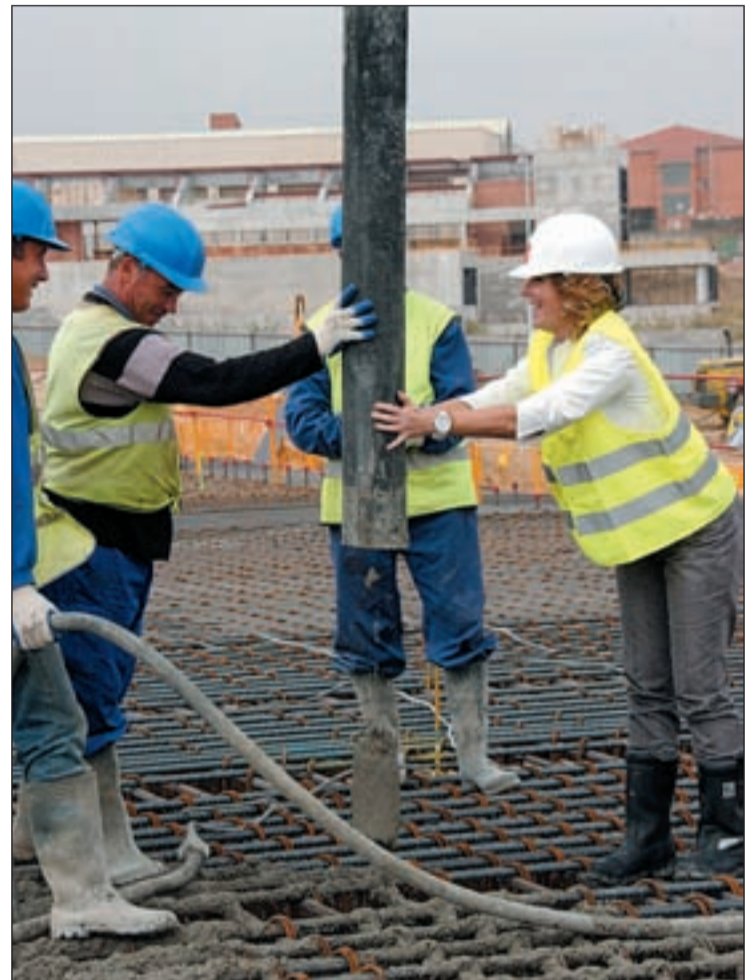
Aguirre con los trabajadores en el tejado de la estación

Aguirre ha adelantado que la Comunidad de Madrid celebrará en los próximos días nuevas reuniones entre responsables de la Consejería de Transportes e Infraestructuras y del Ministe-