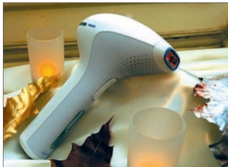
Aparato recargable, cómodo de usar

Además de las numerosas piezas de museo que decoran el restaurante, cada mes hay una exposición de cuadros distinta y todos los sábados por la noche -de octubre a abril-, las cenas son a la luz de las velas y con música en directo a manos de una orquesta. La Ribota es muchísimo más que un restaurante.