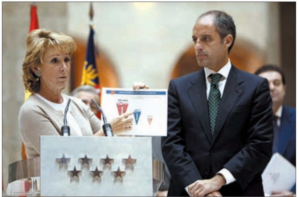
La presidenta Aguirre muestra un gráfico del aumento poblacional, en presencia de Francisco Camps

Además, critica la falta de reconocimiento en el futuro modelo de financiación del incremento poblacional cuando en otras regiones el asunto ya "se ha arreglado" de diferentes maneras. "Es una injusticia flagrante", sentencia, convencida, la presidenta Aguirre.