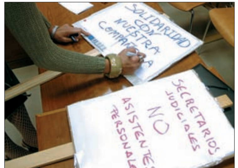
La coincidencia de los paros no fue casual

Finalmente, el Gobierno sacó adelante sus cuentas con los seis diputados del PNV y los dos de BNG, -177 votos a favor-suficientes para rechazar las enmiendas presentadas por el PP, CIU, ERC-IU, CC y UPyD. Un diputado de UPN se abstuvo y consumó la ruptura con el PP.