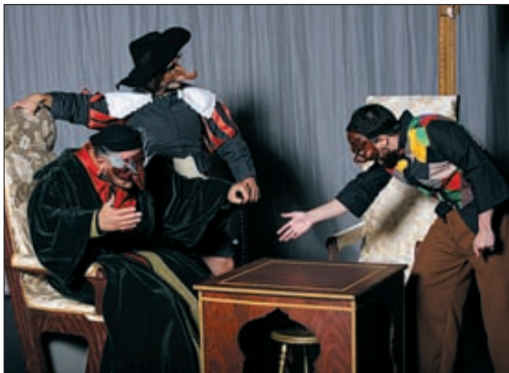
Las compañías ensayan para llevarse el premio a la mejor obra