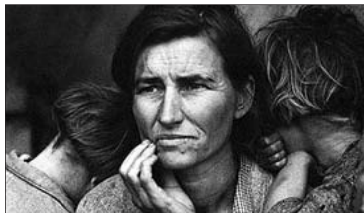
'Madre inmigrante', de Dorotea Lange

Ray William Klein o Marcus Er-witt. No se trata de un catálogo de moda o de imagen como una estética concreta. La exposición combina fotos artísticas y documentales pasando también por posados e, incluso, fotografías anónimas. Todo un alegato en defensa del sexo fuerte.