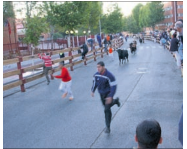
En el encierro del lunes participaron cuatro mil personas

ta de toro. En el tercer encierro, el del lunes, los incidentes se produjeron durante la suelta de novillos. Un joven quedó conmocionado por una caída y otro fue atendido de posible fractura de clavícula, tras sufrir un revolcón, en un día en el que se soltó un novillo más de lo previsto. El encierro más concurrido fue el del sábado, cuando el Ayuntamiento calcula la asistencia en 7.000 personas, frente a las 5.000 del sábado y las 4.000 del lunes.