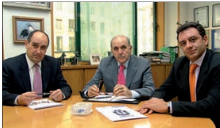
Profesorado con amplia experiencia en las diferentes áreas ofertadas.

Una nueva Universidad a distancia en Madrid