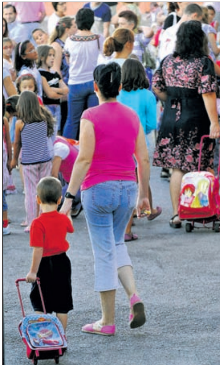
Madres con sus hijos el primer día de curso

modalidades de la familia de la hostelería y del turismo, divididas en dos ciclos. En el ciclo de grado medio, los alumnos podrán optar a titulación de técnico en Servicios de Restaurante y Bar, así como a la de técnico en Cocina y Gastronomía, mientras que en el de grado superior se impartirá la modalidad de técnico superior en Restauración. La nueva infraestructura con su capacidad para seiscientos alumnos y tiene asimismo nueve pabellones.