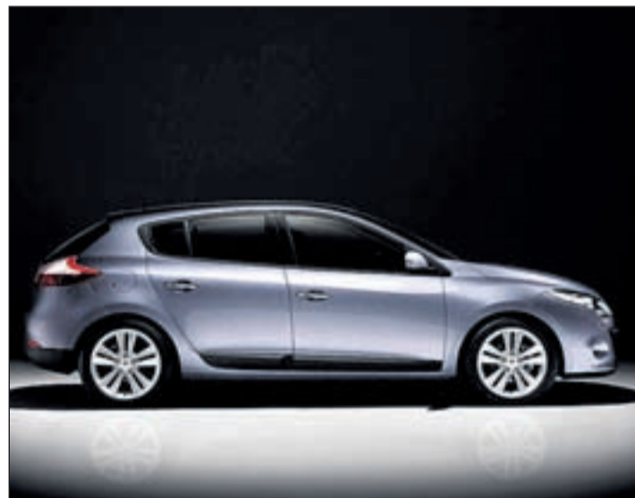
Imagen del perfil del nuevo Renault Megane

La versión de cinco puertas será la primera en llegar, en noviembre. Más adelante irán aterrizando el resto de carrocerías, hasta completar las seis versiones que Renault anuncia tener para 2010. Por tanto, durante estos dos años, convivi-