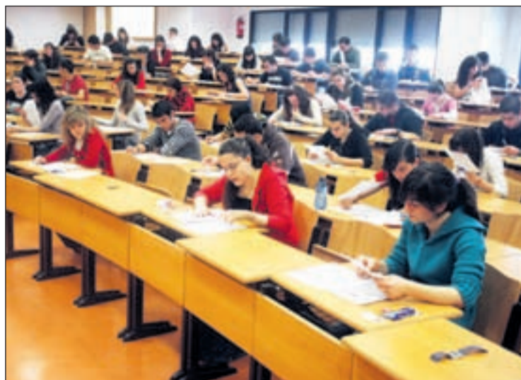
Estudiantes universitarios en una clase