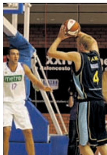
El Estudiantes busca una solución

A falta de dos semanas para que arranque una nueva edición de la Liga ACB, el Estudiantes aún no está en disposición de asegurar a sus aficionados dónde podrán seguir los partidos de su equipo. Con todo, la intención firme del club es permanecer en el Madrid Arena pese al conflicto abierto que mantiene con la empresa que gestiona el recinto deportivo. "Nos basamos en la validez y vigencia del contrato suscrito con Madrid Espacios y Congresos, al que todavía restan dos años para su conclusión", afir-