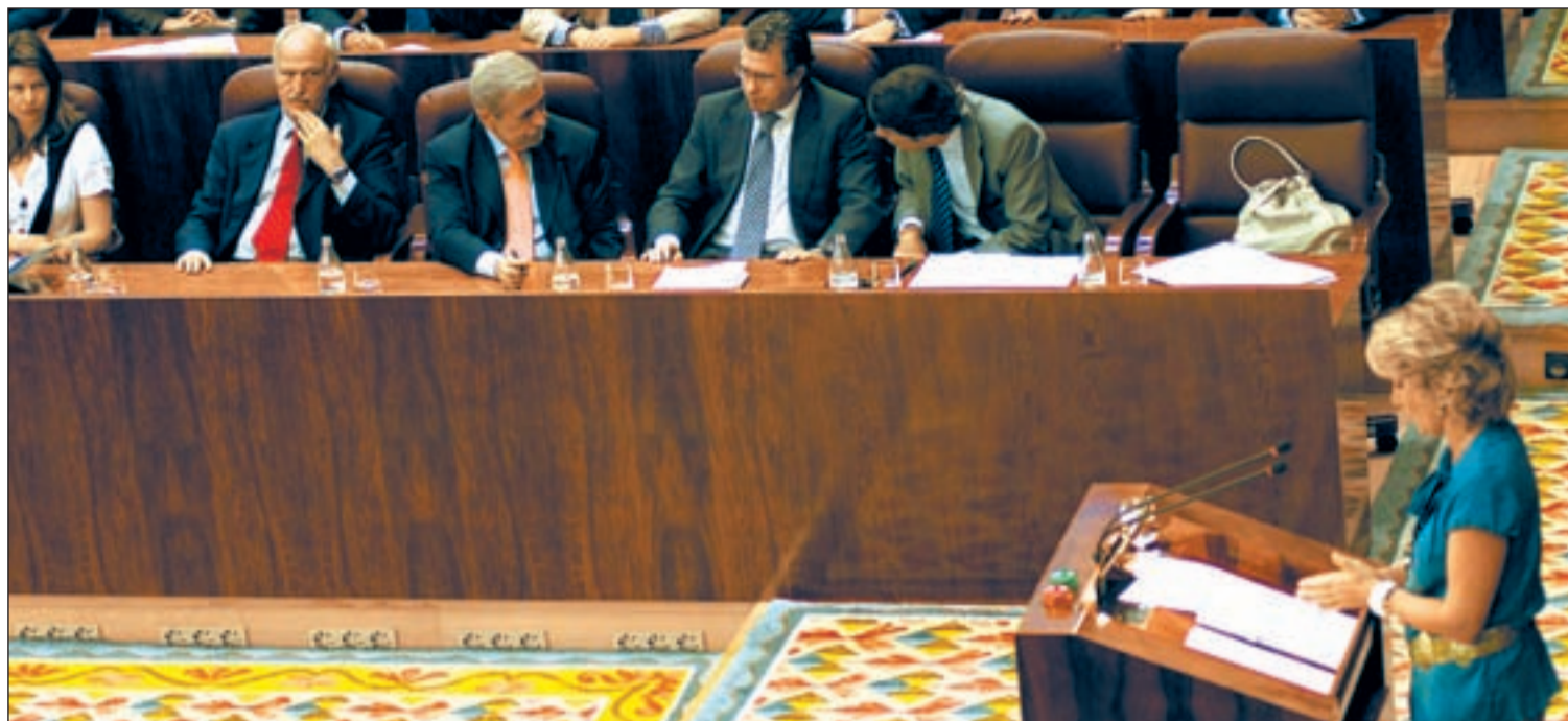
Esperanza Aguirre anunció, ante un hemiciclo repleto, sus próximos proyectos para la Comunidad

PRIMER DEBATE DEL ESTADO DE LA REGIÓN DE LA NUEVA LEGISLATURA