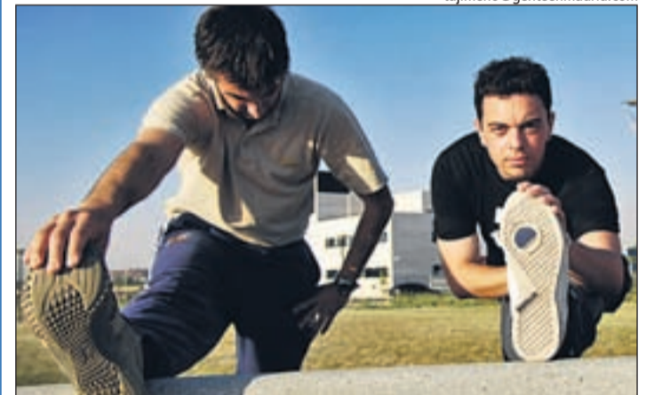
Incorporar el ejercicio al atardecer facilita conciliar el sueño