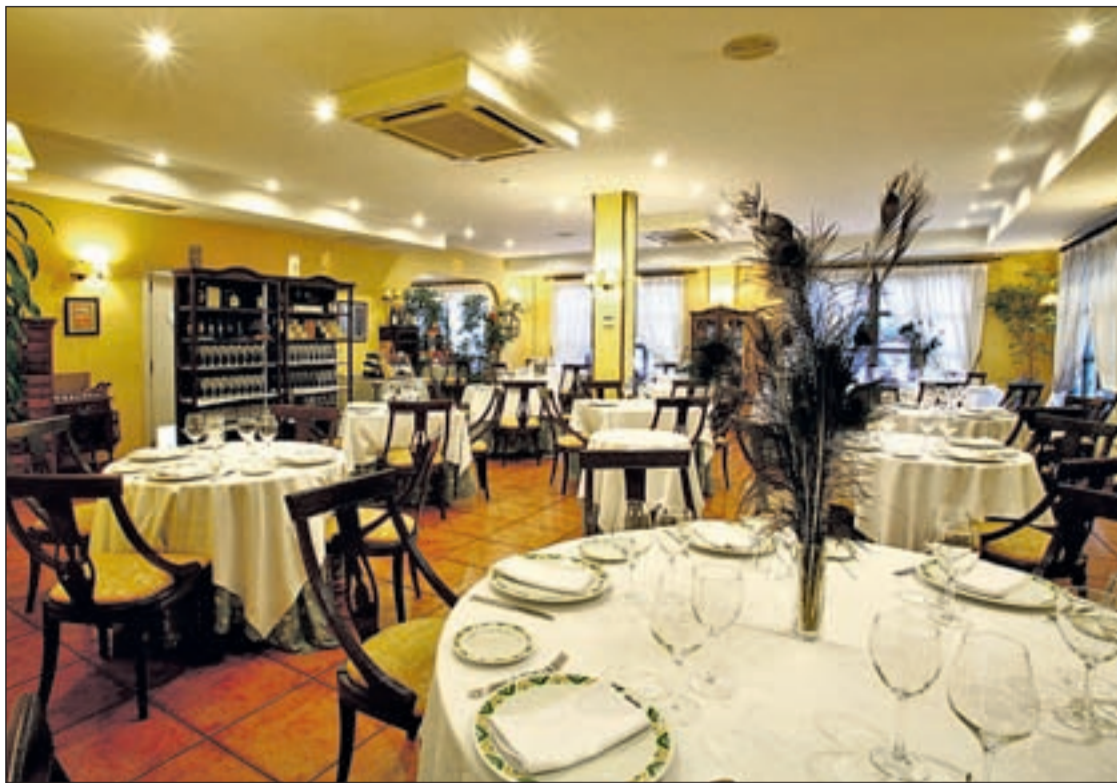
La decoración del restaurante es muy acogedora

COMIDA TRADICIONAL ESPAÑOLA EN TRES CANTOS