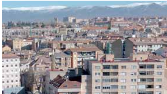
Los Planes Especiales volverán a regir el Urbanismo local.

nifica un paso atrás en las expectativas urbanísticas de la ciudad y en la calidad del documento, que es revisión del de 1984 cuya principal tara era precisamente la existencia de los citados Planes Especiales.