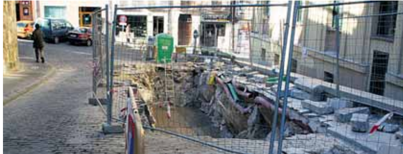
Situación de las obras de soterramiento en la Calle Pintor Montalvo.

En la misma situación están los residentes de la plaza del Potro o calle Pintor Montalvo. Estas isletas forman parte de la segunda fase de soterramiento de