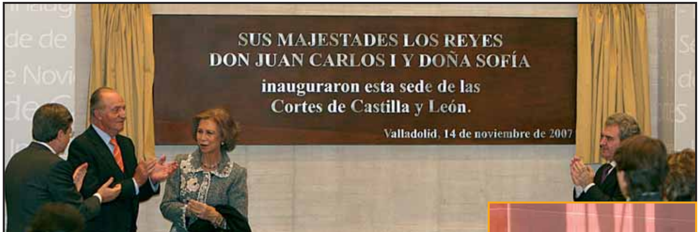
Sus Majestades descubrieron una placa conmemorativa de la inauguración de las Cortes en el salón de recepciones del hemiciclo.