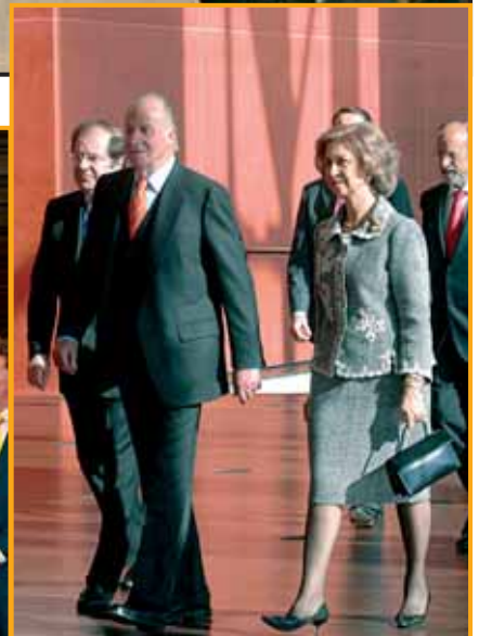
Medio millar de personas siguieron pacientes los actos desde fuera; mientras dentro de las Cortes y el Centro Miguel Delibes, los Reyes realizaron un recorrido por todas las dependencias.