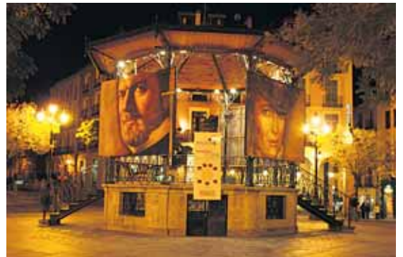
La Muestra de Cine Europeo finalizará el próximo martes.

El ecuador de la muestra, que finaliza el día 20, se cruza este vier-