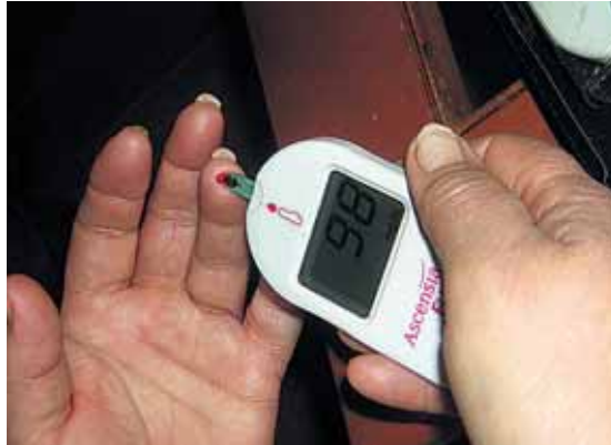
Es recomendable controlarse la dieta y hacer ejercicio físico.

La Asociación de Diabéticos nació en 1979 y tiene su sed en el barrio de La Albuera.