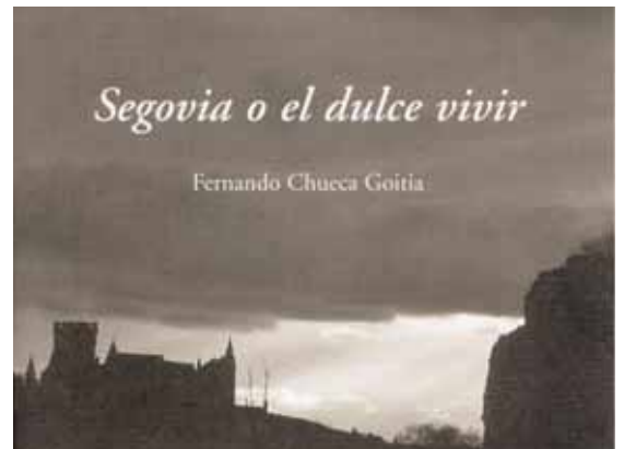
Portada del texto editado con motivo del 50 aniversario.

Esa transformación ya dejaba entrever incluso, como apuntó el conferenciante, el crecimiento hacia La Granja de San Ildefonso.