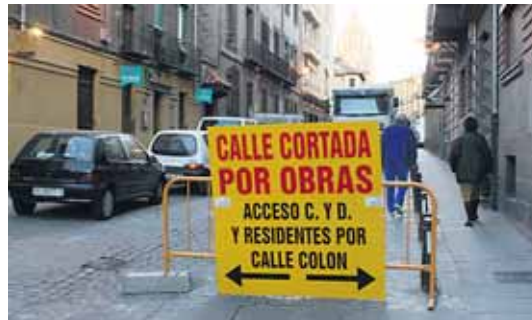
Calle Daoiz, cortada por obras, al igual que la vía Serafin por la que se accedía a la Plaza de la Rubia.

habitáculos que incluye las calles Colón, Trinidad y José Canalejas.