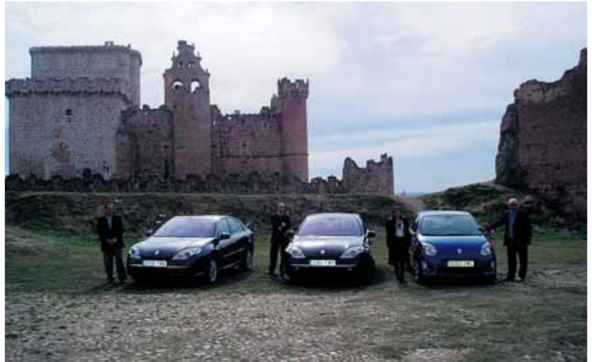
Directivos y responsables de Emaysa Renault presentando varios modelos frente al castillo de Turégano.

Renault ofrece, además, tres años de garantía, frente a los dos años que prometen el resto de