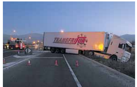
El camión con el que chocó el vehículo, en la variante SG-20.

Los trabajos para convertir en la carretera en autovía comenzarán al año que viene, según informó el delegado regional del Gobierno, Miguel Alejo, el pasado julio. El proyecto tendrán un coste de 33 millones de euros y un plazo de ejecución de dos años.