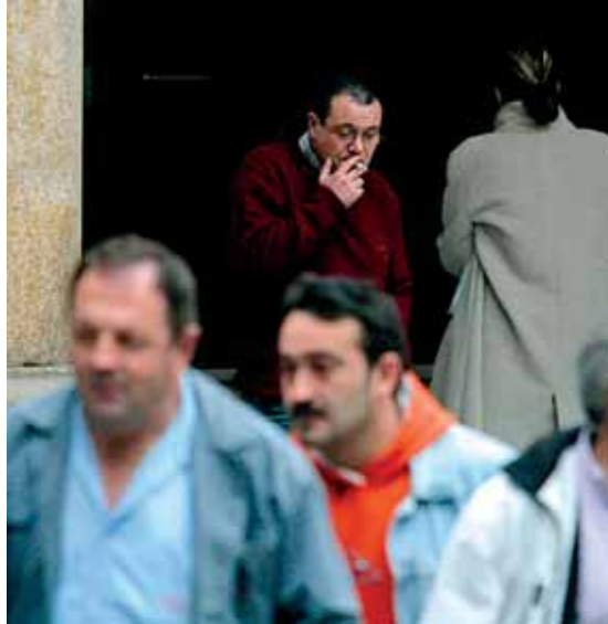
El Decreto aprobado en 2003 está recurrido por el Ministerio de Sanidad.