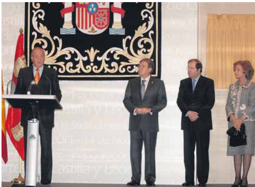
Juan Carlos I inaugura la nueva sede del legislativo autonómico ante la mirada de Fernández, Herrera y la Reina.

NÚMERO 95 - AÑO 3 - DEL 16 AL 22 DE NOVIEMBRE DE 2007 - DISTRIBUCIÓN GRATUITA 20.000 EJEMPLARES - CONTROL SOLICITADO A ojb pjb CLASIFICADOS: 921 466 715