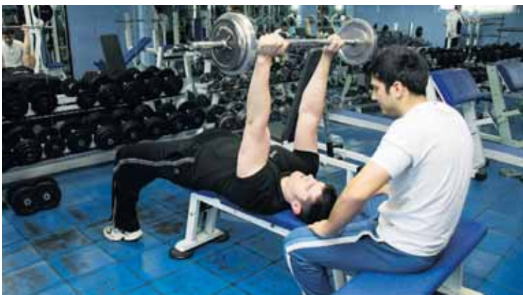
Gimnasio Sound Body.