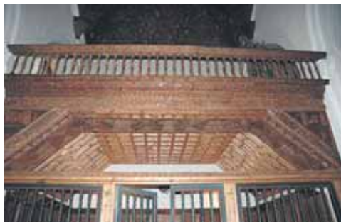
El coro de la iglesia de Madrigal ha recibido una medalla.