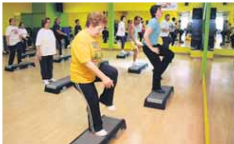
Gimnasio Sound Body.

Aunque los usuarios son conscientes de los muchos beneficios que el ejercicio físico les reporta, no consiguen adaptarse a la rutina de acudir con frecuencia por diversos motivos.