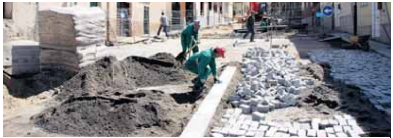
Obras en la calle Conde Don Ramón.

aunque es probable que termine “antes”, con un presupuesto que asciende a 450.000 euros.