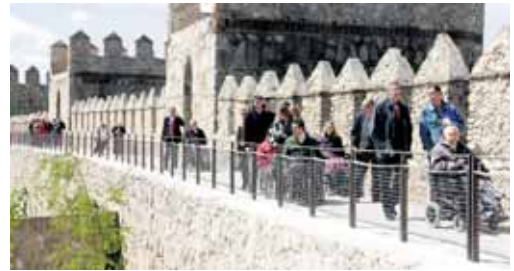
El nuevo tramo visitable del adarve de la Muralla, accesible.

12,00 horas. Además, habrá servicios de guías turísticos en la Casa de las Carnicerías, el Convento San José de las Madres y la capilla de Mosén Rubí.