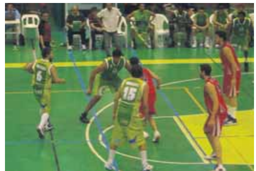
Navarra ganó en Ávila durante un amistoso de pretemporada.