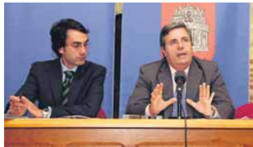
Presentación del Congreso Internacional.