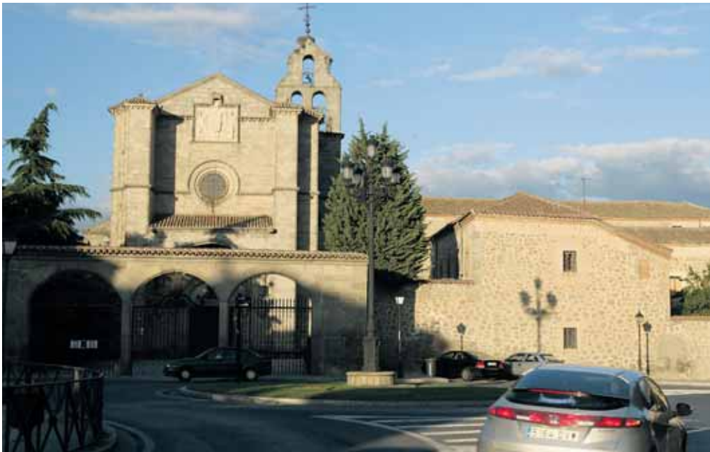
Las obras del templo del Monasterio de Santo Tomás podrían concluir en 2009.

■ La iniciativa para el Monasterio se retoma con los trabajos previos a la restauración de la iglesia ■ La inversión prevista para las obras del templo ascenderá a más de un millón de euros Pág. 3