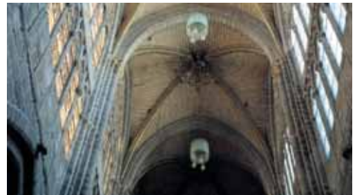
El diseño moderno de las lámparas ha suscitado polémica durante años.

Patrimonio indica que deberán colocarse filtros ultravioletas en todas las luminarias y que la decisión final sobre utilizar lámparas halógenas o de halogenuros metá-