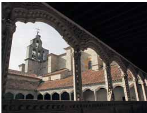
Las obras afectarán al interior y al exterior de la iglesia.

La primera de ellas consistirá en la restauración de la iglesia, que es "lo más urgente", ya que está afectada por varias goteras "y no se ha tocado nunca". Además de la reparación de las cubiertas, se acometerá una restauración