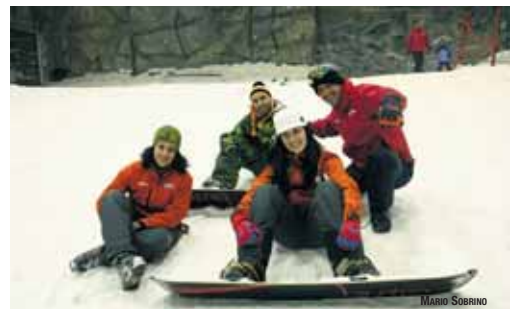
Madrid Snowzone impartió en 2007 más de 20.000 horas lectivas.

Este año puede concluir con más de 100.000 esquiadores