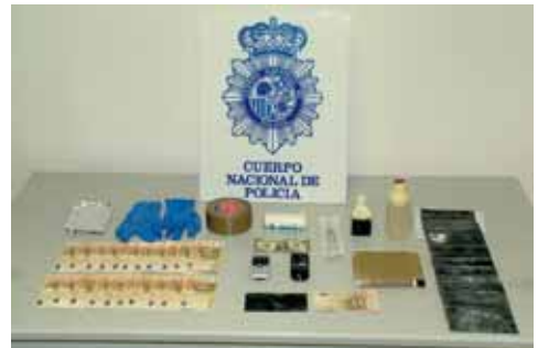
Material aprehendido por la Policía a los presuntos estafadores.