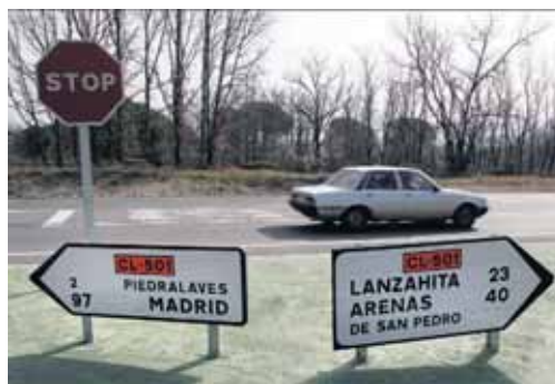
Imagen de la carretera CL-501.

Así, en la provincia de Burgos la inversión ascenderá a 5,3 millo-