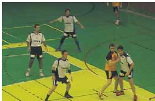
El equipo abulense de balonmano frente a la Universidad de Burgos.