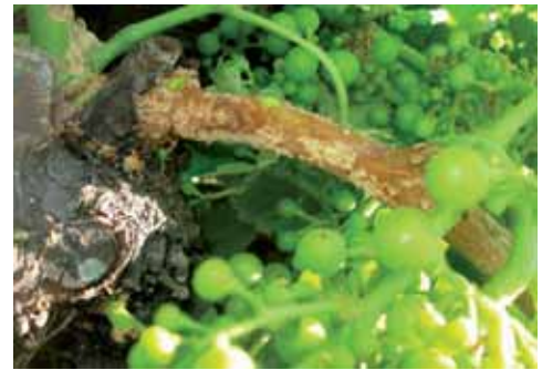
Daños provocados por los topillos en viñedos de la región.

Por otro lado, las Cortes de Castilla y León acordaron pedir al Gobierno que resulte de las próximas elecciones generales que impulse un nuevo Plan Prever para facilitar la renovación del parque automovilístico.