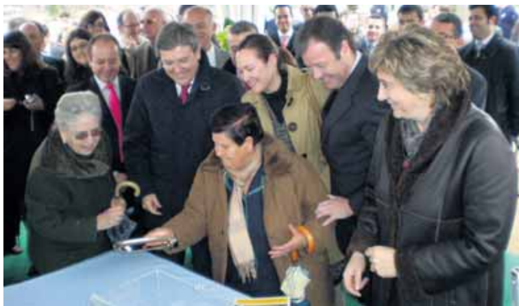
Acto de colocación de la primera piedra de la CL-501.

Medio Ambiente del Gobierno regional aseguró que el proyecto "tiene cumplidos todos los requisitos y trámites" y cuenta con su correspondiente estudio de impacto ambiental.