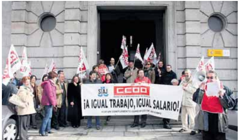
Funcionarios de Justicia y representantes sindicales se concentraron ante la Subdelegación del Gobierno.

En este sentido, las secciones de Castilla y León de las cuatro asociaciones de jueces manifestaron su "comprensión" por las reivindicaciones de los funcionarios de Justicia, que consideran "justas" en su contenido.