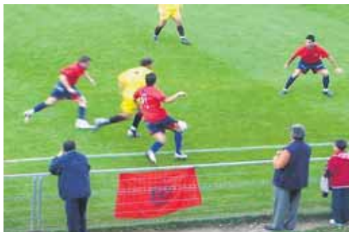
Real Ávila ganó por un gol a cero al Laguna en la primera vuelta.

Situado en decimosexto lugar de la clasificación, el Laguna lleva