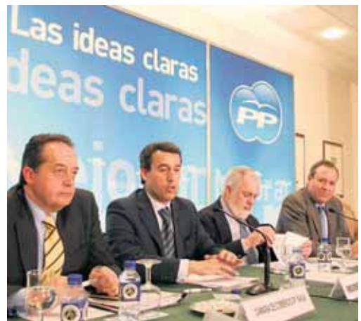
Miguel Arias Cañete durante su encuentro con empresas y sindicatos.

Con respecto a la promesa electoral de Zapatero de abonar 400 euros a los trabajadores y pensionistas, consideró que se trata de "una medida antisocial" porque "los 400 euros no se dan a todos los españoles que ganan menos de 9.000 euros, por lo que de 18 millones de contribuyentes, a seis millones no les llega", como tampoco a los autónomos, ni a los agricultores ni a los beneficiarios de pensiones mínimas.