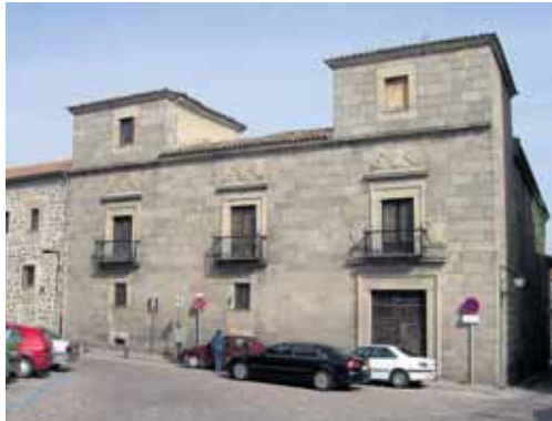
Imagen del Palacio de Caprotti o Superunda, edificio del siglo XVI.

El palacio, adquirido en el año 2006 merced a un convenio urbanístico con tres promotores y con los herederos del pintor italiano Guido Caprotti, se convertirá en uno de los principales contenedores culturales de la capital tras esta intervención.