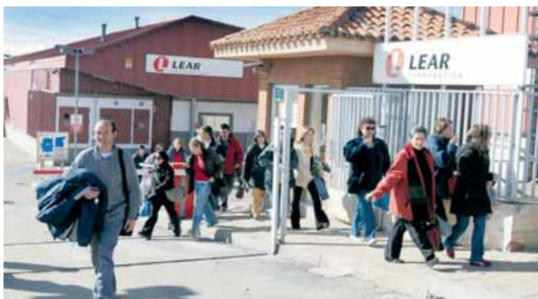
Trabajadores de Lear abandonan la factoría tras su turno de trabajo.

El viernes 22 abandonan la factoría 127 empleados de los 316 que aún quedan