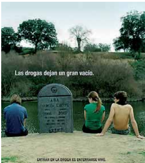
Imagen de una campaña para evitar el consumo entre los jóvenes.

Por otro lado, el Gobierno regional declaró proyectos de Especial Interés para Castilla y León cuatro iniciativas empresariales de las cuales dos se instalarán en Soria, una en León y otra en Valladolid. La inversión prevista se cifra en torno a 13 millones de euros y supondrán la creación de más de 60 empleos. Estos proyectos con esta clasificación de Especial Interés se analizarán en el Consejo Rector de la Agencia de Inversiones y Servicios para que la Comisión Delegada de Asuntos Económicos establezca el límite de apoyo económico. Aunque las ayudas de la Junta estarían en 1,6 millones de euros.