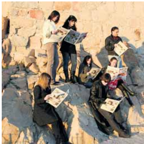
Equipo de 'Gente en Ávila'.