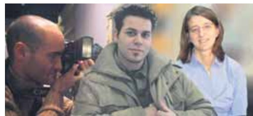
'Gente en Ávila', un equipo joven.