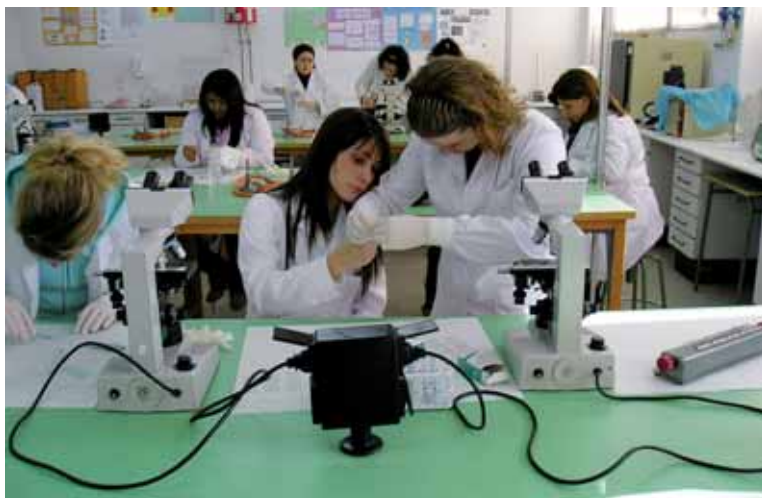
Cerca de 400 profesionales médicos superan con éxito las pruebas del MIR en Castilla y León.

Cada año el 40 por ciento de los estudiantes que acaban el MIR optan por trabajar fuera