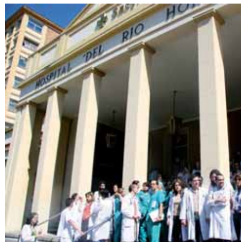
Médicos residentes sanitarios a la puerta del Hospital del Río Hortega.