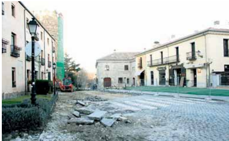
Los trabajos para la remodelación de la calle San Segundo se iniciaron a principios de semana.

Asimismo, se ampliará la acera situada junto a la Muralla, ya