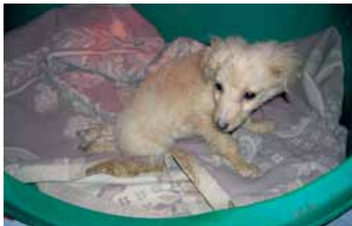
Uno de los perros realojados ahora en la Protectora de Ávila.