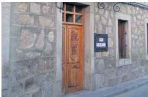
Ayuntamiento de Casavieja.