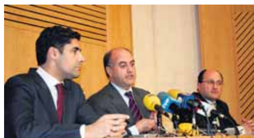
Presentación del proyecto 'Urban' en el Auditorio de San Francisco.

El proyecto cuenta con ocho objetivos principales, que abarcan desde las nuevas tecnologías hasta la puesta en marcha de planes específicos de formación profesional y lingüística, pasando por actuaciones medioambientales, y nuevas infraestructuras.