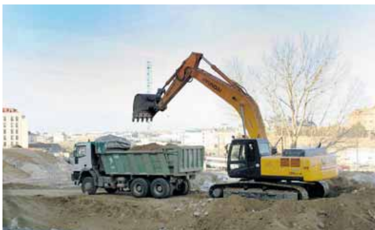
Las obras para la urbanización de la Unidad de Actuación Renfe ya han comenzado.

Las obras las está llevando a cabo la empresa Vías y Desarrollos Urbanísticos, propietaria de los terrenos. Con la urbanización se construirá una gran plaza peatonal frente a la Estación de Renfe, que contará con las correspondientes paradas de taxis y de autobús urbano.