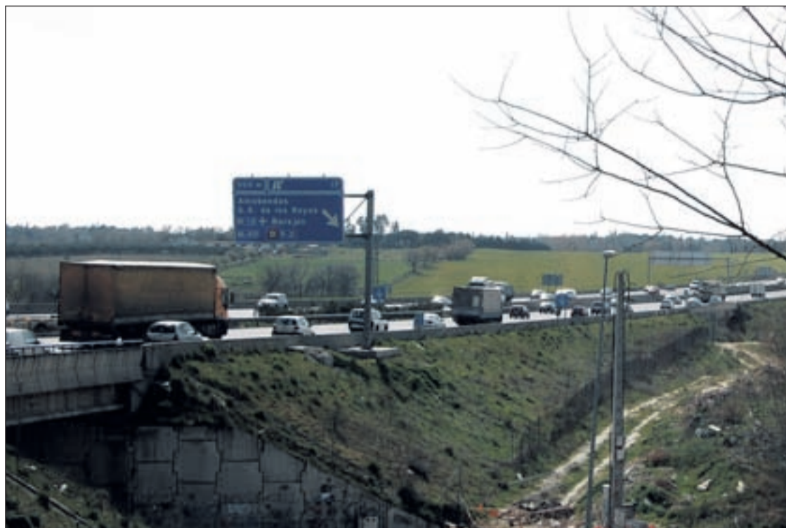
El tráfico ya se nota en la entrada de los municipios MAR CEJAS/GENTE

ALCOBENDAS Y SANSE NO TIENEN NINGÚN PUNTO NEGRO