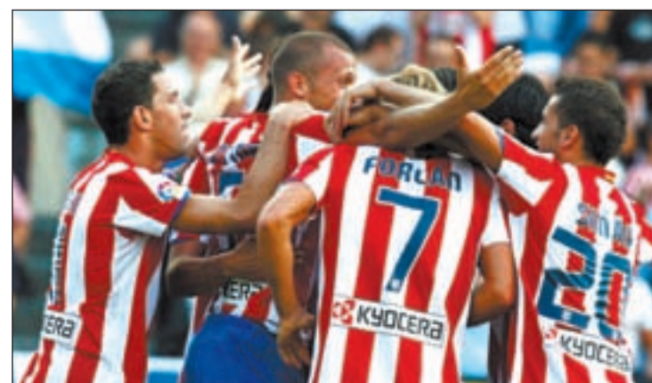
El Atlético de Madrid vive un momento de euforia

en pocos días, lo que, unido a que el partido se juega en sábado, hace a Aguirre preguntarse si es el momento de dar descanso al Kun y a Forlán. El debut en Champions con el PSV el martes decanta la balanza hacia la opción descanso, pero el Atleti quiere seguir sonriendo.