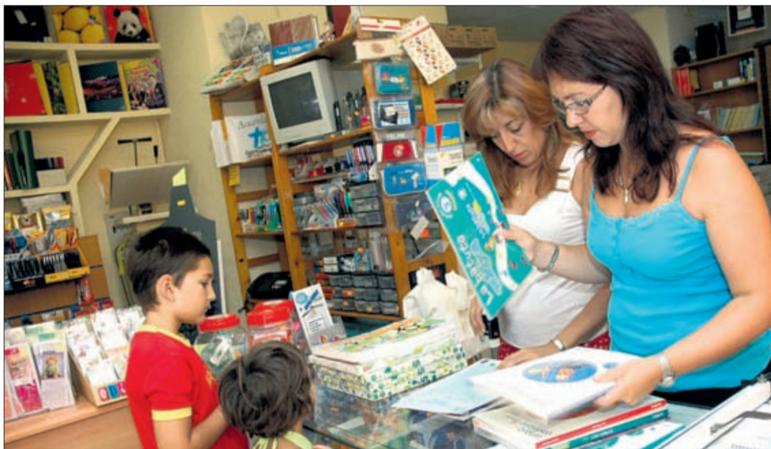
Las familias equipan a sus hijos con material escolar y preparan la vuelta al colegio