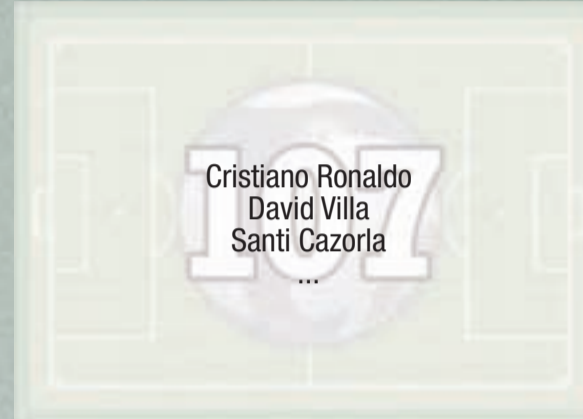
Cristiano Ronaldo David Villa Santi Cazorla ...