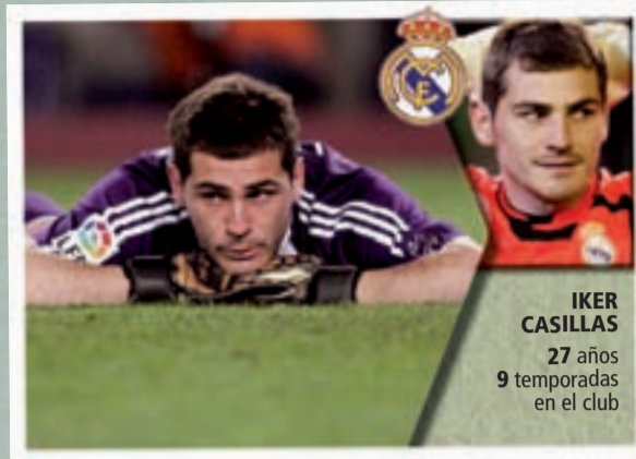
IKER CASILLAS 27 años 9 temporadas en el club