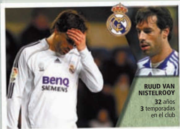
RUUD VAN NISTELROOY 32 años 3 temporadas en el club

Una temporada más, el peso del grupo recaerá en los jugadores más veteranos