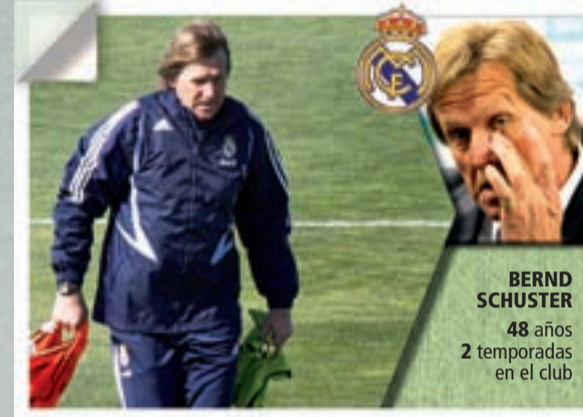
BERND SCHUSTER 48 años 2 temporadas en el club

han querido vestirse de blanco, ya que, según el propio Guti, "quieren venir al Madrid aunque ahora digan lo contrario".