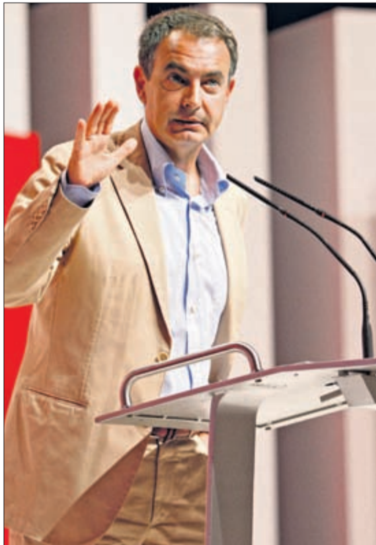
Zapatero quiere que la crisis no se prolongue más allá del 2009

El Gobierno, señalaba Zapatero, quiere que los parados de la construcción trabajen en actividades de interés colectivo, como prevención de incendios, rehabilitación de viviendas so-