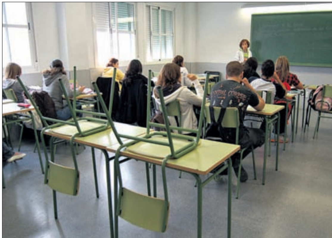
Los clases empezarán el 16 de septiembre

Los gastos de ropa o uniforme, incluyendo también el calzado, supone uno de los gastos que más encarece a los padres el regreso a las aulas de sus hijos. En los centros públicos se estima el gasto en ropa en 135 euros, cifra que se duplica en el caso de los concertados y que