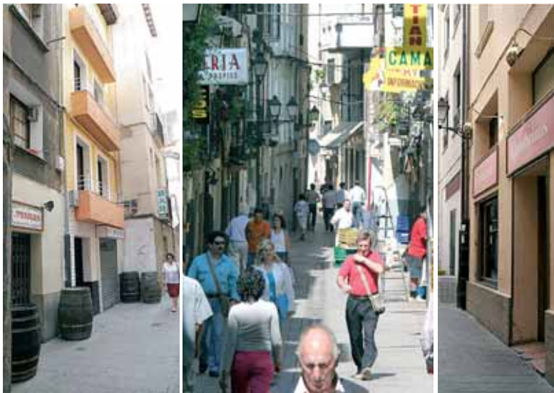
La calle tiene el encanto de combinar en pocos metros, cultura, viviendas y bares.