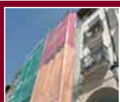
Premios a la rehabilitación y música en directo