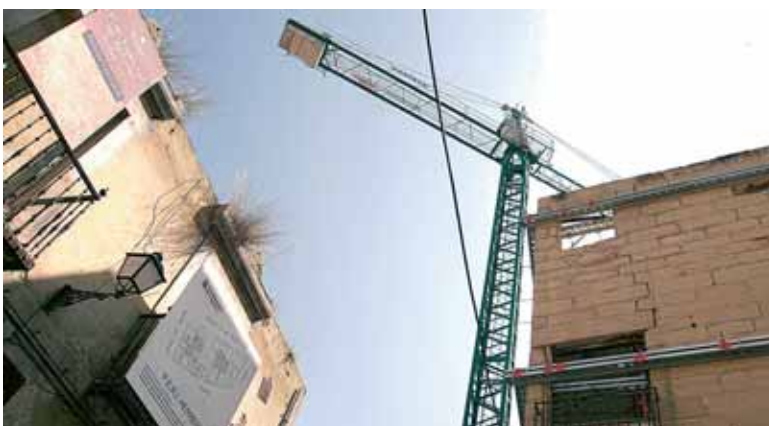
La Rehabilitación en el Casco Antiguo de Logroño este año tendrá su premio.

Los ciudadanos interesados podrán conocer la relación de proyectos presentados a través de una exposición que se inaugurará en el mes de octubre.