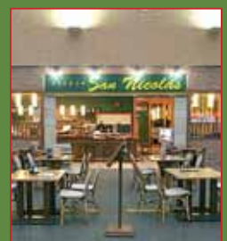
Asador SAN NICOLÁS