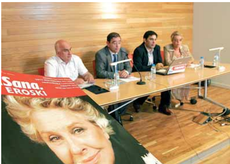
La iniciativa pretende concienciar del riesgo que entrañan los malos hábitos a la hora de exponerse al sol.