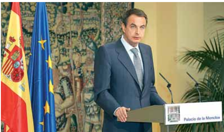
El presidente del Gobierno español acudirá al Riojaforum de Logroño y seguidamente a Alfaro.

NÚMERO 53 - AÑO 2 - DEL 23 AL 29 DE JUNIO DE 2006 - DISTRIBUCIÓN GRATUITA 50.000 EJEMPLARES - CONTROLADO POR PGD CLASIFICADOS: 941 24 88 10