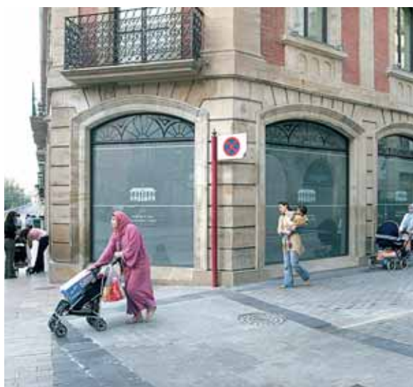
El aumento de inmigrantes ha hecho pegar un tirón al padrón de la ciudad de Logroño.

Del total de 147.182 habitantes de Logroño, nacidos en la ciudad son 67.489; 27.000 proceden del resto de la Comunidad riojana; unos 33.000, de otras Comunidades, especialmente de las más cercanas (Navarra, País Vasco y Castilla y León), mientras que 18.156 son extranjeros. Esta última cifra supone un aumento de 1.972 personas procedentes de fuera de España, con respecto al 2005 -en que se habían contabilizado 16.184 extranjeros-. En su mayoría, los inmigrantes que residen en Logroño proceden de Rumanía (3.872), Pakistán (2.306), Marruecos (2.039) Colombia (1.663), Bolivia (1.518), Ecuador (1.430) y a una larga distancia Argentina (444).