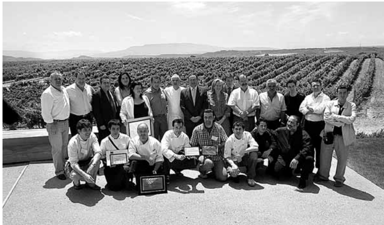
Ganadores, organizadores, jurado y autoridades posaron en una foto de familia tras conocerse el fallo.