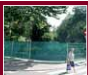
El parque Gallarza en el punto de mira de todos