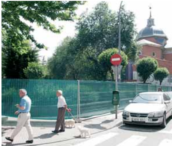
Las obras han empezado con críticas al proyecto, de vecinos y partidos de la oposición.

Partido Popular, Partido Socialista y Partido Riojano discrepan sobre la reforma