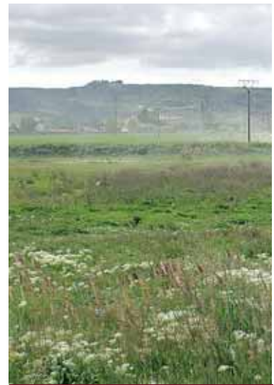
Definitivamente ha quedado cerrado el caso Las Tejeras.