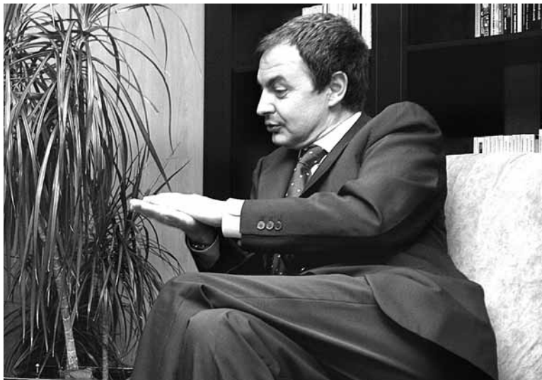
El presidente del Gobierno hablará con el presidente de la Comunidad y con el Consejo Regulador.

De esta forma pondrá fin a su visita en Logroño, trasladándose en automóvil hasta Alfaro en donde irá directamente hasta las