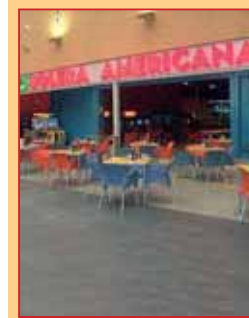
Bolera LAS CAÑAS