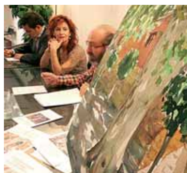
Los organizadores posan con la acuarela ganadora en 2005.