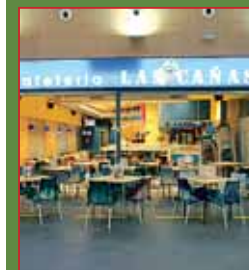
Cafetería LAS CAÑAS