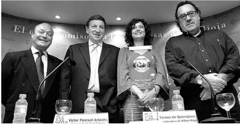
Un momento de la presentación de una nueva convocatoria de los premios 'Best Of'.

Los galardones están organizados por Bilbao-La Rioja, a través de la Red de Capitales y Grandes Viñedos, y constan de ocho categorías