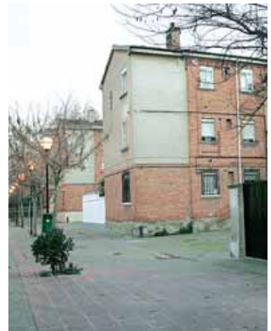
Yagüe ha centrado buena parte de las actuaciones del Distrito.