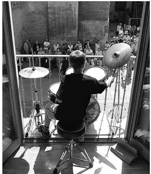
"Piccolo y Saxo" amenizó la celebración de este quinto aniversario.