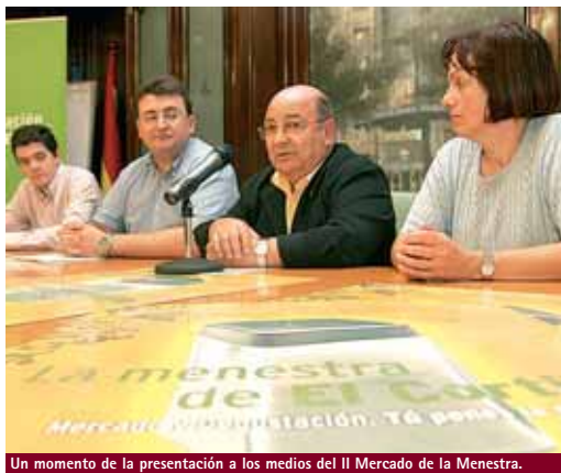
Un momento de la presentación a los medios del II Mercado de la Menestra.