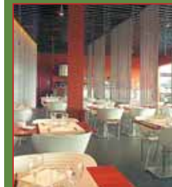
Restaurante OCA LAS CAÑAS