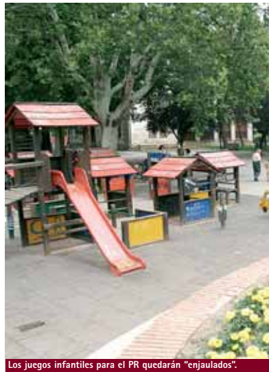
Los juegos infantiles para el PR quedarán "enjaulados".

Asimismo la preocupación del grupo municipal socialista se debe a que este parque "se convierta en una plaza, pues se perdería el aspecto afectivo y sentimental de las relaciones que se dan desde siempre" en el mismo, indicando al gobierno del Ayuntamiento que "no hagan desaparecer parte de los árboles".