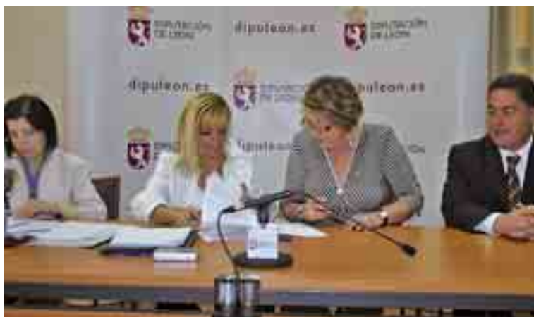
Momento de la firma entre la presidenta Isabel Carrasco y la alcaldesa de Mansilla de las Mulas, María Paz Díez.

"Ésta es una muestra más del apoyo que la Diputación Provincial de León otorga a la tradición musical de la provincia", detalló la presidenta Isabel Carrasco, quien de paso recordó que los convenios para subvencionar las escuelas de música se formalizan desde 1992. Para el curso 2007/08 se destinaron 609.918 euros para sufragar los costes del profesorado de 12 escuelas de música municipales. En concreto, a la retribución de 22 profesores de música de Grado Medio a tiempo completo y 5 profesores a tiempo parcial. Para el curso 2008/09 el crédito que se destinará a dichas escuelas será por el mismo importe que el destinado en 2007/08.