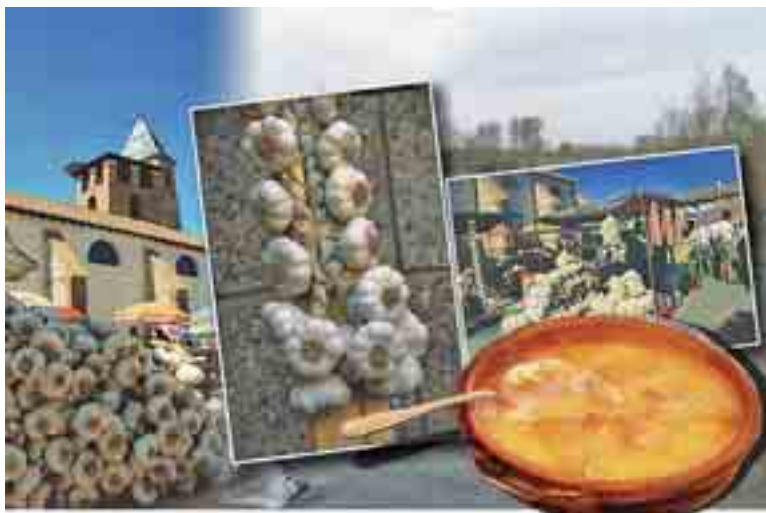
La visita a la torre y el reloj de la villa de Santa Marina del Rey podrán realizarse del 11 al 13 de julio en las jornadas gastronómicas y también en la Feria del Ajo.

Pero, además, el Ayuntamiento ha organizado un completo programa de actividades para ofrecer a quienes acudan a las jornadas gastronómicas que se presentaron el jueves 10 en El Corte Inglés de León. Durante los tres días se abrirá y podrá visitar la torre de la iglesia de Santa Marina del Rey, con el atractivo de su afamado reloj. También el viernes 11 tendrán lugar dos conferencias centradas en el ajo y sus propiedades saludables y culinarias, que culminarán con una degustación de productos a base de ajo. Las I Jornadas Gastronómicas del Ajo cuentan con el patrocinio de Caja España, la Diputación de León, Queserías La Cañada y las bodegas Señorío de Chozas.