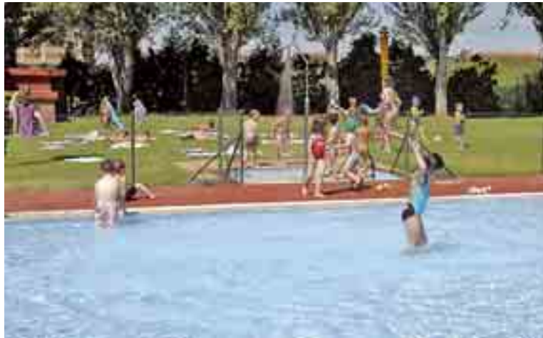
Las piscinas municipales de la capital leonesa reciben a diario a cientos de personas, entre grandes y pequeños.

Aquellos que prefieran combinar instalaciones cerradas y abiertas, tienen la posibilidad de acudir del Estadio His-