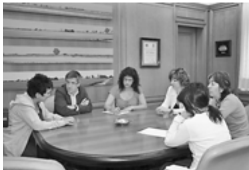
El alcalde recibió a la Fundación acompañado por la edil de Bienestar Social.

Por otro lado, la Fundación aprovechó el encuentro con el alcalde para pedirle que apoye una nueva