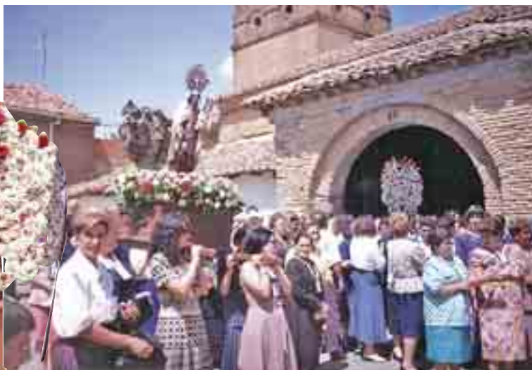
La procesión en honor a la Virgen del Carmen es el momento más emotivo de las fiestas de cada año.